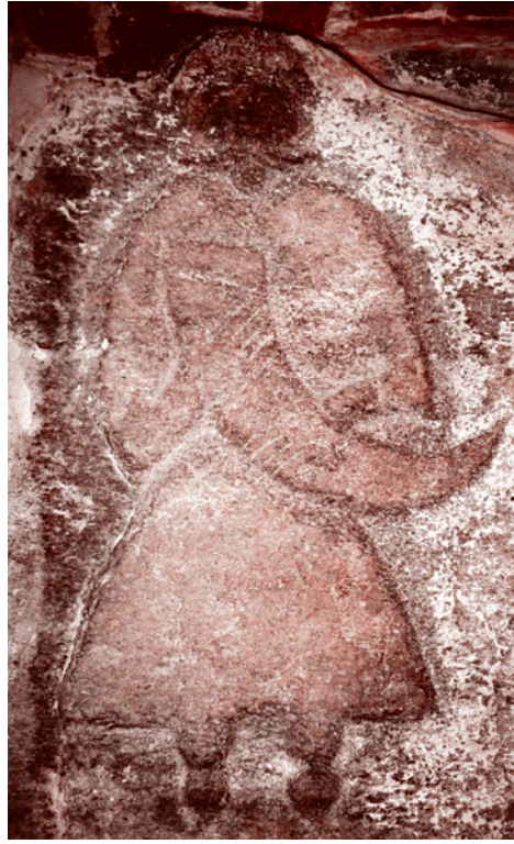
«Камень Свантевита (Святовита)» в стене Старой церкви Альтенкирхена на острове Рюген

А. К. Толстым в «Истории государства российского». Мол, Рюрик-то был норманским князем, правившим в Финляндии. Но его мать была дочерью славянского старейшины ильменских славян Гостомысла, умершего ок. 860 года и фигурирующего в ряде летописей XV–XVI веков в связи с призыванием варягов для княжения на Руси.