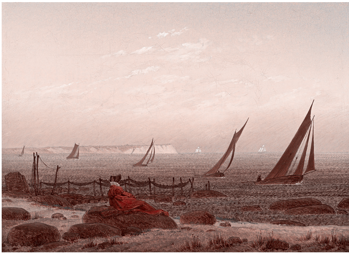
Каспар Давид Фридрих. Женщина на берегу острова Рюген (Женщина у моря). Около 1818 г.

И епископ с клирной силой, На коленях в церкви стоя, Молит: «Боже, нас помилуй! Защити от Боривоя!»