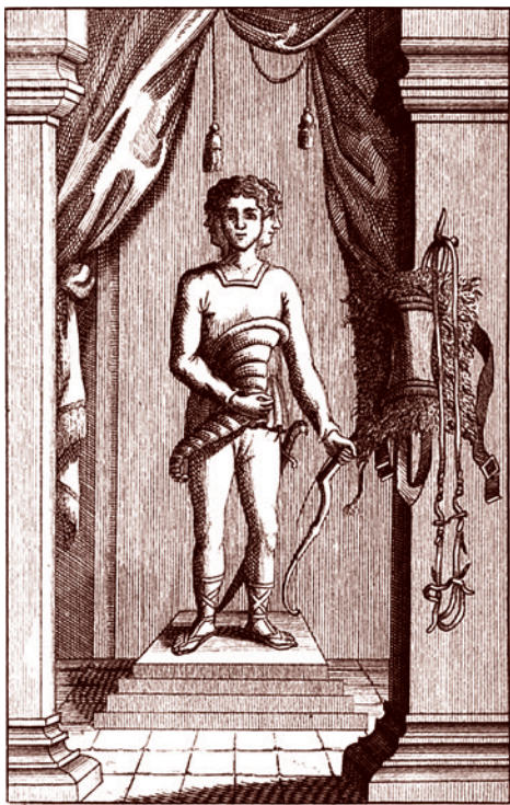
Световид, илл. к книге Мифология славянская и российская А.С. Кайсарова. 1804 г.

Волин — это торговый город западных славян, прежде всего, поморян. Он находился в устье Одера. К X веку считался чуть ли не одним из самых больших городов Европы. И, как минимум, самым крупным городом Северной Европы.