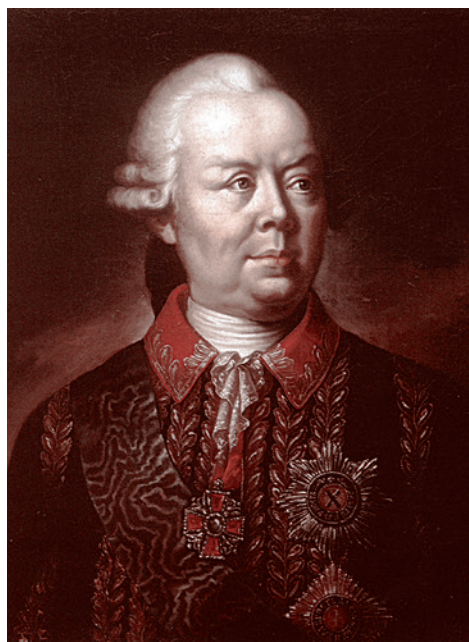
Неизвестный художник. Портрет Петра Александровича Румянцева-Задунайского. 1770-е

После окончания Первой мировой войны и распада Османской империи русско-турецких войн больше не было, и, казалось, уже не будет. Но вот совсем недавно вновь произошло обострение отношений с Турцией.