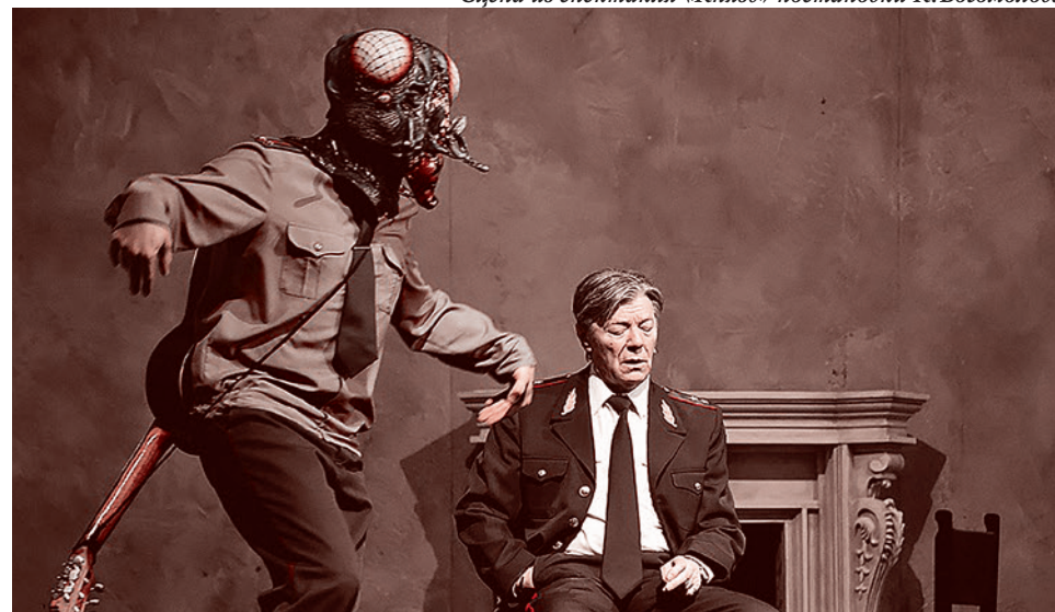
Сцена из спектакля «Князь» постановки К. Богомолова