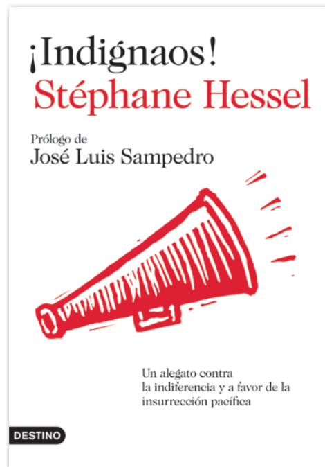
Обложка брошюры Стефана Фредерика Эсселя «¡Indignaos!»

«Надо сказать также, что к шестидесятилетию программы «Национального Совета Сопrotивления» 8 марта 2004 года, мы — ветераны движений Сопrotивления и боевые силы Свободной Франции (1940–1945), говорим: это правда, что «нацизм был разгромлен благодаря самопожертвованию наших братьев и сестер из Сопrotивления и Объединенных Наций против варварства фашизма. Но эта угроза не исчезла полностью и наш гнев против несправедливости еще цел». Нет, угроза