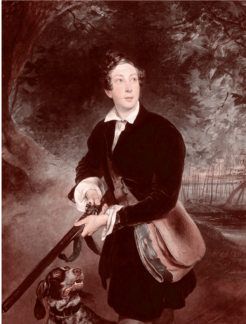
Карл Брюллов. Портрет Алексея Константиновича Толстого в юности. 1836 г.

Совсем не хочется, как говорится, шить льно в строку. И потому я всего лишь сообщаю читателю, что в 1827 году, когда десятилетний мальчик Алеша Толстой впервые выезжает за границу, происходит встреча этого десятилетнего мальчика с Гёте. Разумеется, встреча происходит потому, что родственники мальчика, организовавшие эту встречу, занимали высокое положение (Алеша Толстой поехал за границу вместе с матерью А. А. Перовской и ее братом Алексеем Перовским). Но для того, чтобы Гёте, уже являвшийся в 1827 году объектом всевропейского поклонения, не только встретился с родственниками мальчика, но и подарил мальчику кусок бивня мамонта, на котором сам небожитель Гёте нарисовал фре-