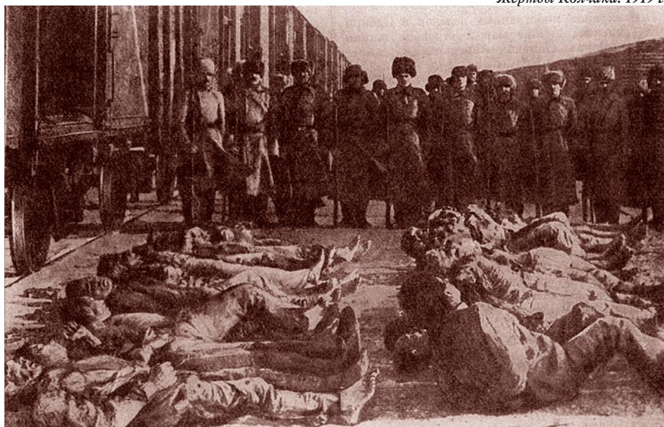
Жертвы Колчака. 1919 г.

нетта, он до последнего ждал помощи от колчаковского китобоя «Заря», однако тот задержался во льдах и пришел уже слишком поздно. Сам Колчак в ходе спасательной операции провалился под лед, что в дальнейшем сказалось на его здоровье и способности к настоящему военному делу. Можно только посочувствовать исследователю, пострадавшему в ходе выполнения своей миссии, — пожалуй, даже если миссия окончилась провалом. Однако странно слышать его имя в одном ряду с погибшим Толлем, Степаном Макаровым, Василием Чичаговым, Георгием Седовым, Георгием Брусиловым и многими другими. Еще более странно слышать про Колчака и не слышать про всех перечисленных выше героев-исследователей.