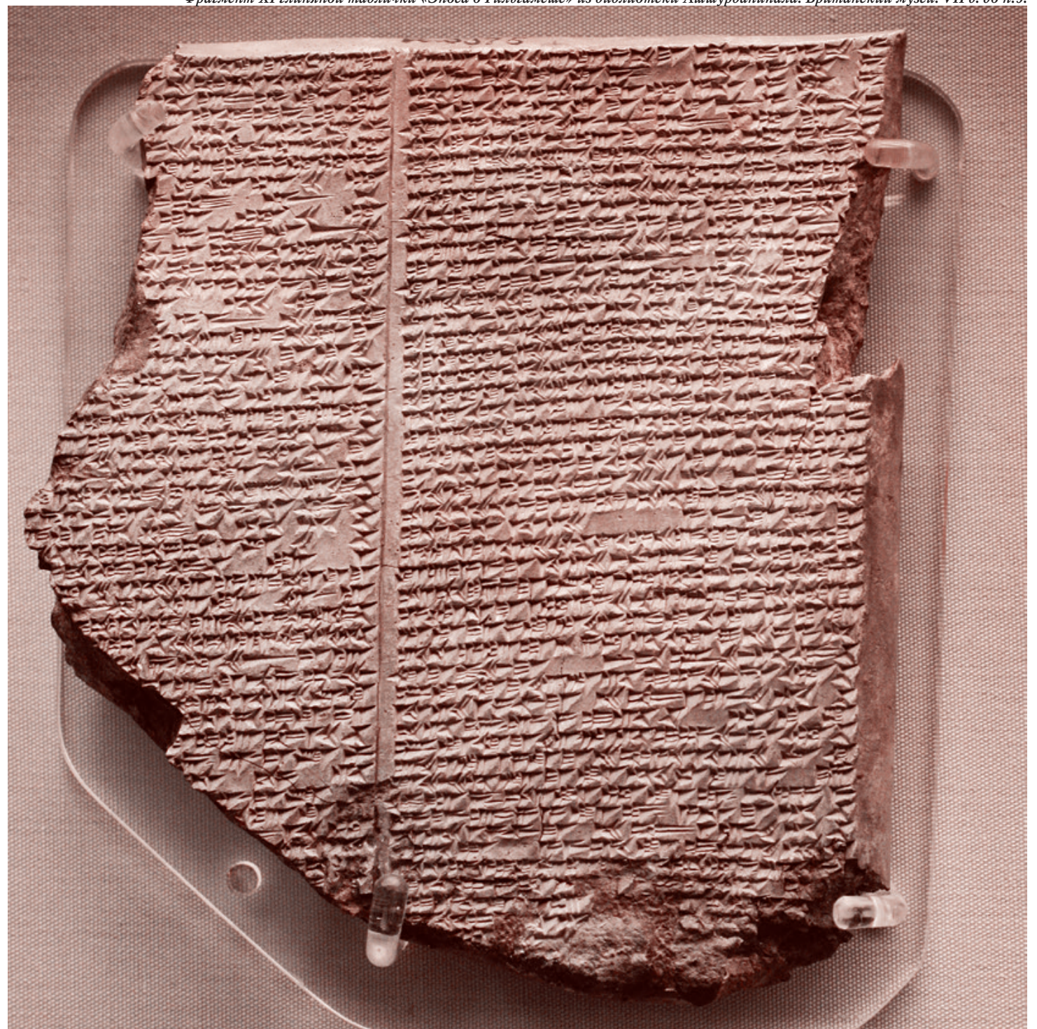
Фрагмент XI глиняной таблички «Эпоса о Гильгамеше» из библиотеки Ашшурбанипала. Британский музей. VII в. до н.э.