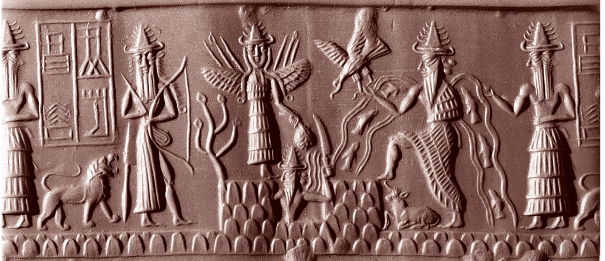
Отпечаток цилиндрической печати аккадского периода. Бог Эа изображен с потоками воды, в которых плавают рыбы. Примерно 2300 г. до н.э.

Энки знает, что за стеною, к которой он обращается, находится праведник Зиусудра, к которому на самом деле обращены его слова и его наставления. Энки инструктирует Зиусудру по поводу строительства ковчега, но на единственной дошедшей до нас клинописной табличке эти инструкции стерты. Зиусудра спасается со своей семьей и представителями животного и растительного мира. Потоп длится семь дней и семь ночей. После потопа боги даруют Зиусудре и его жене вечную жизнь. Боги поселяют этих праведников, которых, между прочим, хотели погубить, на блаженном острове Дильмун и даруют им вечную жизнь.