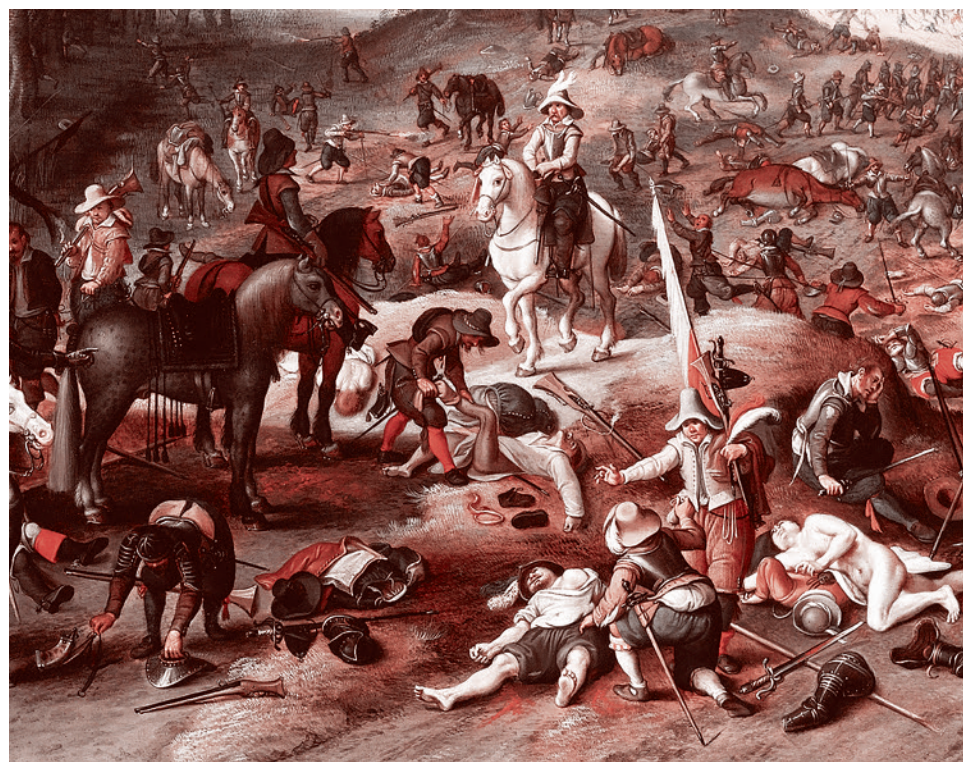
Себастьян Вранкс после Питера Брейгеля Младшего. Мародерство после битвы (фрагмент). XVII век.

Вацлав Вацлавович Воровский (1871–1923) — русский революционер, публицист и литературный критик. А еще он один из первых советских дипломатов, убитый бывшим белогвардейским офицером, гражданином Швейцарии Морисом Морисовичем Конради.