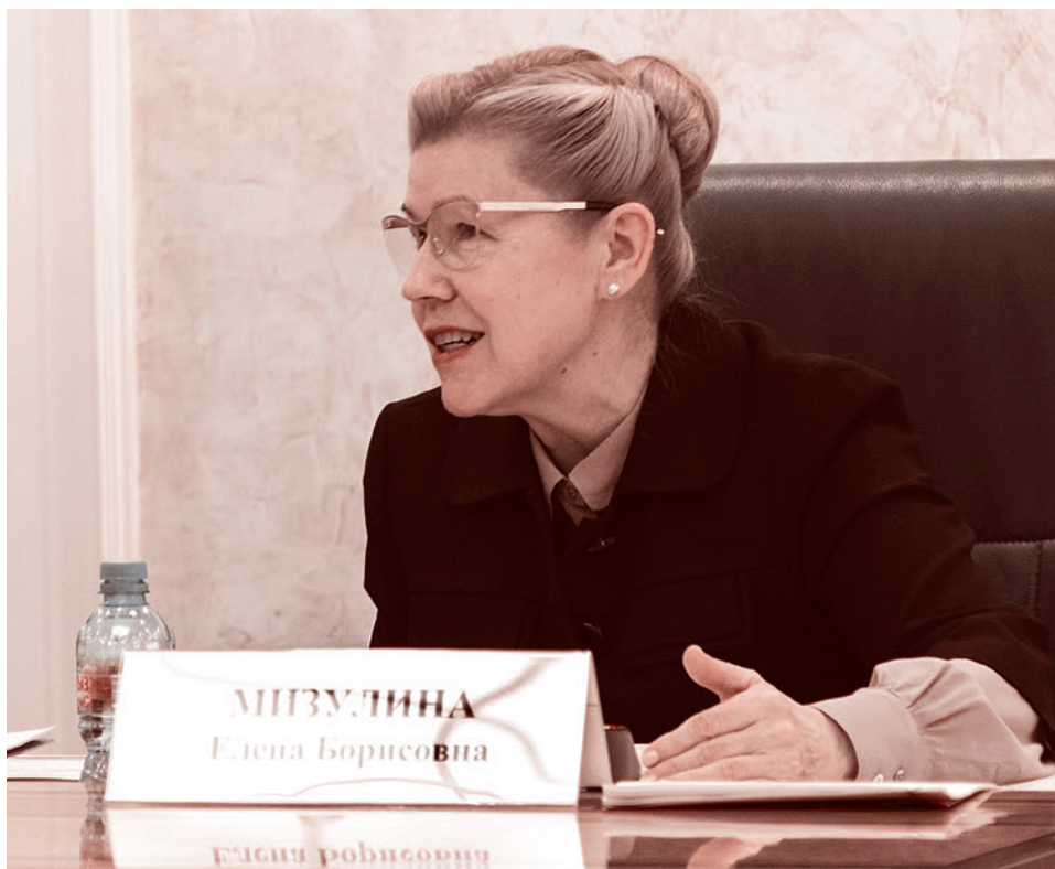
Е. Б. Мизулина выступает на Парламентских слушаниях в Совете Федерации. 27 октября 2016 г.

Из выступления Елены Мизулиной на Парламентских слушаниях в Совете Федерации 27 октября 2016 года