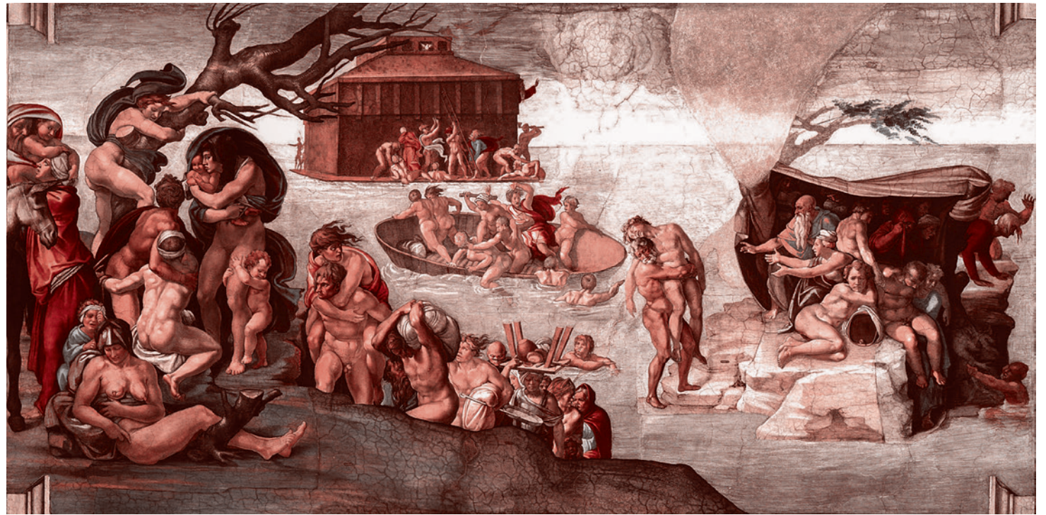
Микеланджело Буонарроти. Всемирный потоп. Фреска в Сикстинской капелле. 1508–1509 гг.

Такая констатация, аргументацию в пользу которой я опускаю по уже изложенным выше причинам, имеет существенное значение. Потому что очень не хочется заниматься тем, про что нельзя сказать, было оно или не было. Древний Египет был, Древний Шумер был, Древняя Финикия с Ливией были, Древняя Греция и Древний Рим — тем более. А вот Атлантида и тем более Лемурия... То ли реальность, то ли выдумка. Пойдешь по следам выдумки — обязательно забредешь не туда. А поскольку путь твой и без того извилист, то и без того высокая вероятность оказаться в исследовательском тупике еще больше возрастает. Поэтому я, обсуждая Атлантиду,