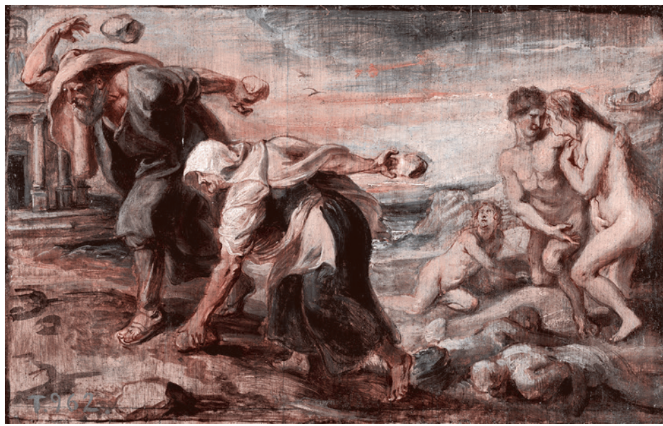
Питер Пауль Рубенс. Девкалион и Пирра. 1636 г.

По поводу Миния есть много разных легенд. Но поскольку мы решили опираться на наиболее авторитетные источники, то необходимо ориентироваться на легенду, сообщаемую уже знакомым нам Аполлоном Родосским (295–215 годы до на-