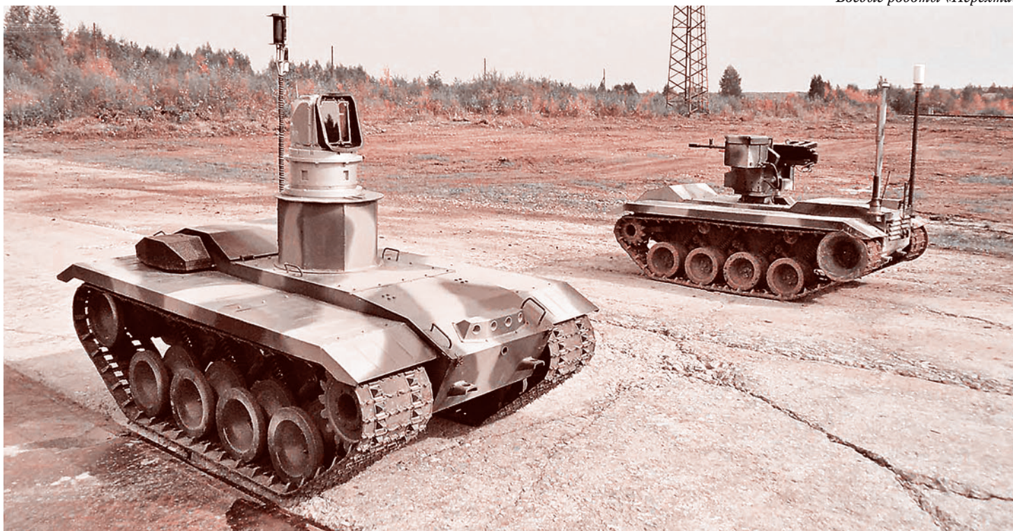
Боевые роботы «Нерехта»

И это лучший показатель положительных изменений в отношении общества к армии.