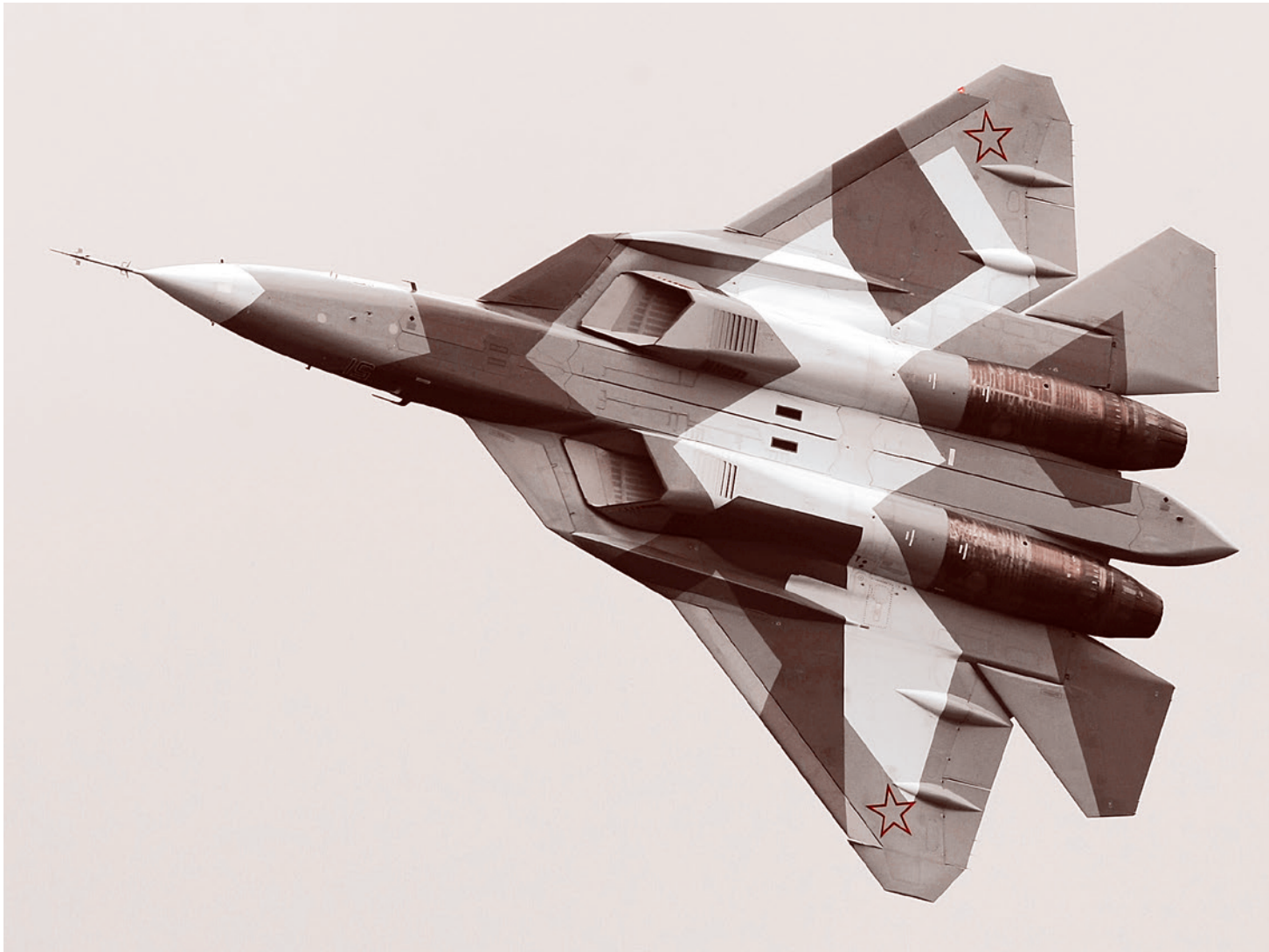
ПАК ФА Т-50