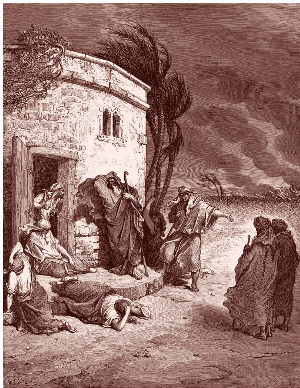
Гюстав Доре. Иов узнаёт от вестников о своих несчастьях. 1866 г.

не отвечающее его стремлениям. Тогда зачем Гёте вообще вводит Бога (непонятно какого), да еще утверждающего, что Фауст выбьется из мрака ему в угоду? Риску предположить, что именно для того, чтобы показать, что Фауст — это анти-Иов, поскольку есть фундаментальная разница между Иовом и Фаустом. Иов — символ смирения перед тем, что он считает волей Бога ( «Господь дал, Господь и взял [как угодно было Господу, так и сделалось]; да будет имя Господне благословенно!» ). Фауст же — олицетворение гордыни. Тем более странно выглядит финал «Фауста», где его объявляют спасенным. Зачем это понадобилось Гёте, и зачем он вывернул Иова наизнанку и вывел на сцену этакого анти-Иова?