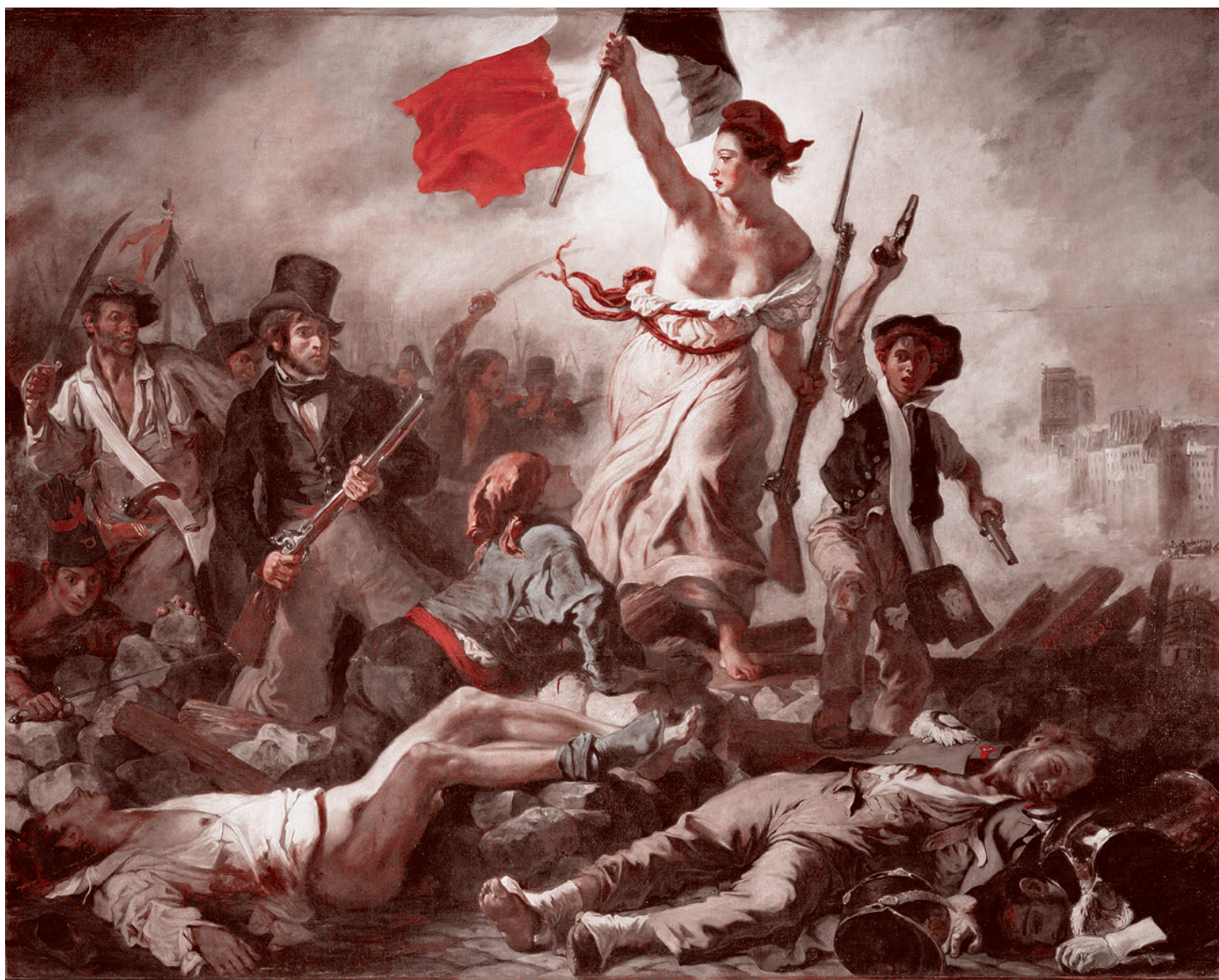
Эжен Делакруа. Свобода на баррикадах. 1830 г.

Романтики еще больше, чем критические реалисты, не приемлют дух буржуазной купли-продажи. Они либо зовут к новой, еще более радикальной буржуазной революции, повторяя и расширяя требования самых радикальных элементов времен Великой французской революции, либо понемногу впитывают марксизм, либо (в случае, если речь идет о так называемом реакционном романтизме) зовут назад, в средневековье. В любом случае возникает богатейшая культурная палитра. И никоим образом нельзя свести всё это богатство к воспеванию чистогана,