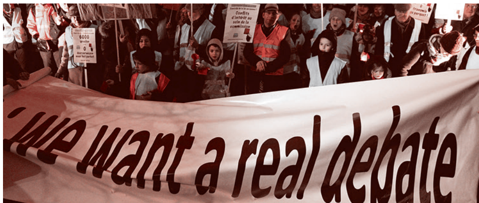
«Мы хотим настоящей дискуссии», митинг противников узаконивания детской эвтаназии в Бельгии. 11 февраля 2014 г.

Предостережения Зорькина в таком случае выглядят несколько беспомощно, поскольку, апеллируя к классическим идеям либерализма, всё, что он предлагает — это не отказываться от социальной нормативности общества Модерна. Беспомощным же выглядит то, что Россия, присоединившись