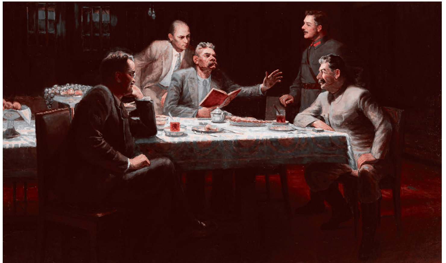
А. Яр-Кравченко. Горький читает свою сказку «Девушка и смерть» (фрагмент). 1940 г.

В каком смысле лондонская «Таймс» могла называть Марию Будберг «интеллектуальным вождем»? Какие интеллектуальные качества могут отмечаться западной элитой? И как к этим качествам относится Горький?