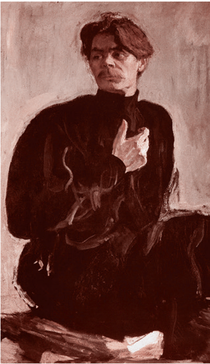
В.А. Серов. Портрет писателя А.М. Горького (фрагмент). 1905 г.

Роман-эпопея «Жизнь Клима Самгина» изначально задумывался Горьким как нечто большее, нежели просто художественное произведение. Для Алексея Максимовича было принципиально важно отобразить события революционной эпохи как можно более достоверно