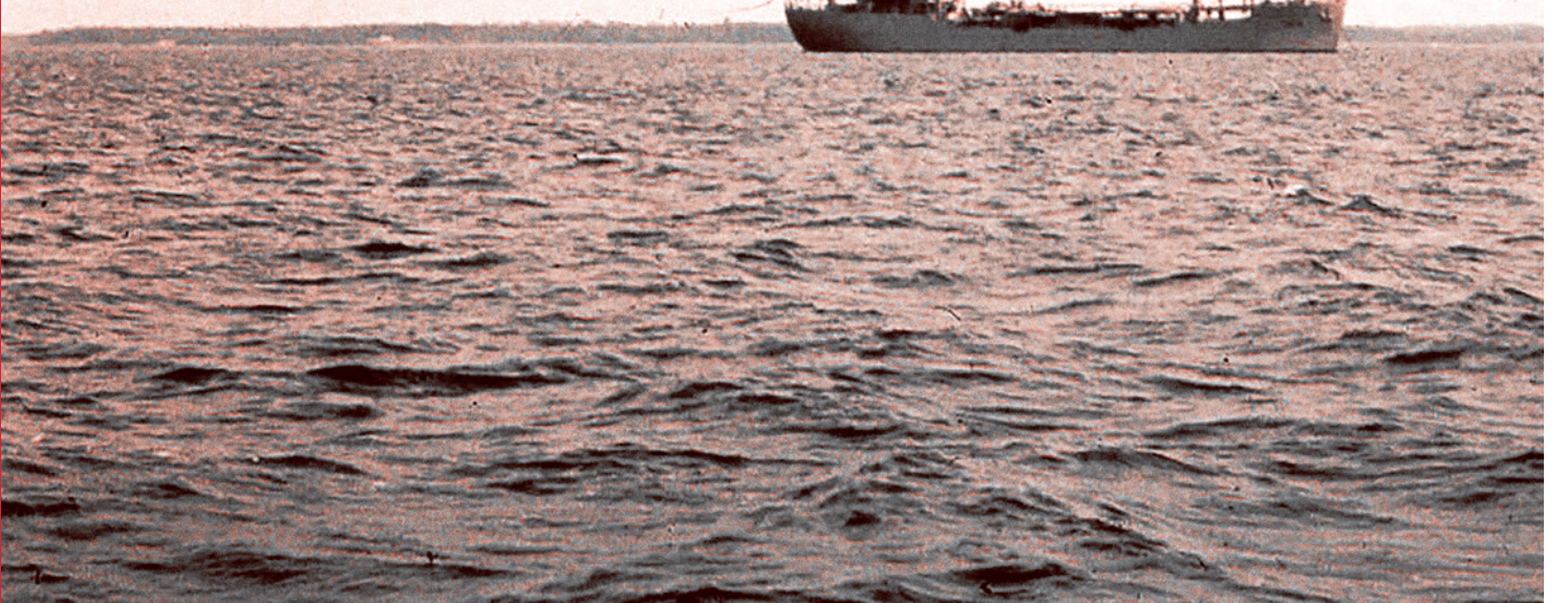
USCGC Courier, судно-ретранслятор «Радио Свобода». Вероятно 1960-е.