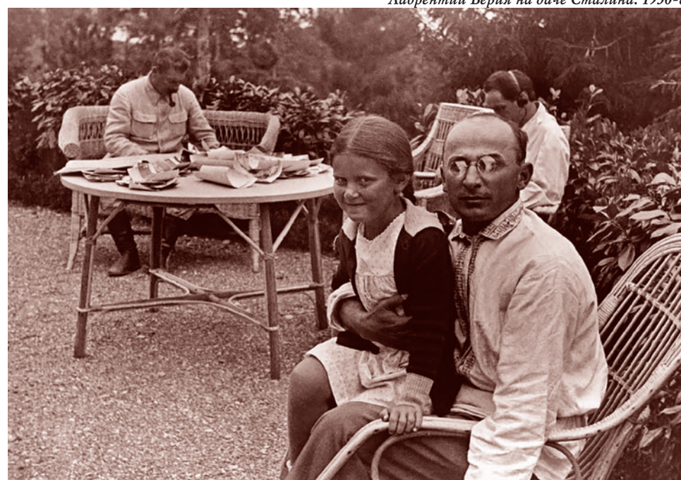
Лаврентий Берия на даче Сталина. 1930-е