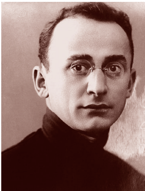
Лаврентий Берия. 1920-е

На территории Ирана (главным образом в Тебризе, Тегеране, Реште, Энзели