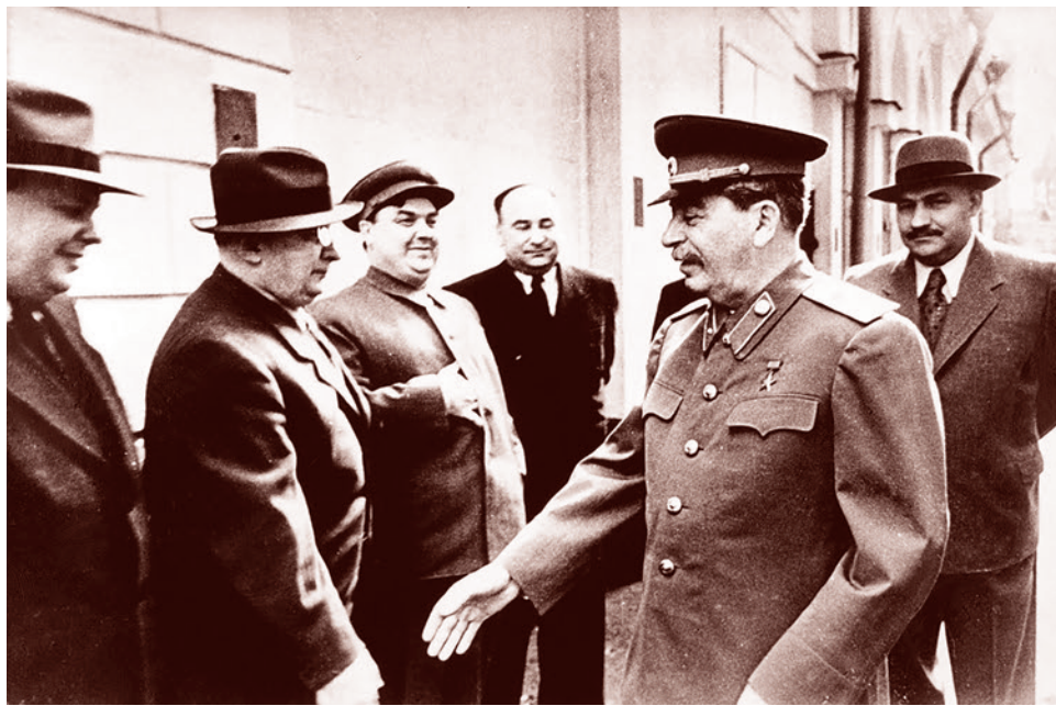
Л. Берия, Г. Маленков, И. Сталин, А. Каганович. После 1945 г.