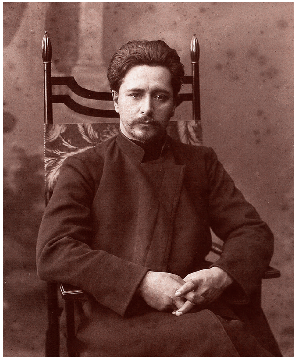
Леонид Андреев. 1903 г.

В гимназии и в университете учеником Леонид был неприлежным, отстающим и пренебрежительным к наукам, а также к «обычной» русской литературе. В школь-