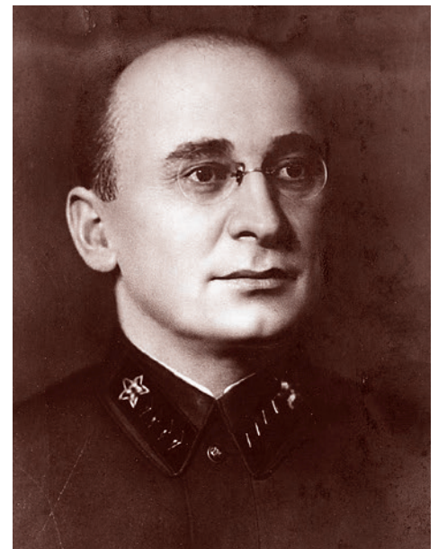
Лаврентий Берия. Начало 1940-х

и других городах) к 1920 году существовали организации «Адалет», в которые входили рабочие, ремесленники и мелкая городская буржуазия. Основные требования этих организаций (опубликованы в марте 1920 года): борьба с английским империализмом, шахским правительством, феодалами и передача земель крестьянам. В апреле-мае 1920 года в связи с подъемом национально-освободительного движения организации «Адалет» легализовались в Иранском Азербайджане и Гиляне. На I-м съезде (22–24 июня 1920 в Энзели) иранские организации «Адалет» объединились в Иранскую коммунистическую партию».