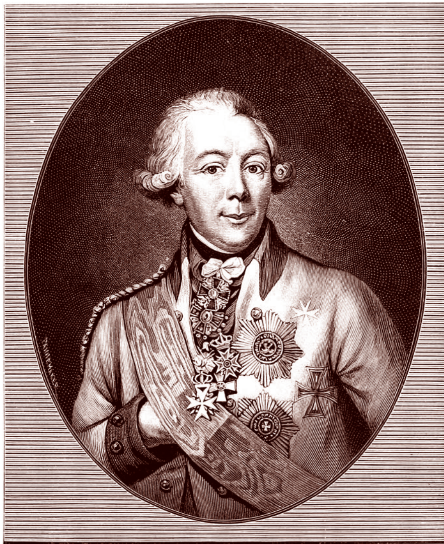
Граф Петр Алексеевич Пален. С гравюры Валькера, сделанной с портрета Кюгельхена

Павлу противостоял настолько обширный заговор, что возникает мысль о глубоком неприятии грандиозных павловских реформ большей частью элиты России. Сотни фамилий — дворянство, чиновничество (вплоть до губернского — Смоленский заговор), военные (заговор Каховского в Малороссии) — образовывали разветвленную сеть заговорщиков в России и за рубежом. Теперь двигаемся дальше.