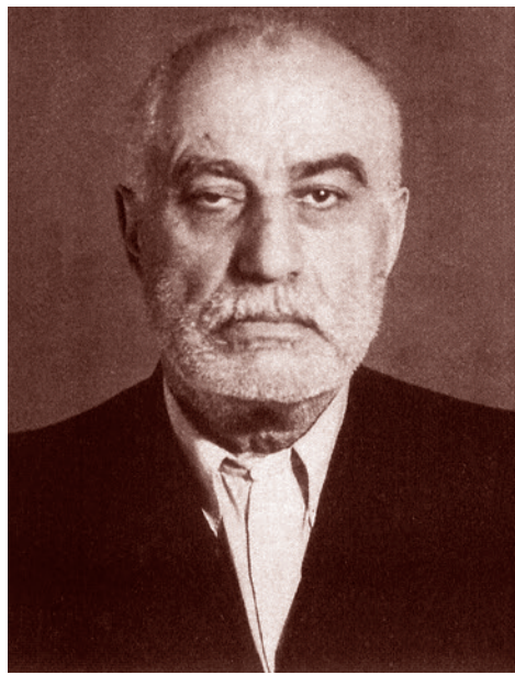
Мир Джафар Багиров (тюремная фотография). 1953 г.