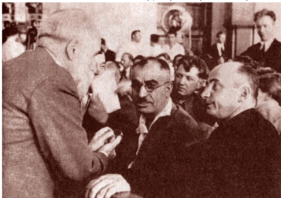
Филипп Махарадзе (спинной), Мир Джафар Багиров (в центре), Лаврентий Берия на съезде партии. 1935 г.

Тем не менее, подводя итог знакомства с биографией Багирова, можно отметить, что прямых свидетельств, доказывающих связь Берии и Багирова до 1921 года, не обнаружено. Интересными для изучения, однако, представляются связи Багирова с мусаватистами, через которые он теоретически мог быть знаком с деятельностью Берии в мусаватистской контрразведке. Говоря о подобных связях, следует упомянуть письмо бывшего разведчика Эфендиева, которое он написал 7 октября 1953 года на имя Хрущева. В этом письме он приводит восемь известных ему эпизодов, в которых Багиров определенным образом взаимодействовал и не арестовывал различных «антисоветских элементов»: мусаватистов, пантюркистов, турецких разведчиков и т. п.