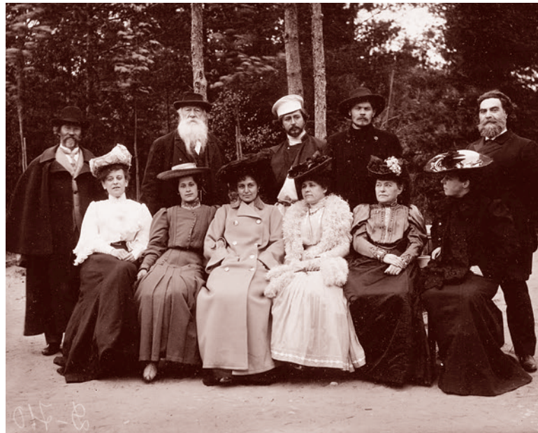
Карл Булла. Стоят слева направо И. Репин, В. Стасов, Л. Андреев, М. Горький, И. Тарханов, сидят их дамы в Пенатах. 1904 г.