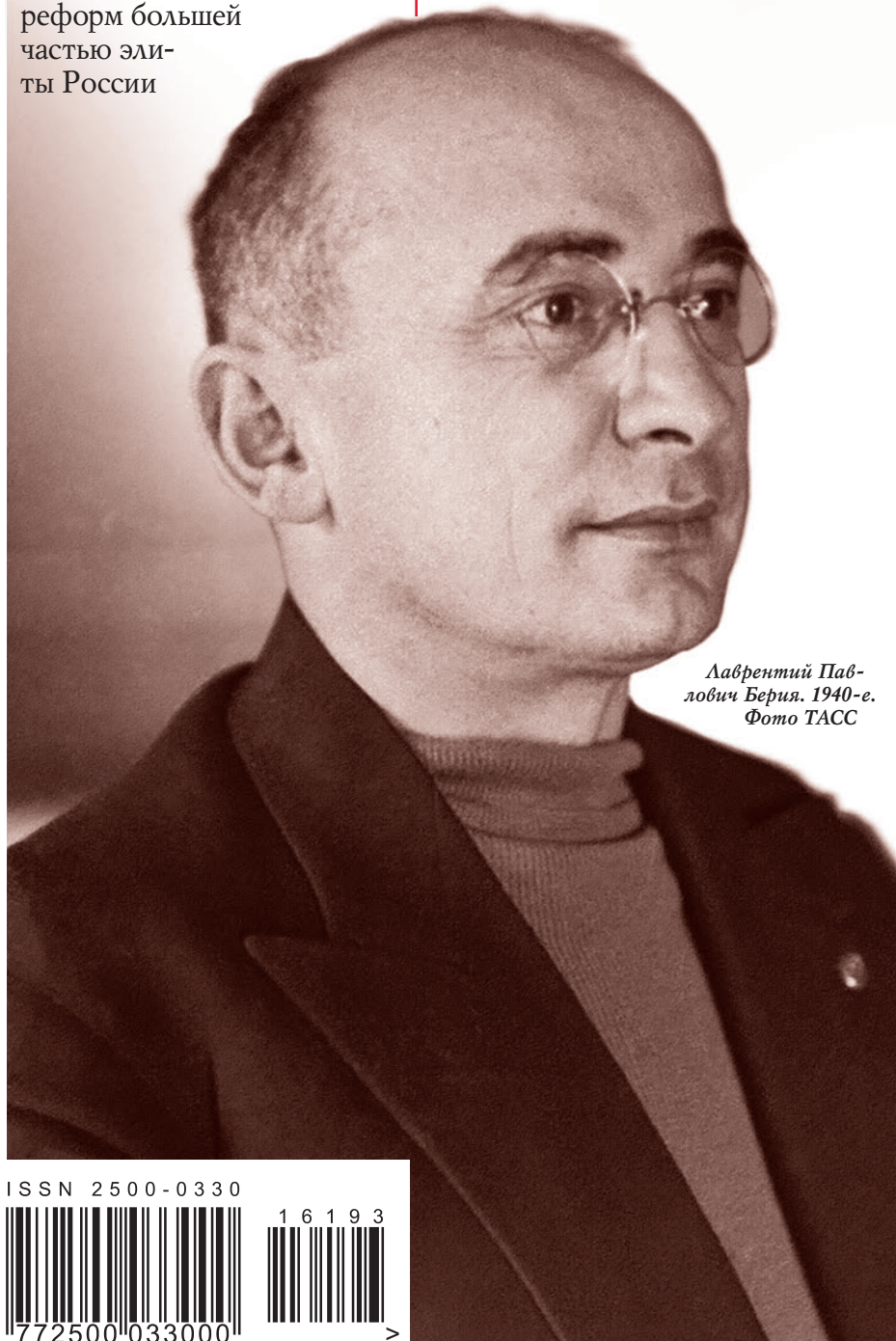
Лаврентий Павлович Берия. 1940-е.