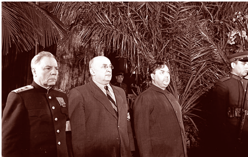
Ворошилов, Берия и Маленков в почетном карауле у гроба Сталина. 1953 г.

Тот факт, что во время Пленума у ЦК не было никаких свидетельств работы Берии на иностранные разведки, подтверждает Каганович, интервью с которым в 1989 году записал Феликс Чуев. На вопрос Чуева об аресте Берии Каганович прямо заявил: «Документов о том, что Берия связан с империалистическими державами и что он шпион и прочее, нам не представили. Таких документов ни я, ни Молотов не видели».