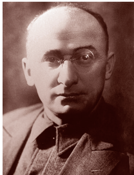
Лаврентий Берия. 1930-е