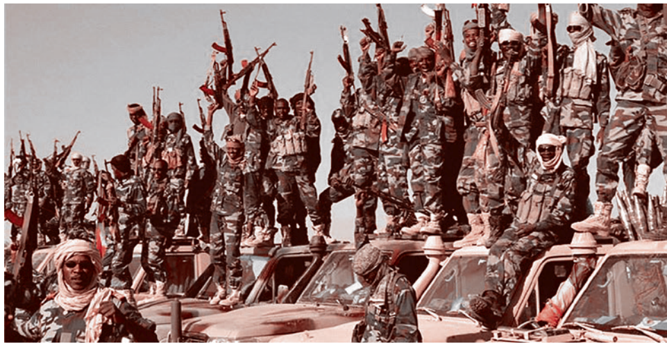
Военные из Чада пересекают границу Нигерии чтобы воевать против «Боко харам». 2015 г.

К этому моменту под властью «Боко харам» уже находились 15 областей на северо-востоке Нигерии целиком и еще 15 областей — частично.