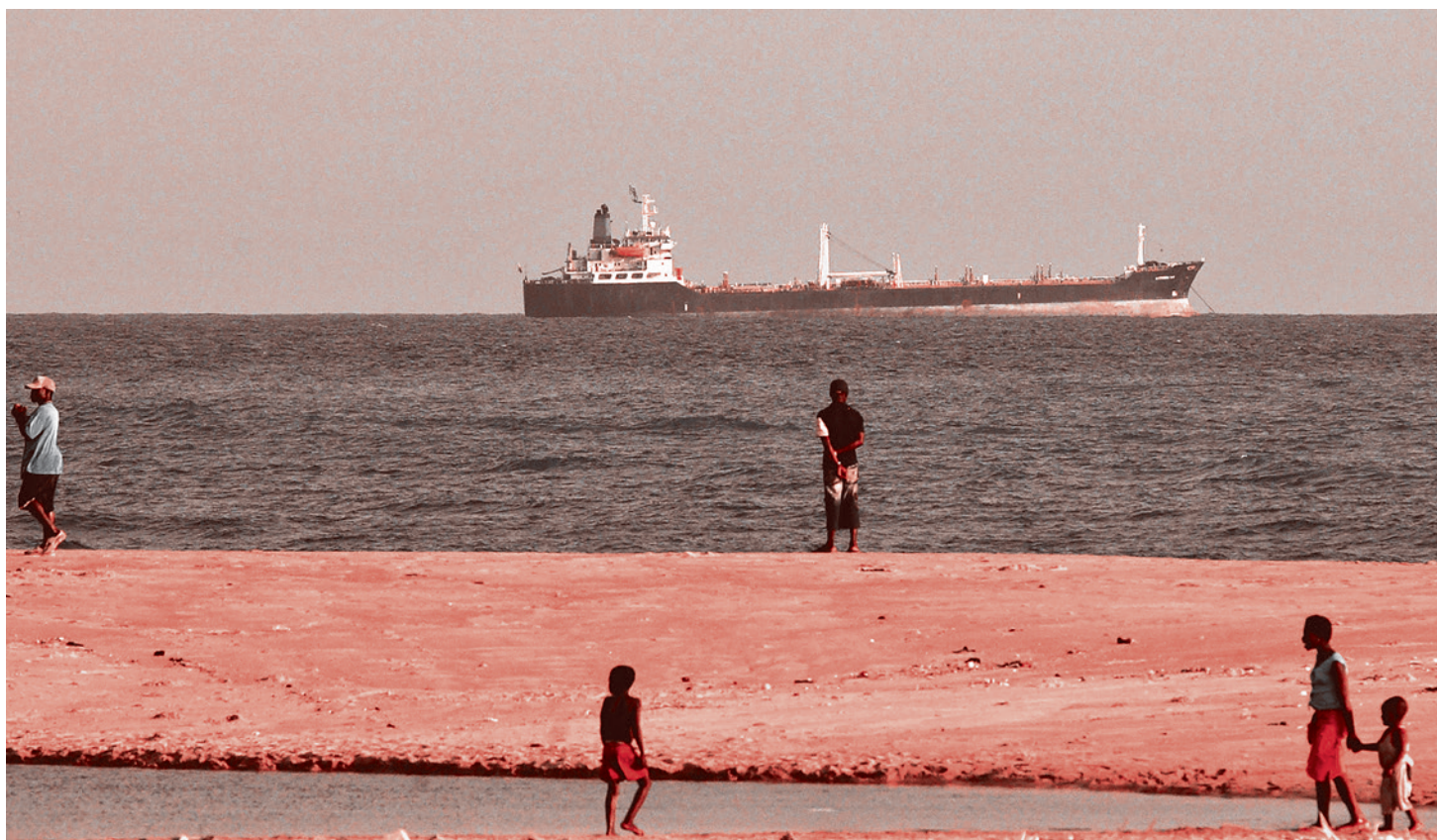
Берег залива Бенин. 2007 г.

поддержки воюющих между собой племенных ополчений различными «внешними» ЧВК.