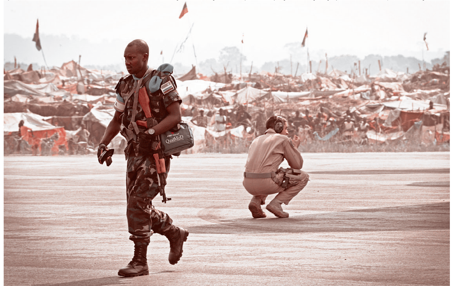
Руандский военный выходит из самолета ВВС США C-17 рядом с лагерем беженцев в международном аэропорту Банги Мпоко, ЦАР. 19 января 2014 г.

Здесь важен тот факт, что конфликт разгорелся с новой силой после того, как Китай обнаружил большое желание разрабатывать бурундийские месторождения никеля и решил для освоения этих месторождений строить железную дорогу из Бурунди к порту на побережье Индийского океана в Танзании.