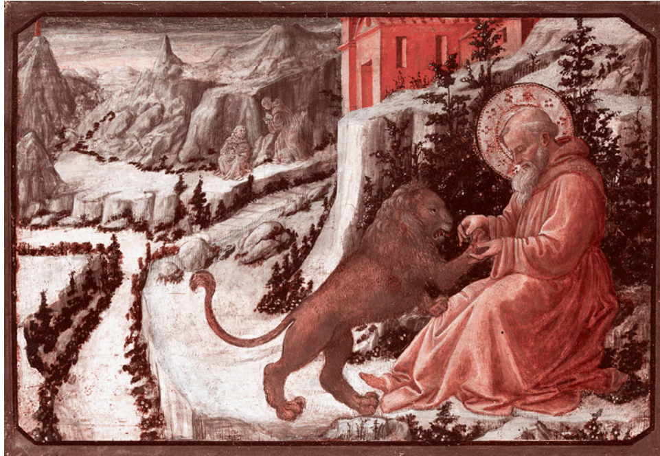
Фра Филиппо Липпи. Св. Иероним. 1456 г.

А ученые-библеисты, не относящиеся к числу предельно скованных догматами, спорят о том, были ли написаны обсуждаемые нами тексты в годы Вавилонского пленения (около 600 года до нашей эры) или в так называемый персидский период (около 400 года до нашей эры).