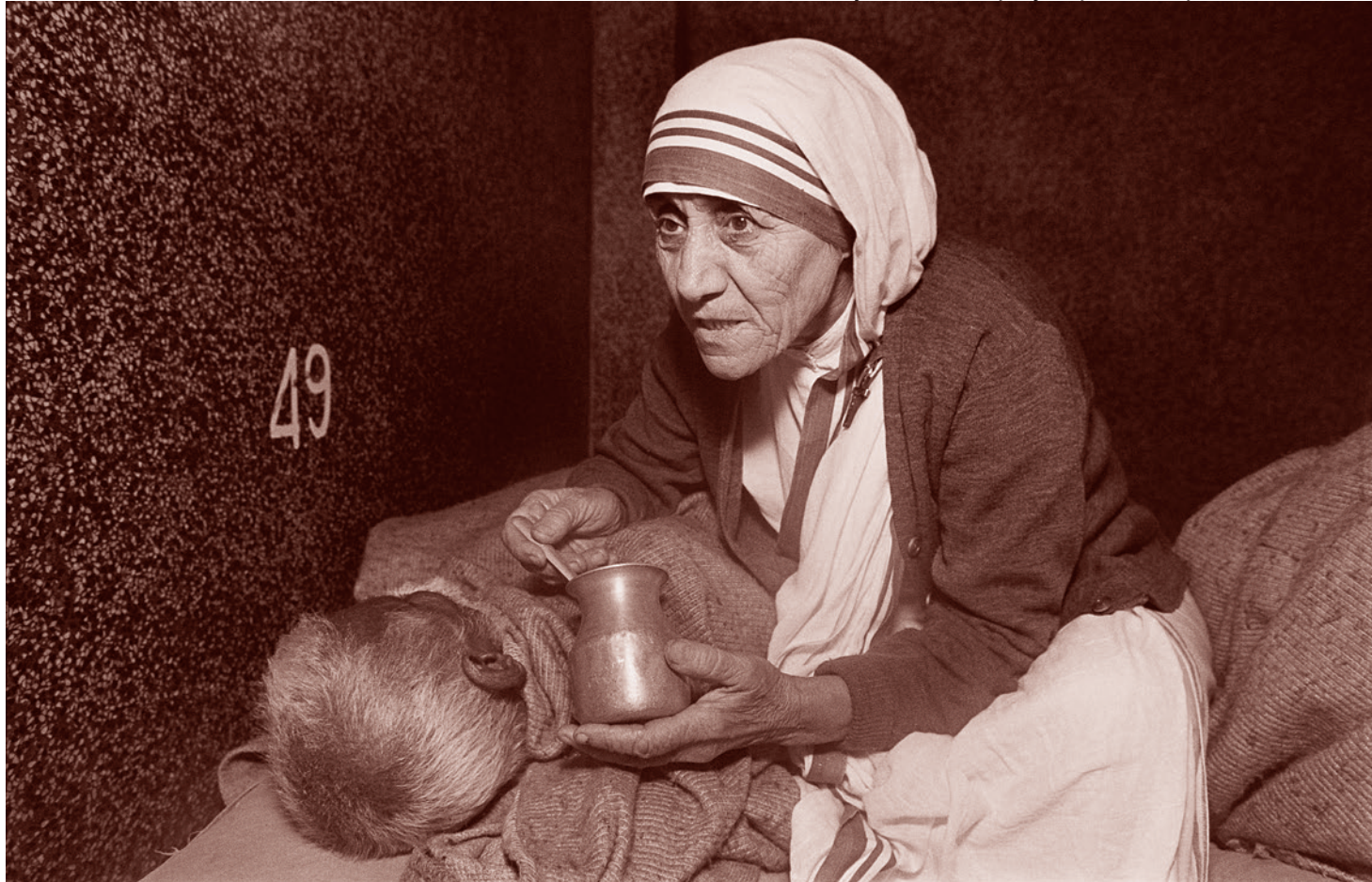
Мать Тереза в доме для умирающих в Калькутте, Индия. 1980 г.

В 1979 году Мать Тереза стала лауреатом Нобелевской премии мира.