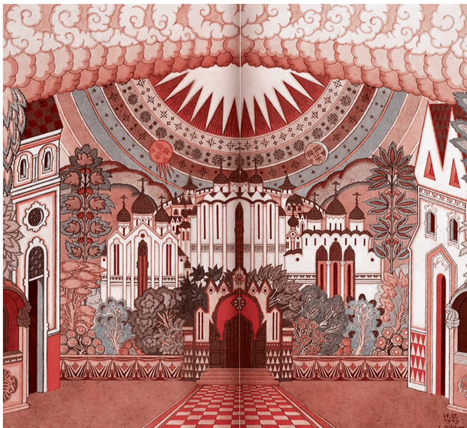
И.Я. Билибин «Преображённый Китеж» (фрагмент), эскиз к декорациям ко второй картине четвёртого действия оперы Н.А. Римского-Корсакова «Сказание о граде Китеже и деде Февронуши». 1929 г.

«Адвокаты, врачи, педагоги, журналисты и инженеры были недовольны своими профессиями. Казалось позором трудиться, чтобы зарабатывать копейки, когда открывалась возможность зарабатывать десятки тысяч рублей по»