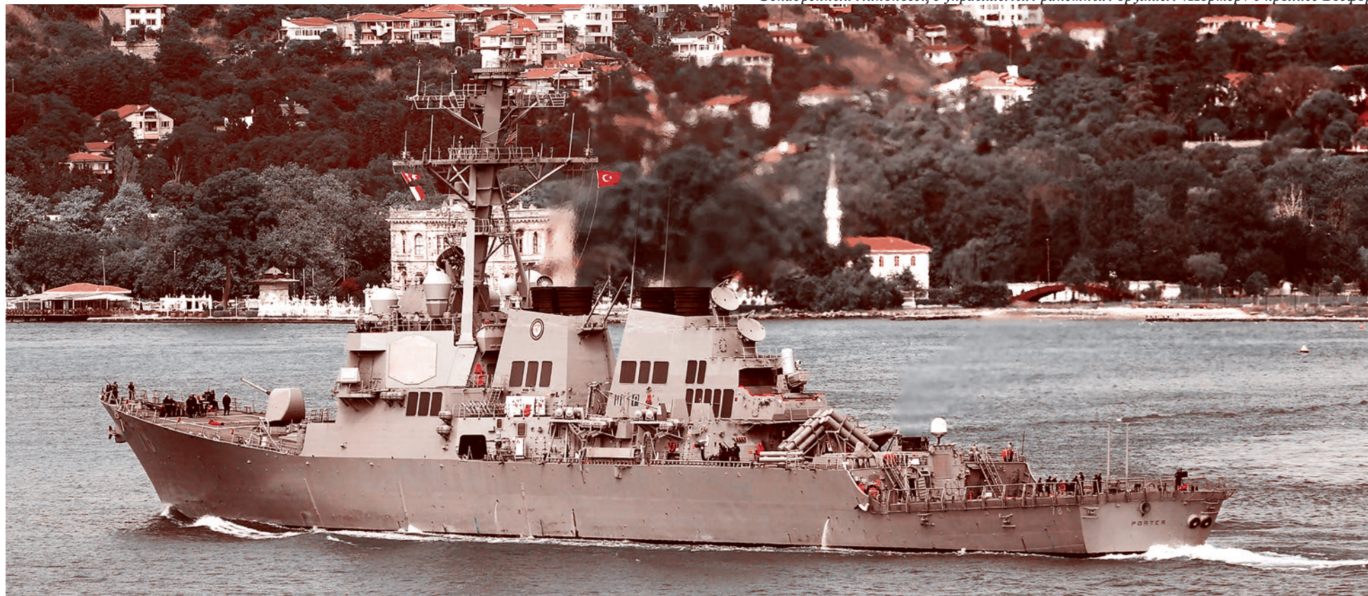
Эскадренный миноносец с управляемым ракетным оружием «Портер» в проливе Босфор

«Президентом Российской Федерации Путиным получено послание президента Турции Эрдогана, в котором турецкий лидер выразил свою заинтересованность в урегулировании ситуации, связанной с гибелью российского военного самолета», — сказал представитель Кремля. По его словам, «глава турецкого государства в послании выразил свое сочувствие и глубокие соболезнования родственникам погибшего российского пилота и сказал «извините».