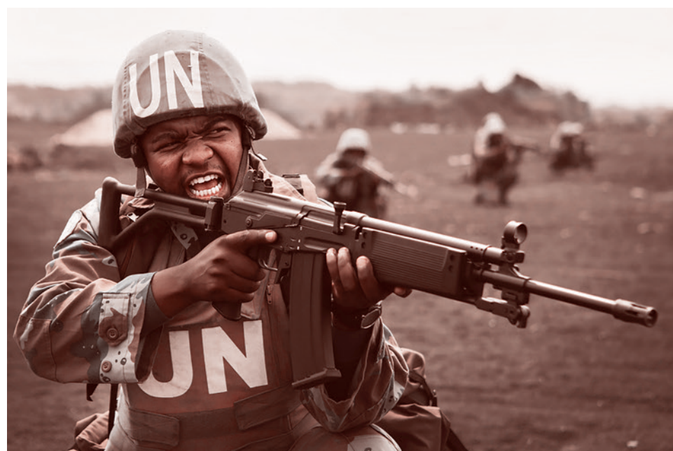
Южноафриканский солдат в интервенционной бригаде ООН в Демократической Республике Конго во время тренировки. 2013 г.

1.2. Очень важным фактором, создающим в современной Африке множество сложных военно-политических, социаль-