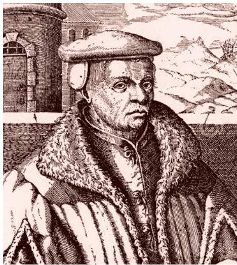
Портрет Томаса Мюнцера (фрагмент). XVI–XVII вв.

Можно ли, прочитав хотя бы то, что я только что процитировал, ответить на этот вопрос «да, всегда»? Извините, Энгельс прямо говорит о том, что Великая крестьянская революция в Германии, являясь чуть ли не главным слагаемым немецкой революционной традиции, вос-