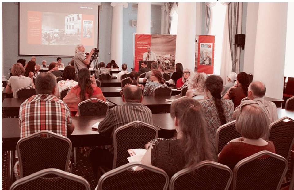
Общественно-педагогическая конференция в Севастополе «Пути возрождения классического отечественного образования». 8 июня 2016 г.