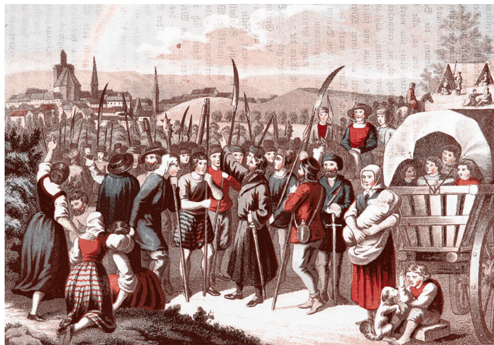
Томас Мюнцер — крестьянский пророк. Иллюстрация из книги Франца Люболяцкого «Последние три столетия в Германии», 1858 г.

Передо мной книга, написанная одним из классиков марксизма-ленинизма, другом и соратником Карла Маркса Фридрихом Энгельсом. Энгельс — это даже не Лафарг. Это фактически второе «я» Карла Маркса. И, хотя это второе «я», конечно, вторично по отношению к самому Марксу, хотя Энгельс, развивая марксизм, многое в нем переиначил на свой лад и многое исказил, не будучи, как Маркс, гениальным философом, всё же вряд ли кто-то осмелится сказать, что ключевые труды Энгельса не представляют собой классический, канонический марксизм.