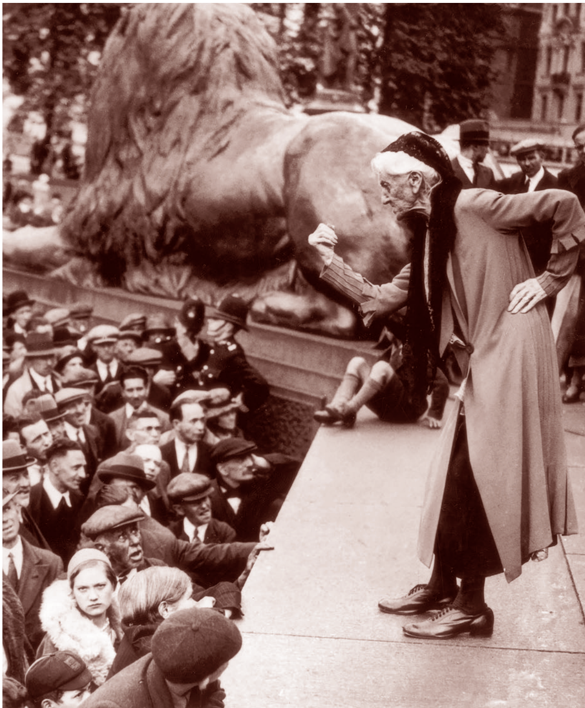
Суфражистка Шарлотта Деспард на митинге коммунистов на Трафальгарской площади в Лондоне. 11 июня 1933 г.

Согласитесь, сильные образы. Класс как общесоциальный разум и общесоциальное сердце, а не как средоточие шкурных интересов... Но продолжим цитирование.