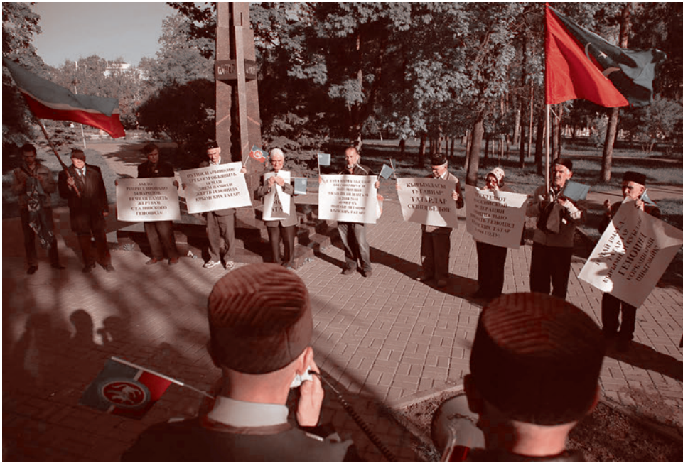
Митинг в Казани, посвященный 72-й годовщине депортации татар из Крыма. 18 мая 2016 г.

Очередная годовщина депортации крымских татар, посещение Турции П. Порошенко вместе с лидерами Меджлиса (организации, запрещенной в РФ), возвращение преступницы Н. Савченко в Киев — стали очередными поводами для разыгрывания киевской хунтой, ее сторонниками и западными покровителями информационно-пропагандистской кампании на «крымско-татарскую тему».