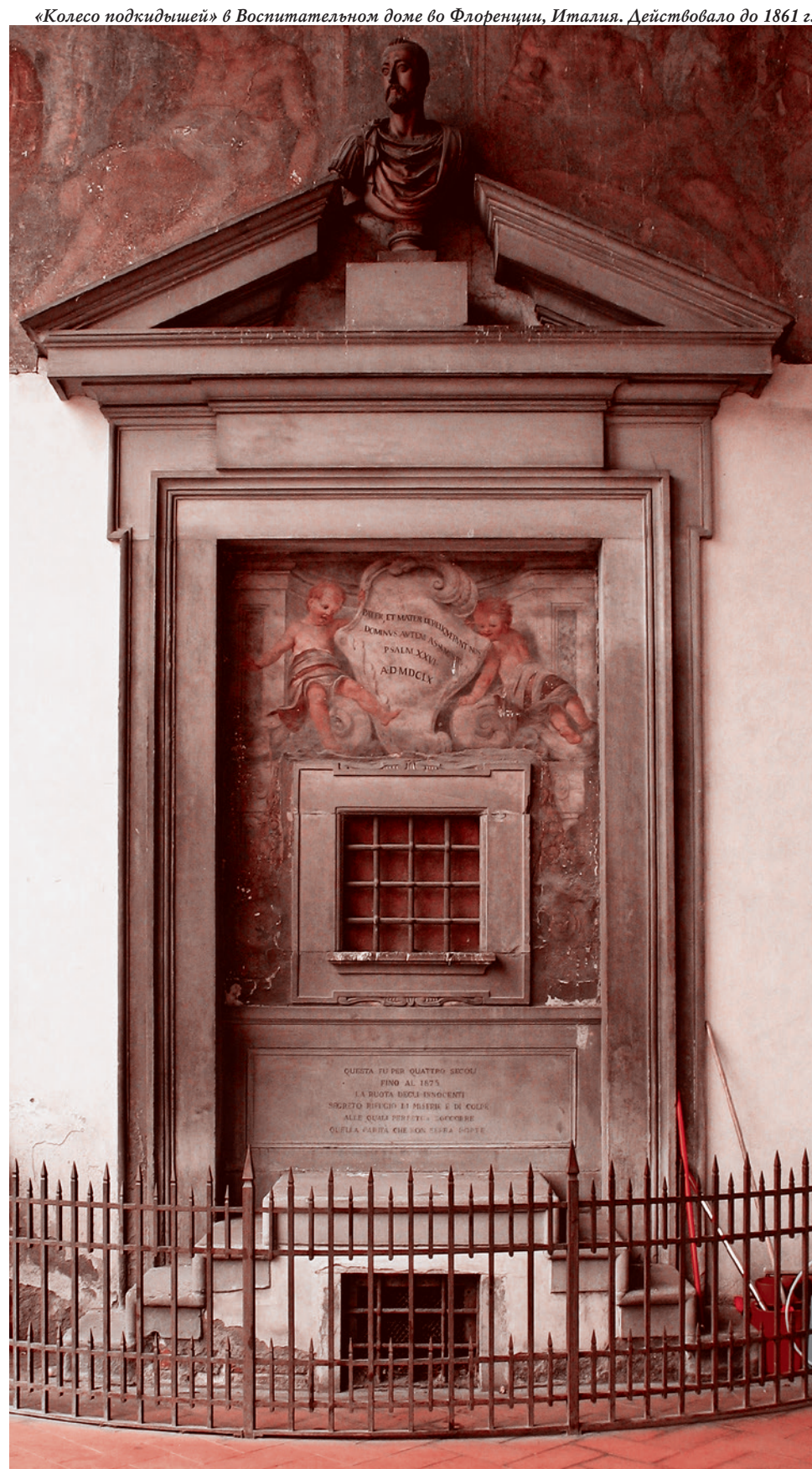
«Колесо подкидышей» в Воспитательном доме во Флоренции, Италия. Действовало до 1861 г.

Те матери, которые убивают своих новорожденных детей, выкидывают их на помойку, закапывают в лесу или засовывают в холодильник, — это сошедшие с ума женщины (из-за психических заболеваний, алкоголя, наркотиков) и женщины, впавшие в состояние аффекта в результате острой послеродовой депрессии. Эту проблему беби-боксами никак не решить, нужна профилактика, раннее выявление психических заболеваний, реальная государственная политика против распространения наркотиков.