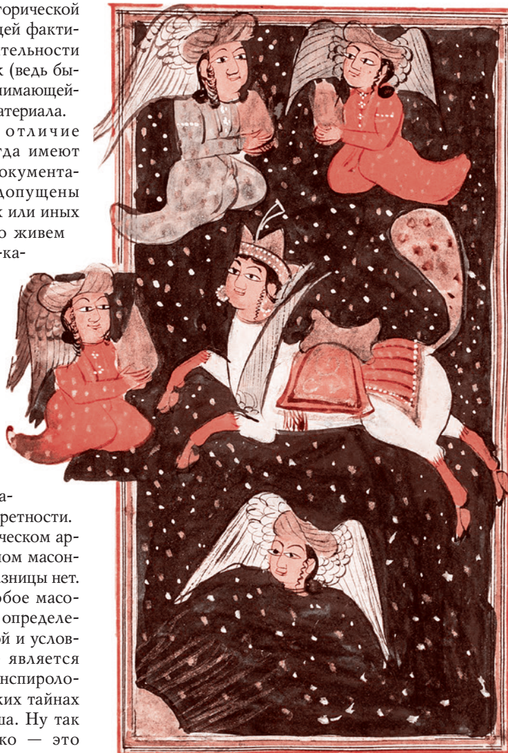
Иллюстрация из поэтического сборника Хафиза Ширази «Диван». Персия, 1825 г.

Шотландский устав — это отдельная история, требующая подробного изложения. Если ограничиться очень краткими сведениями, то речь идет об уставе организации, в которую входили в том числе и представители королевского дома Стюартов. Стюарты — это шотландская династия, знакомая по злосчастной Марии Стюарт и правившая в Великобритании как в преддверии Английской буржуазной революции, так и после недолгой реставрации, порожденной поддержкой, которую оказал одному из Стюартов, Карлу II, революционный диктатор Оливер Кромвель. Потом шотландский род Стюартов был выброшен из страны в связи с воцарением другого рода, так называемой Ганноверской династии, которую сторонники