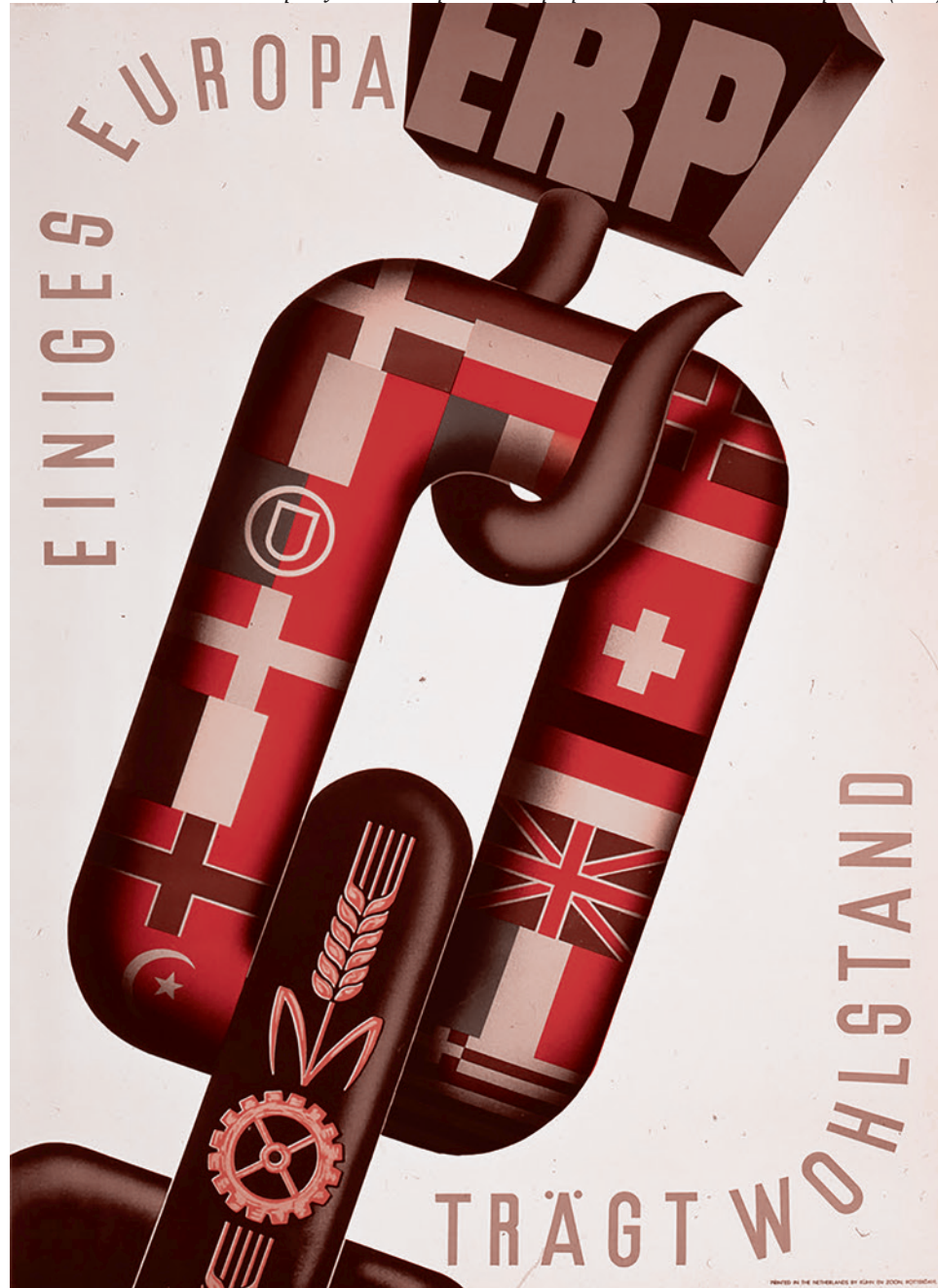
Плакат в поддержку Плана Маршалла «Программа восстановления Европы» (ERP)

Помимо этого, в Германии до сих пор сохраняются — и в некоторых случаях наращиваются — крупные пакеты американского капитала и во многих ключевых германских корпорациях, и в германских банках и инвестиционных группах. Что, конечно же, оказывает очень большое влияние на «пределы самостоятельности» экономической политики Германии. Отметим, что и политику «социального государства», и свой послевоенный технологический рынок Германия реализовала вопреки «рыноч-