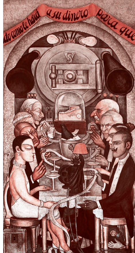
Диего Ривера. Банкет на Уолл-стрит. 1928 г.

А потом Бродский переходит к совсем близкой для нас тематике первородства: