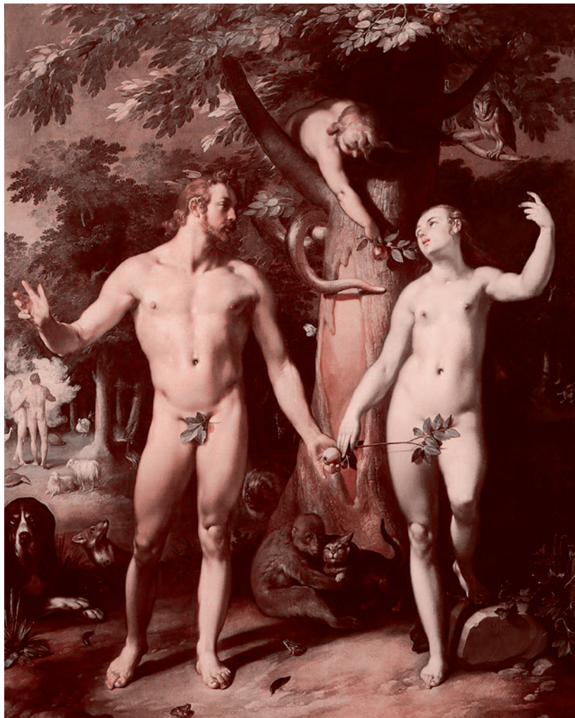
Корнелис Корнелиссен. Грехопадение. 1592 г.

Я уже сформулировал выше свою гипотезу, согласно которой оккультный нацизм Германа Вирта (то есть Аненербе, то есть Черного ордена СС) ориентирован именно на такой принцип. И что этот нацизм готов заключать магические соглашения (коль он оккультный, то других соглашений в принципе быть не может) и с семитами, и с кем угодно еще. Что воз-