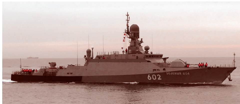
Малый ракетный корабль (МРК) «Зеленый дол» проекта «Буян-М»