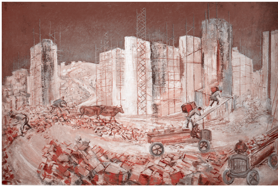
Павел Кузнецов. Строительство в Армении. 1931 г.

Никоим образом не навязываясь «начальством» и «фотографический» реализм, свидетельством чему может служить предпочтение А. Луначарским документалистскому характеру живописи художников АХРРА (Ассоциация художников революционной России) творчества мастеров «Четырех искусств» и лично Кузнецова, к каталогам персональных выставок которого нарком дважды писал восхищенные и проникновенные вступительные статьи.