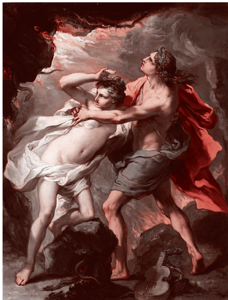
Гаэтано Гандольфи. Орфей и Эвридика. 1717 г.

что бог смерти Танатос унес его любимую жену Эвридику в подземное царство Аида, в страну, «откуда ни один не возвращался».