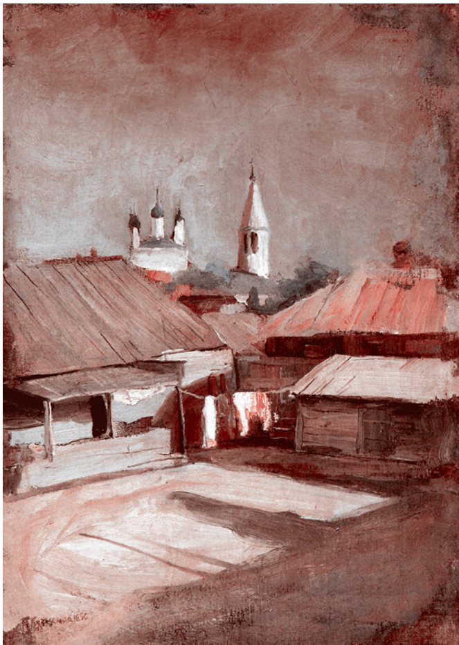
Павел Кузнецов. Дворик в Саратове. 1896 г.