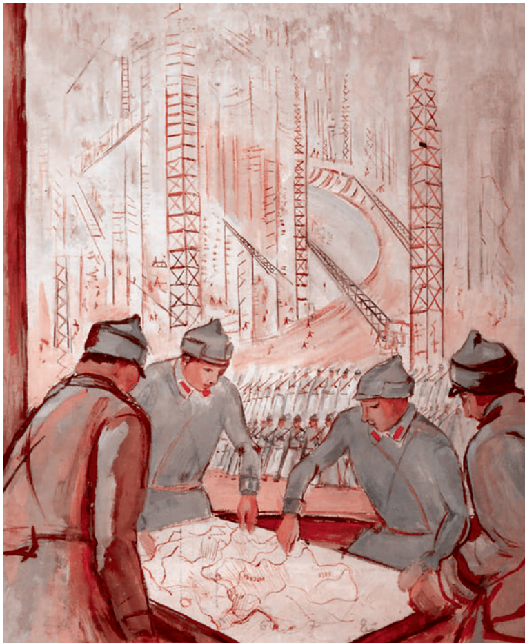
Павел Кузнецов. На страже социалистической Родины. 1930-е