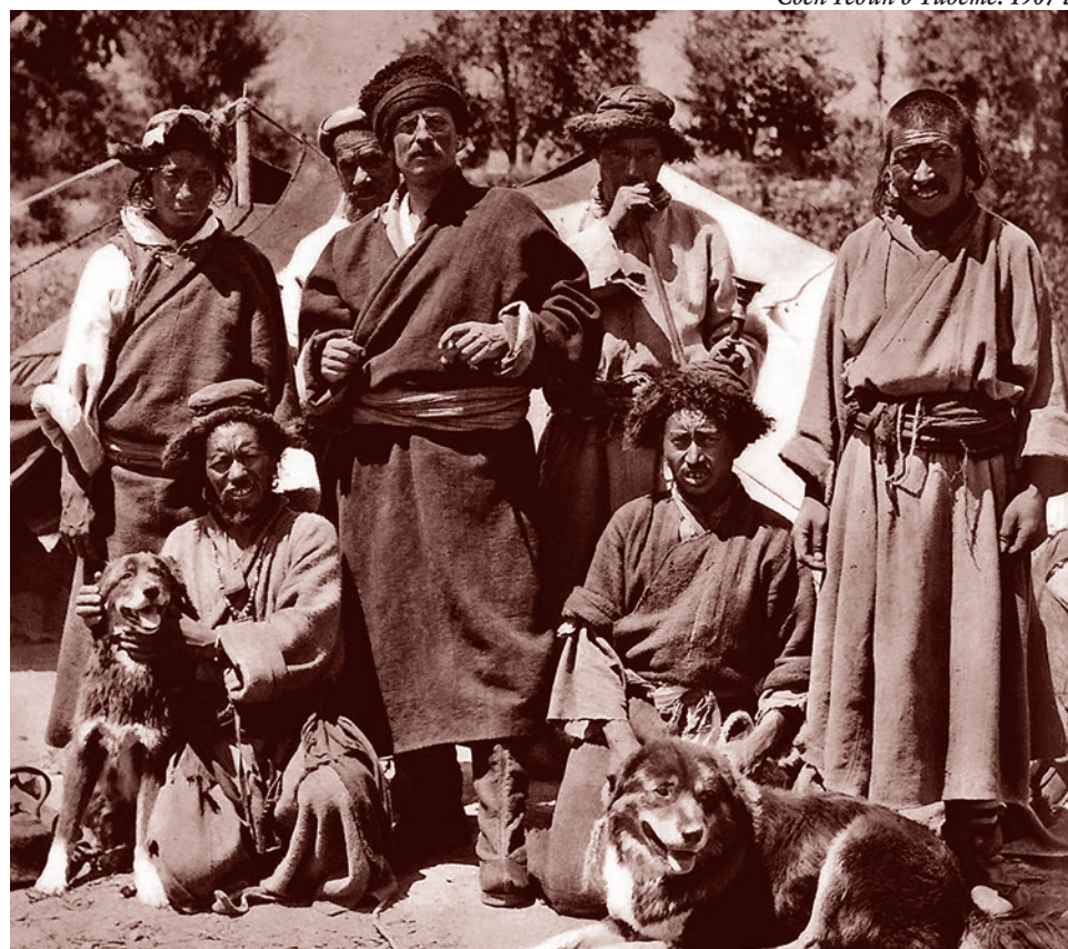
Свен Гедин в Тибете. 1907 г.