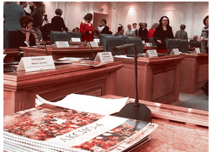
Парламентские слушания 17 марта 2015 г.

ший орган вынужден был ходатайствовать перед судом о подтверждении необходимости разлучения родителя с ребенком.