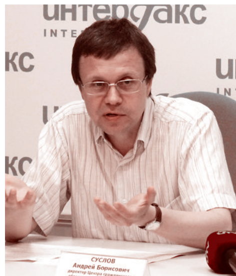
А. Б. Сулов

Прибегает пермская методичка и к прямой лжи. Так, в контексте темы «вселенского масштаба репрессий» утверждается о «сознательном допущении массовой смертности от голода 1932–1933 гг. (погибли более 6 млн человек)»... О фантастической цифре «6 миллионов» профессор истории В. Земсков, добросовестно исследовавший архивы, писал: «Приводятся абсурдные цифры — от 6 до 10 млн погибших; среди них — от 3 до 7 млн на Украине. Однако благодаря демографической статистике мы знаем, что в 1932 году на Украине