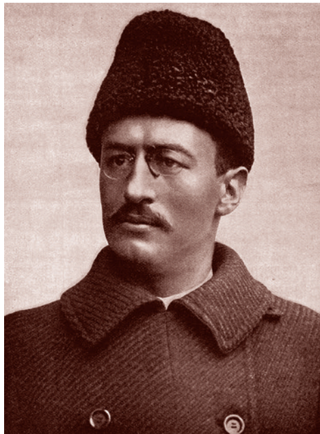
Свен Гедин. 1897 г.

«Я храню глубокую и нерушимую память об Адольфе Гитлере и считаю его одним из величайших людей в мировой истории. Теперь он мертв. Но его дело будет жить. Он сделал Германию мировой державой. Теперь эта Германия стоит на краю пропасти, поскольку ее противники не смогли вынести ее растущей силы и мощи. Но 80-миллионный народ, который в течение шести лет стоял