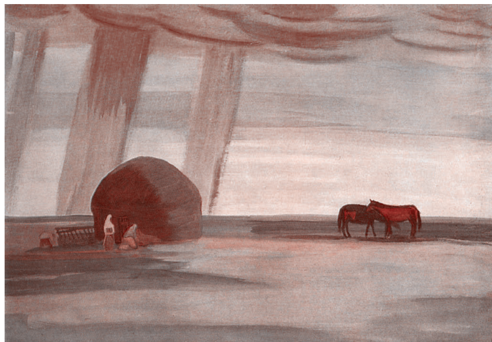
Павел Кузнецов. Дождь в степи. 1912 г.

Важными для его становления были и впечатления от творчества недолго преподававшего в училище И. Левитана, и приобщение к «живительному воздуху» Абрамцева (при содействии С. Мамонтова Кузнецов совершил поездку на Русский Север). В ранних работах Кузнецов проявил себя как сверхчуткий преемник жажды