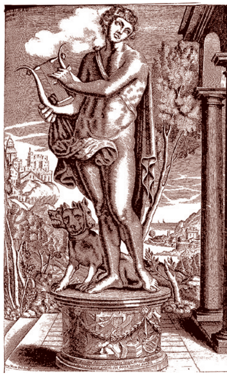
Афанасий Кирхер. Орфей настраивает лиру. XVII век

Как мы уже убедились, Прометей в той древнегреческой трагедии, авторство которой кто-то приписывает Эсхи-