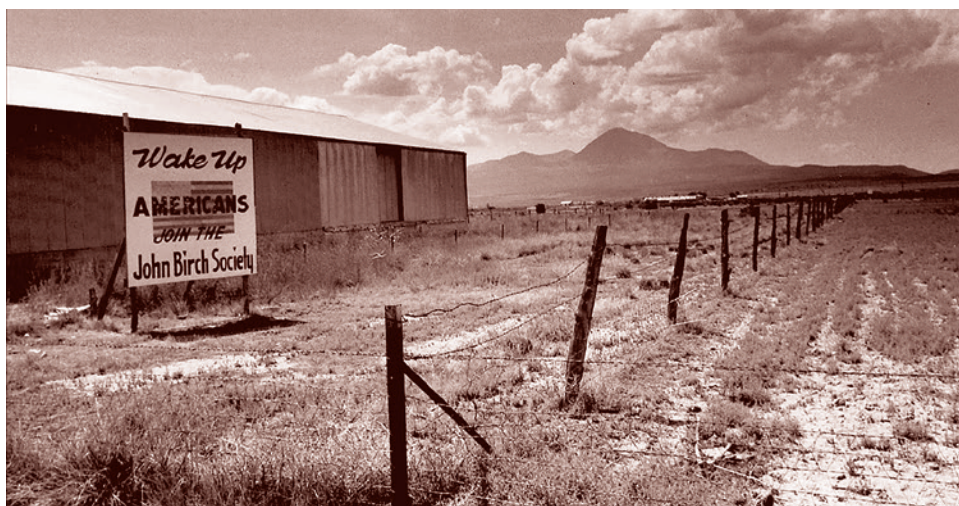
Плакат с призывом американцам вступить в «Общество Джона Берча»

рез год, в то время как его американский визави быстро развалился из-за «сопротивления изоляционистов», точно так же, как годом раньше распалась американская Лига свободных наций.