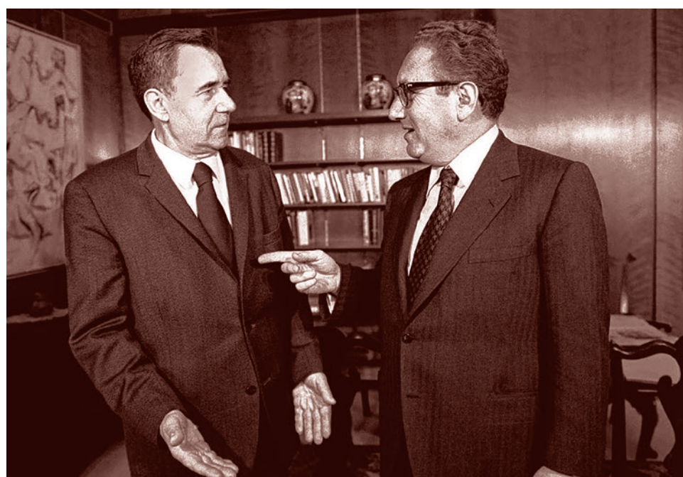
Госсекретарь США Генри Киссинджер (слева) и министр иностранных дел СССР Андрей Громыко в Вашингтоне. 4 февраля 1974 г.

Десятилетие, предшествовавшее избранию Рейгана, было непросто для СМО. Война во Вьетнаме, расколовшая американское общество, вызвала аналогичный раскол и в Совете. Поводом для конфликта стало назначение Д. Рокфеллером горячего сторонника вьетнамской войны Уильяма Банди редактором журнала СМО — «Форин Аффэрс» — вместо ушедшего в отставку Г. Армстронга. Часть членов СМО выступила резко против этого назначения. Дело приняло настолько серьезный оборот, что Рокфеллеру пришлось вмешиваться лично. Питер Гроуз в упомянутой книге «Исследование продолжается» сообщает, что этот «бунт» был жестко подавлен, упорствующих «диссидентов» лишили членства в СМО. Этот провал в деле урегулирования национальных межэлитных интересов (в том числе повлекший за собой расширение «демократизации» в управлении СМО), помимо прочего, стал одной из причин снижения влияния Совета в 80-е годы XX века.