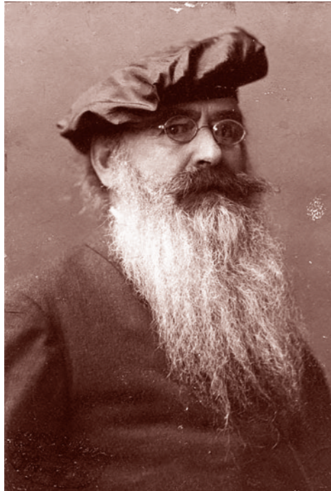
Гвидо фон Лист. 1913 г.

Кроме Люэгера, у Шенерера был еще один столь же талантливый ученик, с которым у учителя тоже были сложные отношения, — Карл Герман Вольф (1862–1941). Не тот обергруппенфюрер СС Карл Фридрих Отто Вольф, который вел от лица Гимmlера переговоры с Даллесом и знаком многим читателям по фильму «Семнадцать мгновений весны», а тезка этого Вольфа, австрийский политический деятель, отстаивавший в конце XIX — начале XX века крайний немецкий национализм. Этот Вольф входил в партию Шенерера, руководил наиболее радикальным крылом этой достаточно радикальной партии.