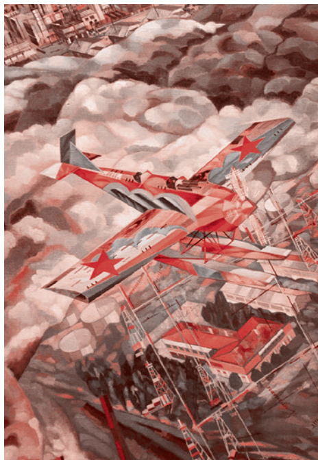
В.Кутцов. Дирижабль (фрагмент). 1933 г.

Конечно, досталось при этом и отдельным составляющим «советского мифа»: «от образов вождя до отношения к телу, от столичной архитектурной среды до среднеазиатской экзотики, от образов массовых праздников до портретов героев, от поэтизации труда и армейской службы