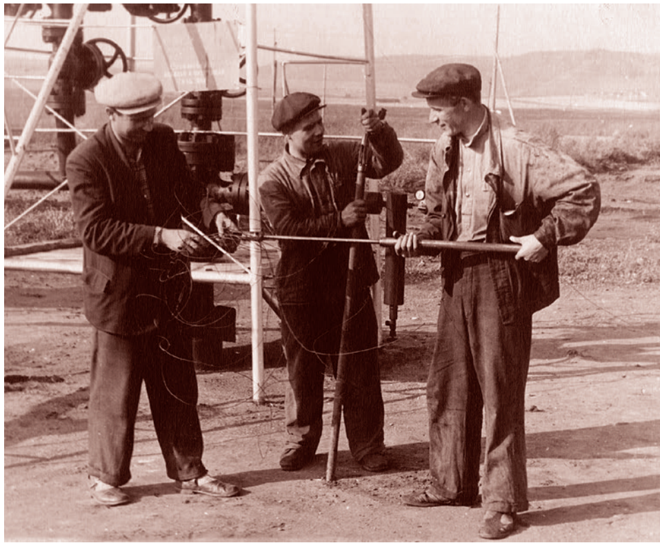
Исследование фонтанной скважины, ТАССР. 1950-е

Рынок пока не реагирует на новости о недофинансированности будущей добычи нефти на сотни и сотни миллиардов долларов (я уверен, что не за горами тот день, когда в оценках зазвучит слово «триллион») и, как следствие, о рекордном падении числа действующих буровых установок. Например, 19 февраля 2016 года Financial Times сообщила, что число работающих буровых установок в США снизилось до минимального уровня с 2009 года. В этот же день цена на нефть марки Brent снизилась на 0,42% до $33,12 за баррель. А ведь нынешний мировой рынок живет ожиданиями, отыгрывая в ценах будущие события задолго до того, как они должны произойти.