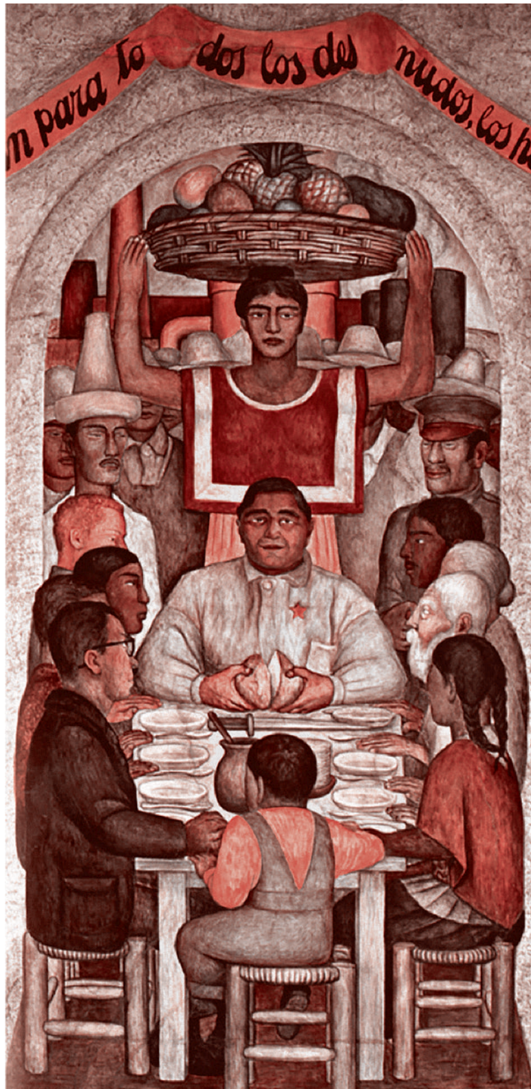
Диего Рибера. Наш хлеб. 1928 г.

У Рима, согласно этой концепции, эстафетную палочку перехватывают Католическая Церковь и сам институт папства, который осуществляет уже идеологическую экспансию в Европу. Параллели между Римской империей и Католической Церковью Чемберлен проводит таким образом: если Римская империя держалась за определенный каркас гражданственности и государственности, в каком-то смысле преемственный республике (хоть и утративший, по мнению Чемберлена, свое истинное содержание), то Римская Католическая Церковь перенесла этот каркас из плоскости государственной в плоскость религиозную и идеологическую.