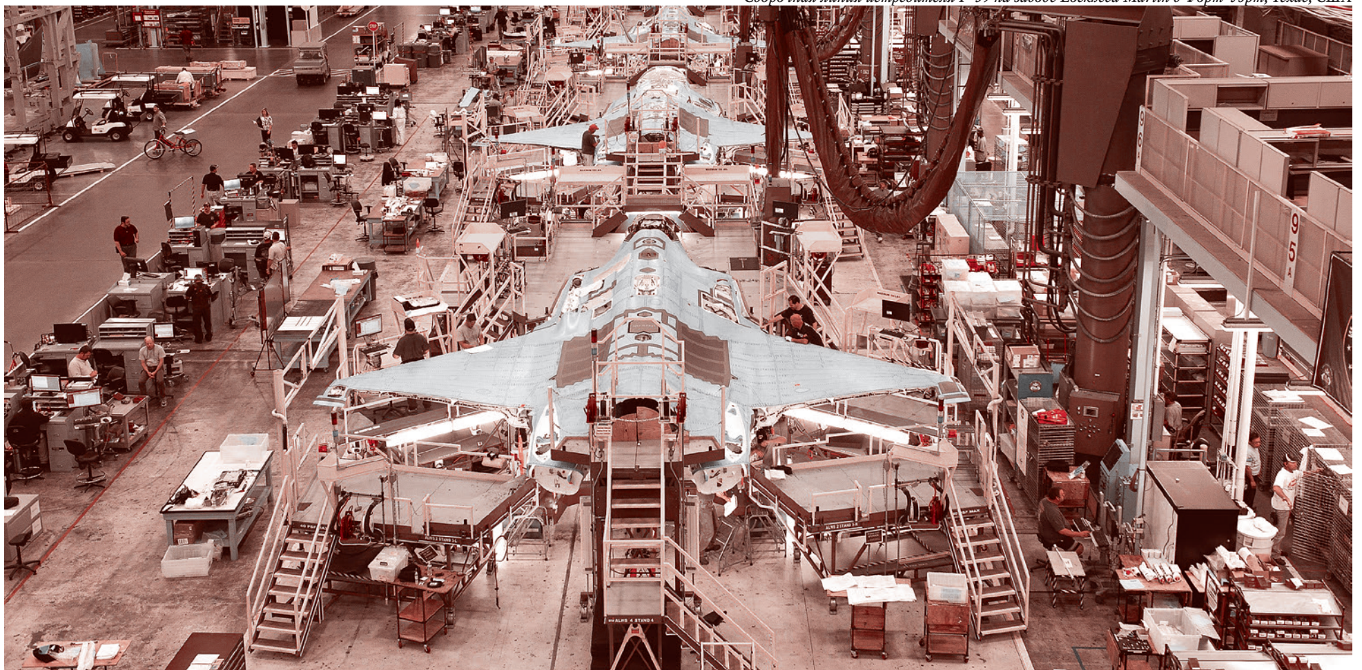
Сборочная линия истребителя F-35 на заводе Lockheed Martin в Форт-Уэрт, Техас, США