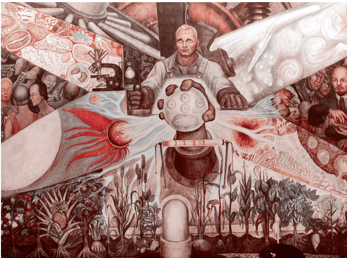
Диего Ривера. Человек на распутье (фрагмент). 1934 г.

личилась. Мало проповедовать христианские ценности, важно ставить человека в условия, при которых он сможет эти ценности впитывать и осознавать их важность. В условиях капитализма это сделать намного сложнее, чем при социалистическом устройстве общества. Если тенденция замены ценностей продолжится, то рассчитывать на серьезную помощь православия в формировании морально-нравственного облика человека не придется.