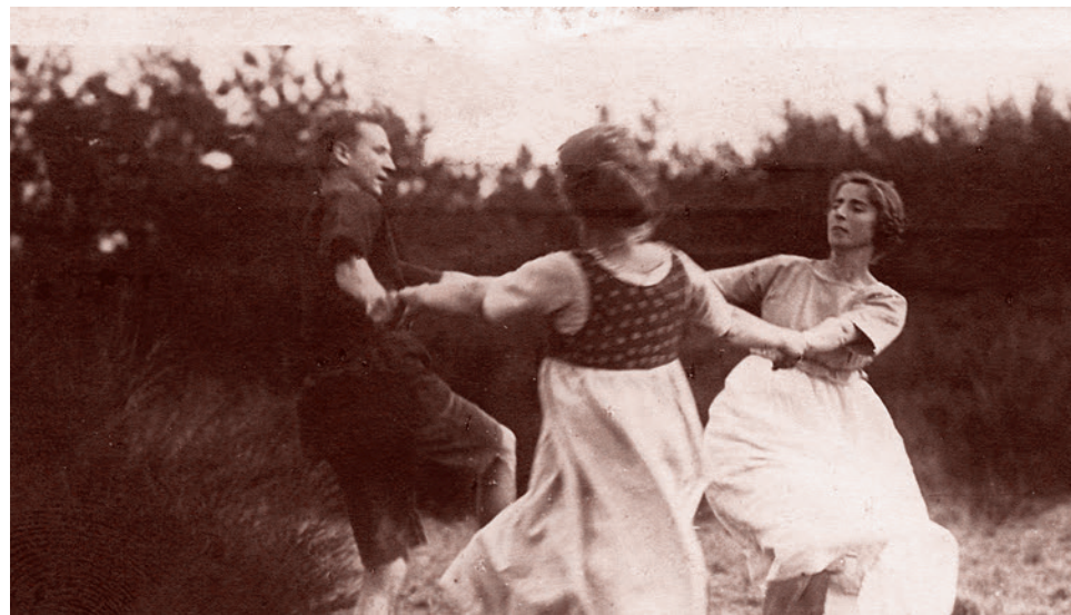
Странники танцуют. Немецкая почтовая открытка. 1925 г.

Что касается европейского социализма, этого шестого принципа штрассерианства, заменившего гитлеризм, то тут всё понятно. Этноплюралистическая Европа Розенберга, Геббельса, Штрассера и других должна стать усовершенствованным