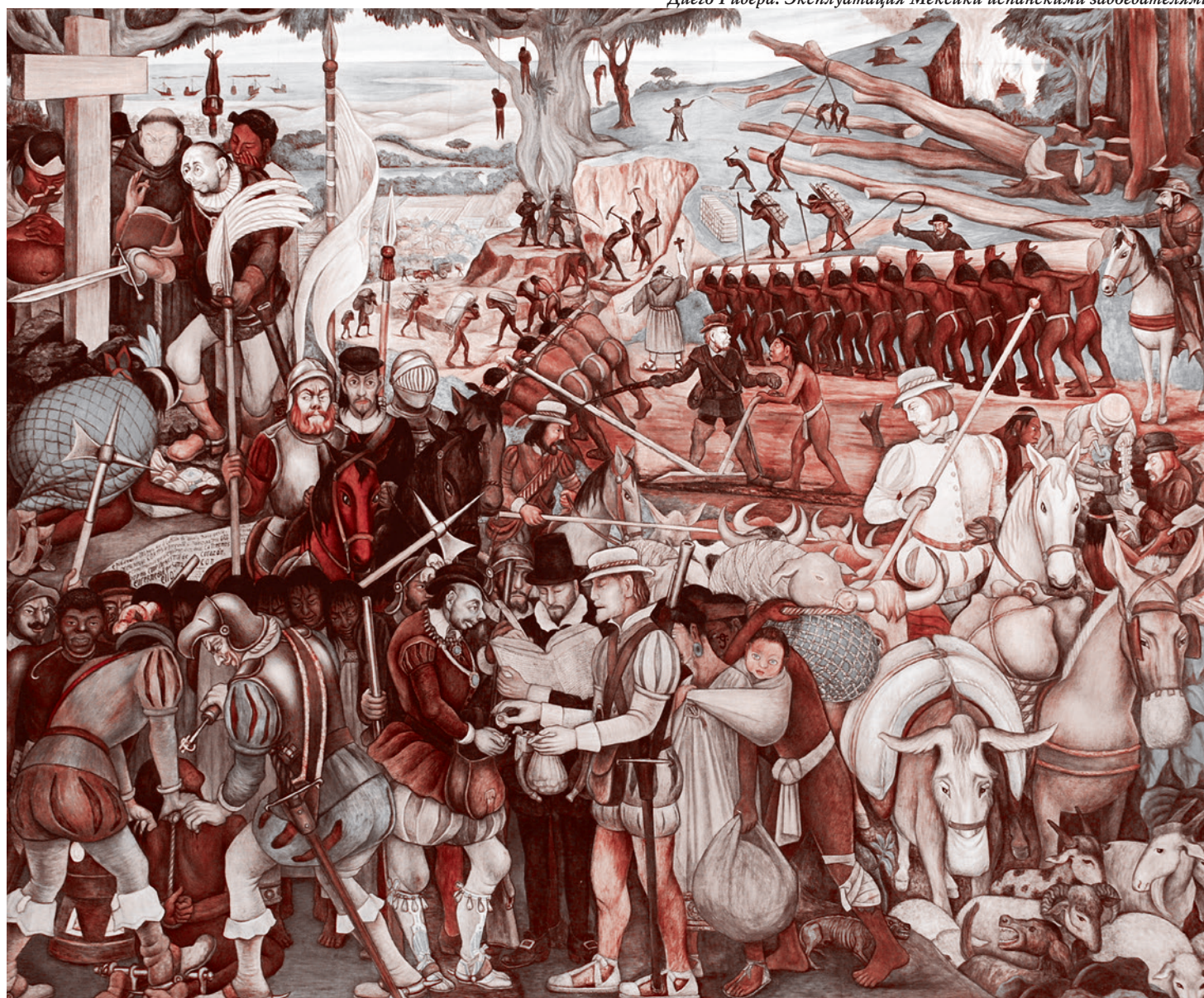
Диего Ривера. Эксплуатация Мексики испанскими завоевателями

Безусловно, публикуя столь обширный политический текст, Розенберг не может не делать выводов, ведущих (как мы уже знаем из истории) к практической реализации: