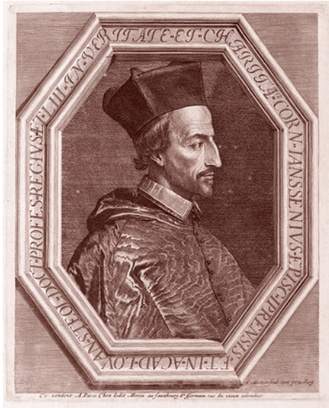
Морин Жан. Портрет Корнелиуса Янсена

Такова старая история. Она вновь всплыла на поверхность в связи с янсенизмом, который стал яростно отстаивать строгое августинианство, упрекая тех, кто такое августинианство не принимает, в том, что они сторонники пелагианской ереси. Казалось бы, история должна повториться. Августинианцы вообще и строгие в особенности должны были быть обласканы папой, а пелагианцы — осуждены. Но не тут-то было! На этот раз на янсенизм ополчились иезуиты. С их подачи