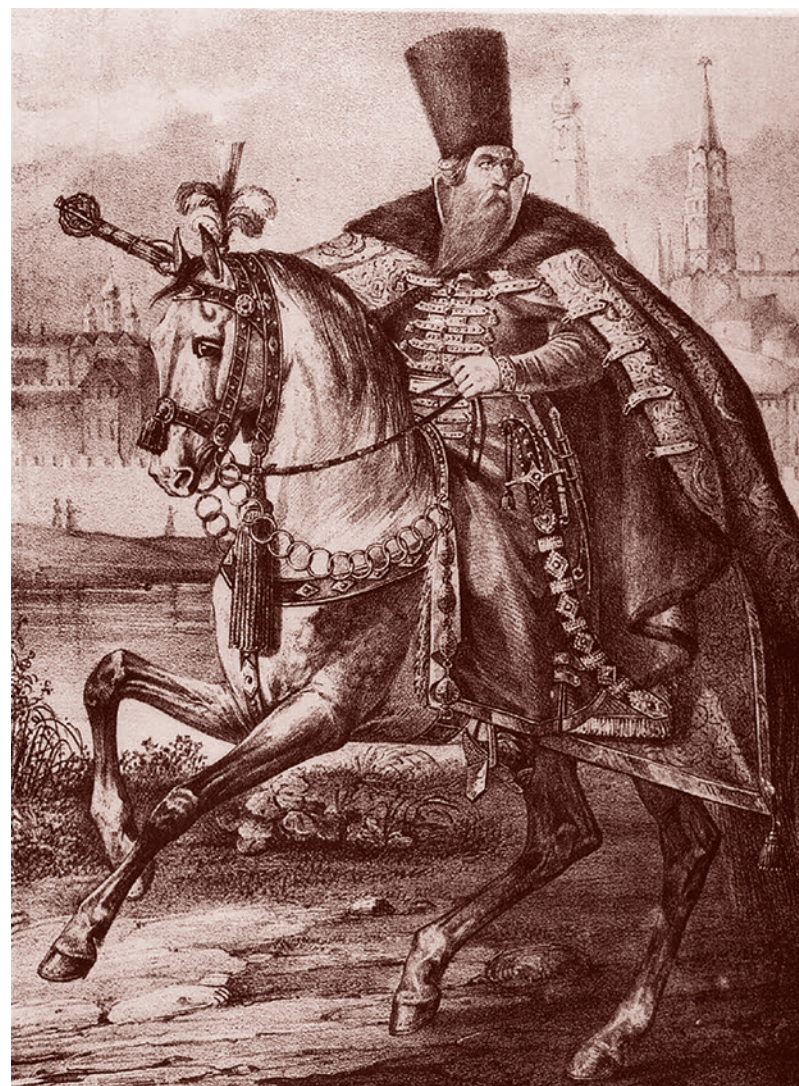
БОЯРИНЪ. въ XVI и XVII столѣтїяхъ, (Видъ изображаетъ часть Кремля со стороны за Москворѣчь).

Несмотря на реформы и переход к полкам нового строя, к концу XVII в. стало очевидным отставание русского войска от армий европейских держав. Особенно отчетливо это показало поражение под Нарвой. Пожалуй, главной причиной отставания армии являлось несоответствие системы ее комплектации и обеспечения новым условиям. Даже после перехода к полкам нового строя вооруженные силы, по сути, носили ополченческий характер. В мирное время большая часть армии распускалась, что не могло не сказаться на дисциплине и выучке войск. Обеспечение военных осуществлялось из двух основных источников — с выделенного им во временное пользование участка земли и за счет жалования. Имело место противоречие между задачей управления хозяйством и необходимостью нести военную службу.