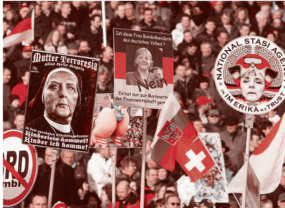
Митинг сторонников организации «Европейцы-патриоты против исламизации Старого Света» (ПЕГИДА) в Дрездене.

«Да, я кандидат на президентских выборах 2017 года», — заявила Ле Пен в эфире телеканала TF1 и добавила, что политическая жизнь Франции нуждается «в людях, которые верят в свои убеждения».