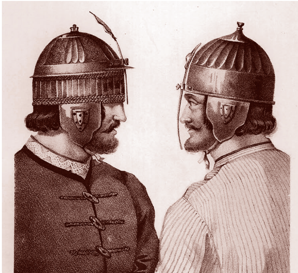
Русское вооружение с XIV до второй половины XVII столетия, ШЕЛОМЫ.

Младшая дружина представляла собой вооруженный отряд воинов-профессионалов, укомплектованный потомками приближенных лиц князя. Все члены младшей дружины состояли на полном обеспечении князя и постоянно проживали на княжеском дворе в гридницах. Внутри младшей дружины была своя иерархия, основанная