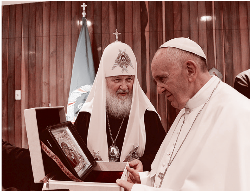
Историческая встреча Патриарха и Папы Римского 12 февраля 2016 года

В совместном заявлении Патриарх Московский и всея Руси Кирилл и Папа Римский Франциск выступили в защиту христиан, притесняемых в разных странах. «Призываем мировое сообщество сплотиться, чтобы покончить с наси-