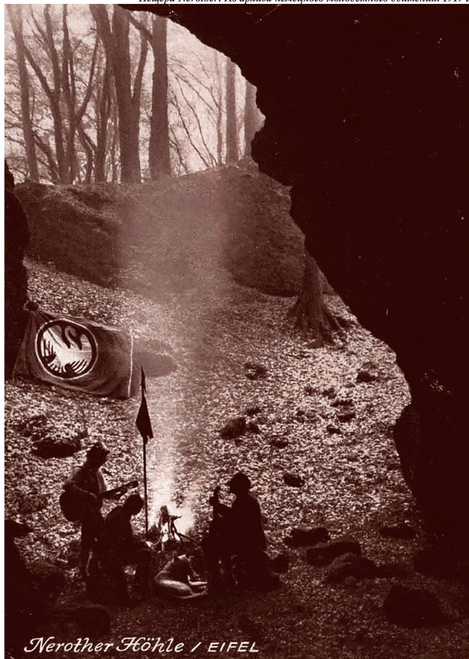
Пещера Nerother. 1919 г.