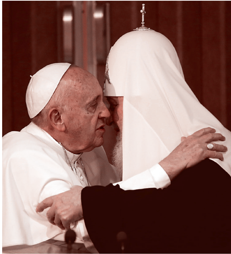
Историческая встреча Патриарха и Папы Римского 12 февраля 2016 года

Встреча представителей Русской Православной и Католической Церквей — событие экстраординарное уже по одному тому, что произошло впервые со времени Великого раскола (1054 г.). За прошедшее тысячелетие взаимное неприятие двух ветвей христианства, в основании которого — серьезные догматические противоречия, не раз порождало, кроме религиозных, и политические конфликты.