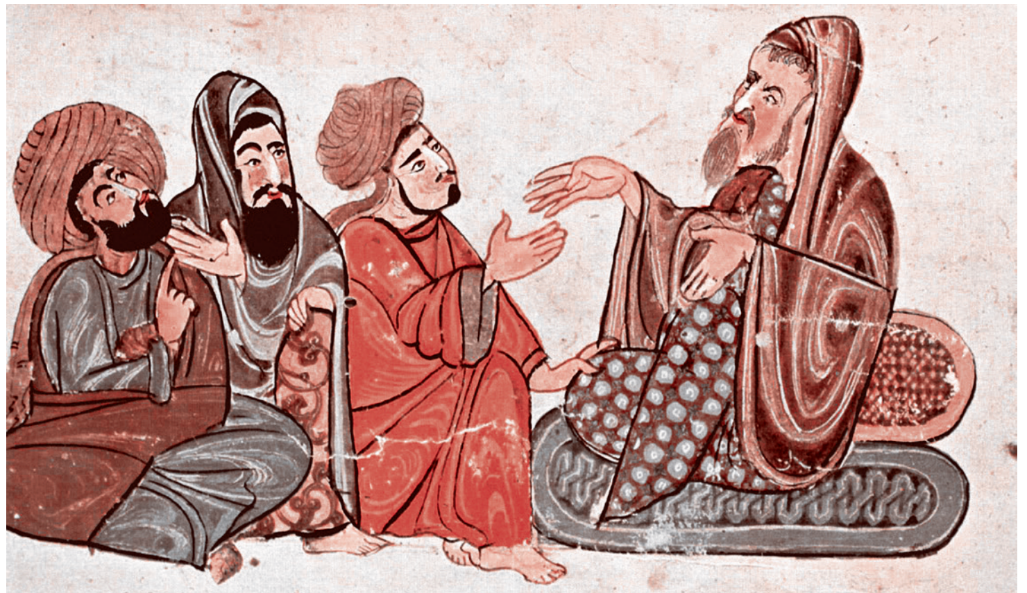
Солон с учениками. Из средневековой рукописи

Не было бы никакого прометеизма, никаких новых постантинских волн интереса к фигуре великого Прометея, если бы Эсхил не написал своих трагедий. То, что мы обратились поначалу к Софоклу, который являлся младшим современником Эсхила, и, в отличие от него, обсуждал Прометея лишь в связи с главными героями своих трагедий, оправдано постольку, поскольку статуя Прометея оказывается в некоей особой точке под названием Колон.