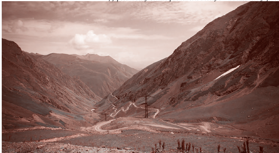
Дорога к селу Омало расположенному в Панкисском ущелье

Реакцией официального Киева стал приказ силовикам разработать «схемы взаимодействия» с активистами «Блокады Крыма». В результате было проведено совместное совещание между руководством Азово-Черноморского регионального управления Погранслужбы Украины и руководителями Крымско-татарского меджлиса, в результате чего достигнута принципиальная договоренность о допуске «активистов-патриотов» на пункты пограничных переходов.