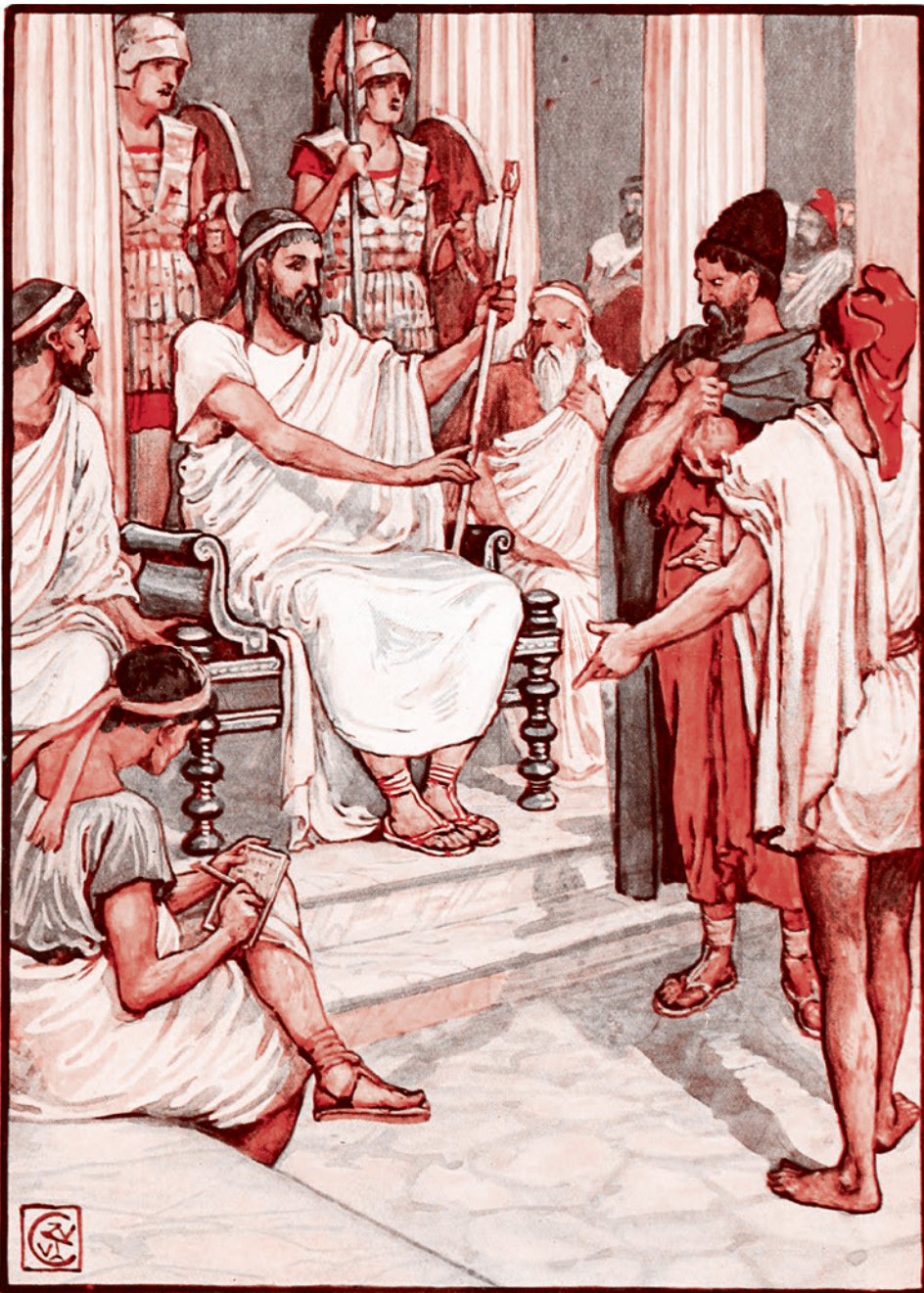
Уолтер Крейн. Солон, мудрый законодатель Афин — илл. к «Истории Древней Греции» XIX века

жен Афинам в качестве национального героя, потому что у конкурирующих с афинянами дорийцев таким героем был Геракл. И возвеличить себя Афины могли, только приподняв Тесея.