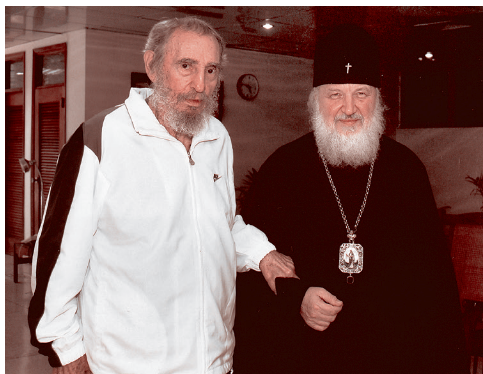
Встреча Патриарха и Фиделя Кастро 14 февраля 2016 года

Настоящая встреча готовилась фактически без огласки, и только за неделю до события возникли сообщения о предстоящем диалоге и о его связи с нарастающей угрозой мировой войны. Чрезвычайность и напряженность ситуации в мире была обозначена в Рождественском обращении Папы Франциска, где он предупредил паству, что настоящее Рождество может оказаться последним.