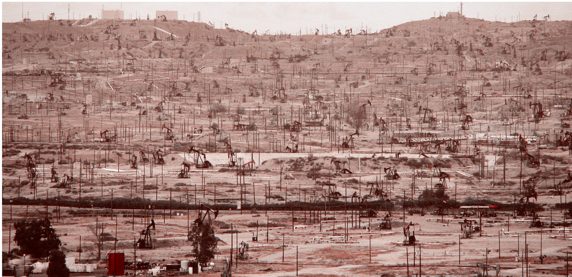
Керн-Ривер, Калифорния, США