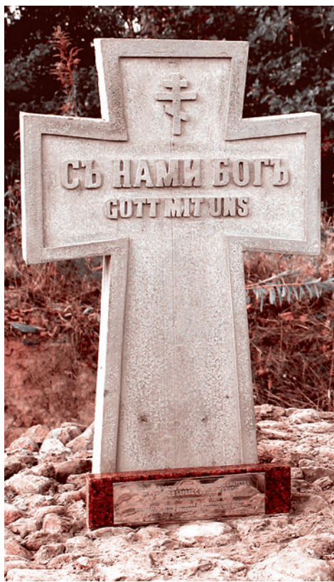
Памятник в честь русско-немецкого братства по оружию в борьбе с большевиками в поселке Ярославское, Калининградская область