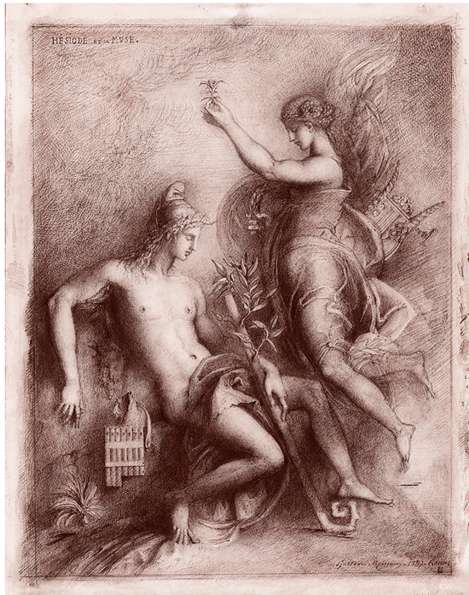
Густав Моро. Гесиод и Муза. 1857 г.

Резюмируя, Гесиод восклицает, как мне почему-то представляется, с несколько искусственным благоговением по отношению к Зевсу: