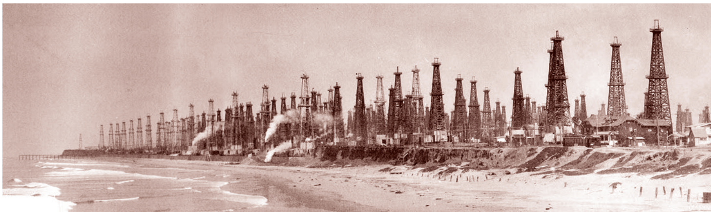
Хантингтон-Бич, Калифорния, США. 1926 г.

Итак, на исходе 2015 г. мы выяснили, что при обрушении цен на сырье до 35–40 долл./барр. финансовые возможности продолжать и наращивать добычу нефти оказались почти полностью исчерпаны как у большинства американских «сланцевых» компаний, так и у добытчиков нефти из канадских «нефтяных песков».