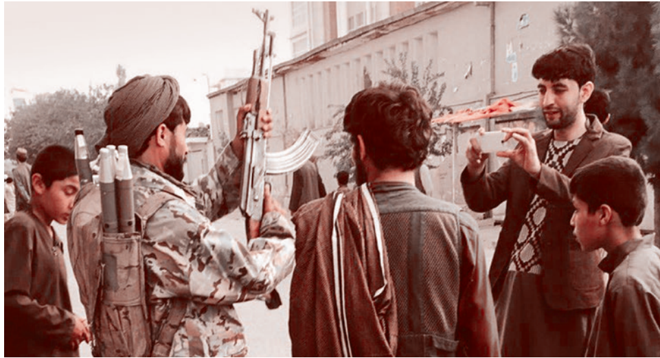
Боец движения «Талибан» позирует на главной площади Кундуза. Сентябрь 2015 г.

Появление той давней статьи обозначило начало новой мироустроительной эпохи — большой «арабской весны». Теперь The Daily Beast выступает с новым ярким материалом, который называется A Taliban-