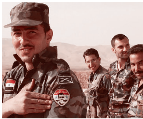
Военнослужащие сирийской правительственной армии

Так что, если сирийская армия победит, она выйдет из текущей войны как самая безжалостная, испытанная и закаленная в боях арабская армия на всем Ближнем Востоке. И горе тем ее соседям, которые об этом забывают!