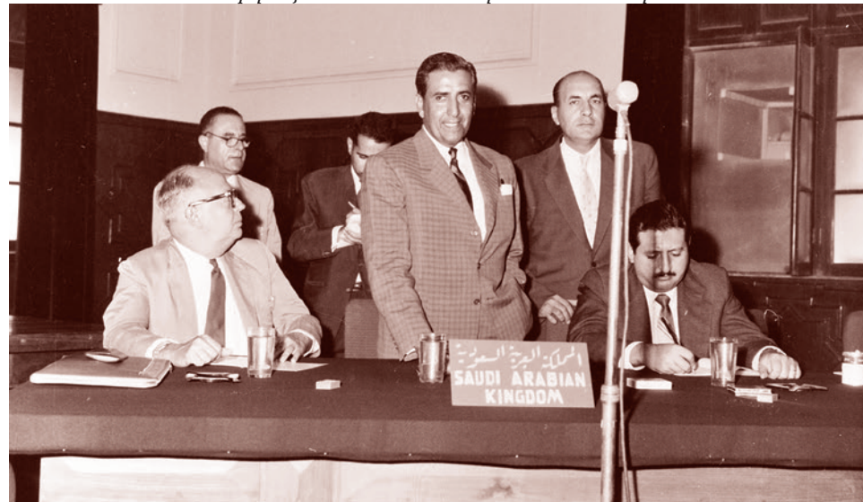
Конференция в Багдаде в сентябре 1960 г. на которой была основана ОПЕК