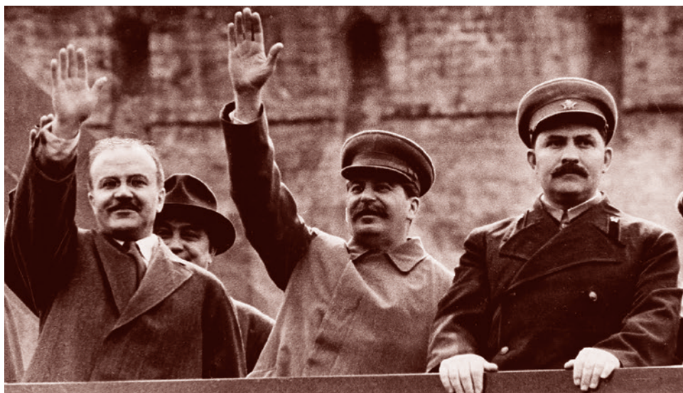
Молотов, Сталин, Каганович

Юрий Жуков отмечает, что, проводя реабилитацию в отношении сотрудников МГБ, Берия руководствовался не столько принципом справедливости, сколько принципом политической целесообразности: реабилитация и восстановление в звании получали те, кого Берия хорошо знал по совместной работе, то есть те, на кого Берия мог полностью положиться. При этом в тюрьме оставался, например, бывший министр госбезопасности Абакумов. Берия также отправил в тюрьму в марте 1953 года