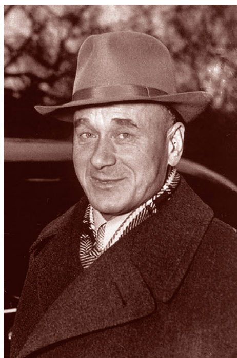
Иван Александрович Серов, 1956

Булганин, как отмечают все исследователи, был политически близок к Хрущеву, поэтому занял бы в заговоре такую же позицию, как и он. Позже и на Пленуме ЦК КПСС 2–7 июля, и в своих мемуарах Хрущев свидетельствовал, что привлекал Булганина к заговору против Берии якобы с самого момента смерти Сталина. Интересно, что Булганин на том же Пленуме подтвердил слова Хрущева о том, что он и Хрущев с момента смерти Сталина решили объединиться против Берии. При этом важно отметить, что никакими своими действиями Хрущев своей вражды к Берии за весь 1953 год не показывал (а по версии Юрия Жукова, даже сделал выбор в пользу него против Маленкова), поэтому слова Хрущева на Пленуме следует интерпретировать как попытку преувеличить свою истинную роль в заговоре. В своих мемуарах, записанных 70-х годах, Хрущев также изображает себя главным