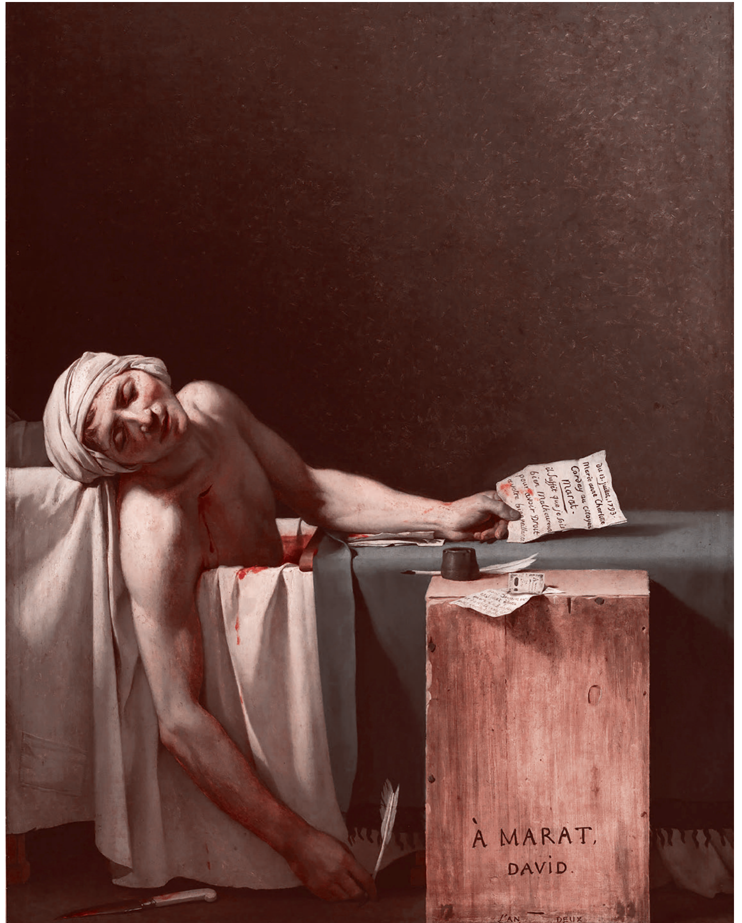
Жак Луи Давид. Смерть Марата. 1793 г.

Аргентинский кровавый «эксперимент» показал, что провести антинародные радикально-рыночные «реформы» в условиях активного сопротивления можно, только применяя механизм террора против собственного народа