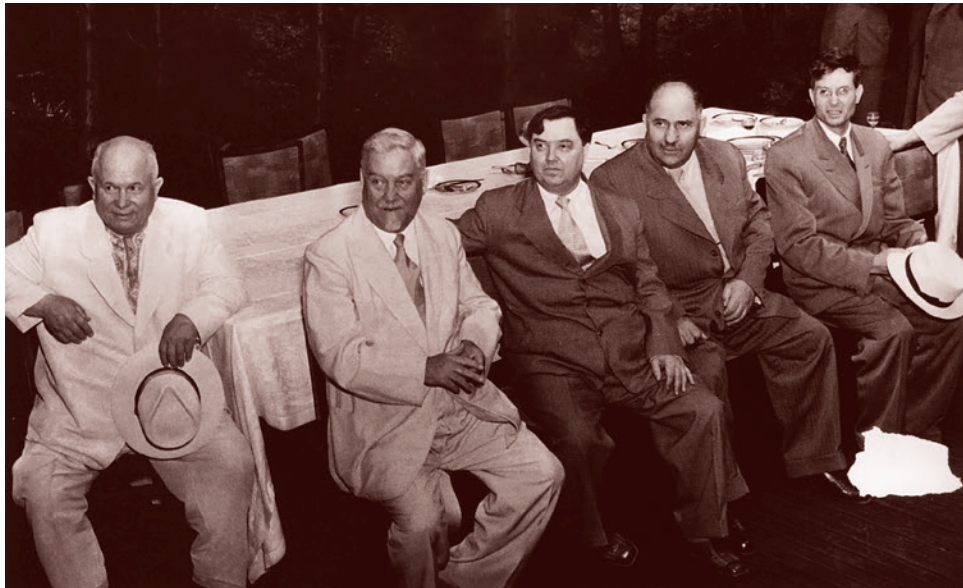
Никита Хрущев, Николай Булганин, Георгий Маленков, Лазарь Каганович, Михаил Сулов на подмосковной даче