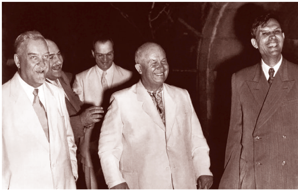
Николай Булганин, Лазарь Каганович, Михаил Пербухин, Никита Хрущев, Михаил Суслов

Еще одним из итогов Пленума стало возвращение Игнатъева в ЦК и де-факто снятие с него всех обвинений в участии в фальсификации политических дел. Это также выводило Маленкова из-под удара со стороны нового министра внутренних дел (и тех, кто мог с ним потенциально