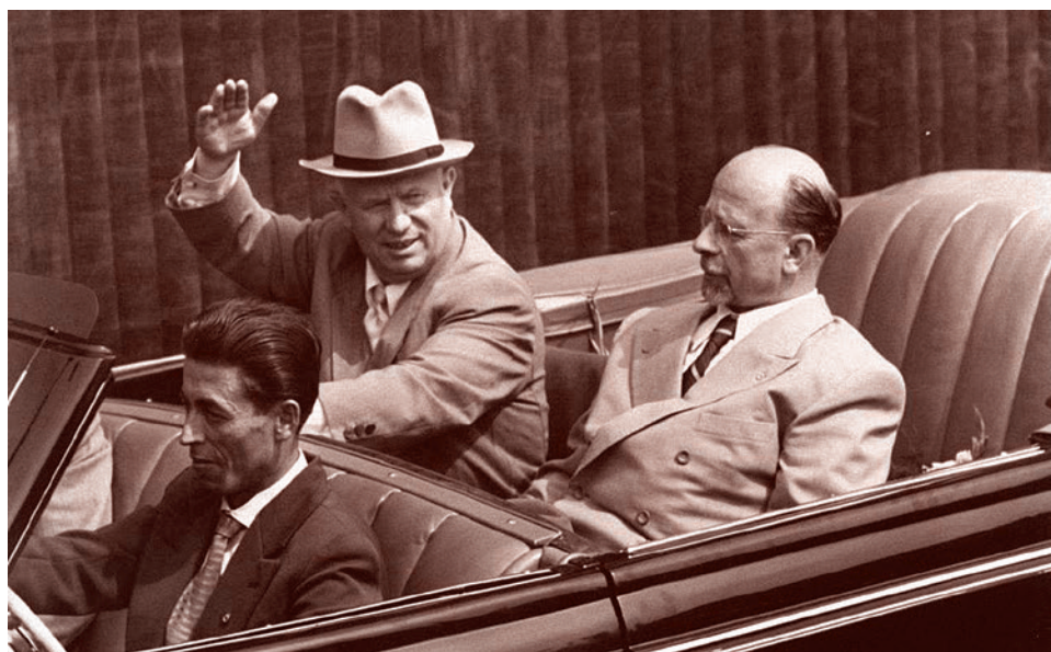
Никита Хрущев и Вальтер Ульбрихт

8 мая 1953 года Молотов направил на имя Маленкова и Хрущева записку, где резко критиковал выступление Ульбрихта несколькими днями ранее, в котором тот выдвигал тезис о ГДР как о государстве «диктатуры пролетариата».