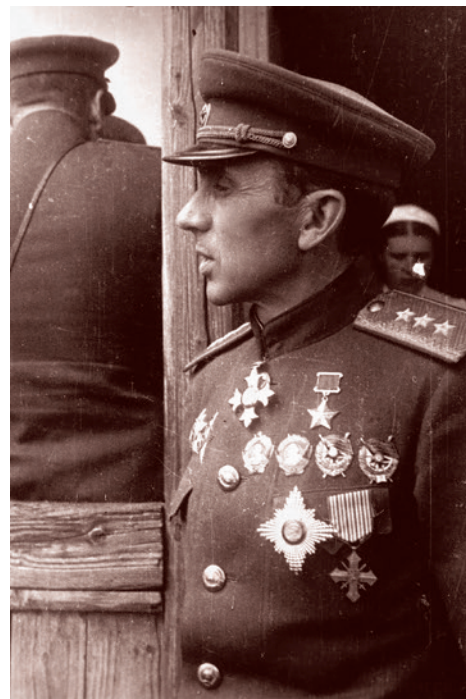
Кирилл Семенович Москаленко

Очень интересны воспоминания маршала Жукова о тех событиях. Необходимо отметить, что в самих мемуарах, которые вышли отдельной книгой при жизни Жукова, нет упоминания о его участии в аресте Берии. Мемуары посвящены в основном Великой Отечественной войне. Однако в других книгах, которые вышли пос-