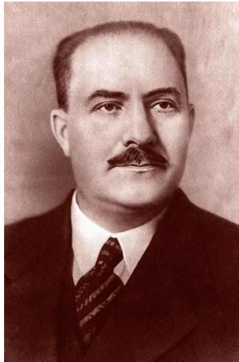
Лазарь Моисеевич Каганович

Министров и Президиуме ЦК, без которого любая инициатива о смещении Берии была бы не просто проиграна, но и обращена против самих же заговорщиков.