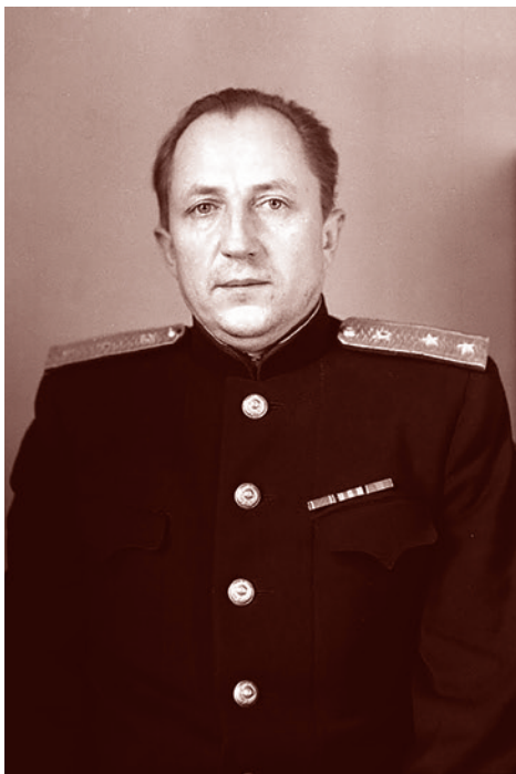
Роман Андреевич Руденко