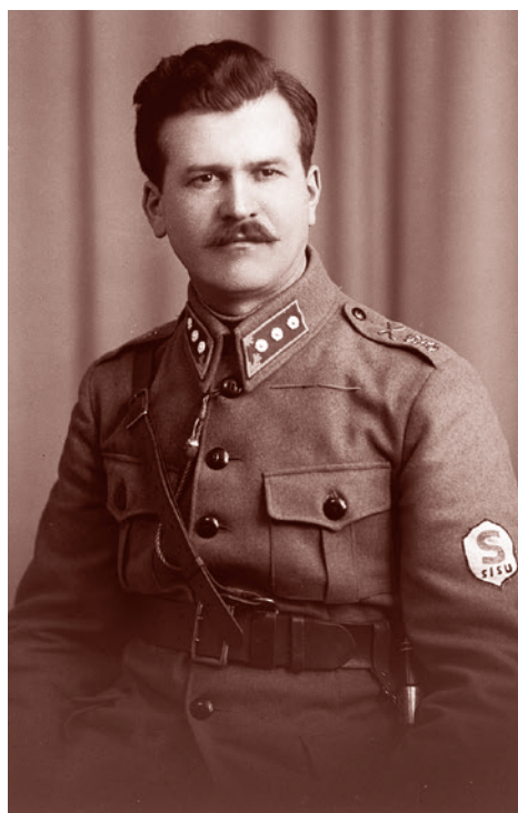
Имре Надь, 1942 год

Анализируя участие Берии во внешнеполитических решениях СССР, можно точно сказать, что, во-первых, Берия очень активно включился в обсуждение и решение соответствующих вопросов. Во-вторых, политика Берии в отношении стран «народной демократии» явно была направлена на послабление или даже смену прежнего политического и экономического курса в сторону либерализации в этих странах. Берия хотел пойти на объединение Германии на определенных условиях (внеблочный статус и компенсация СССР) для того, чтобы использовать объединенную Германию как буфер между СССР и США и, возможно, затем включить Германию в политическую орбиту СССР. Учитывая неоформленность новой внешней политики СССР после смерти Сталина, Берия, проявив инициативу, судя по документам, получал вначале явное одобрение Маленкова и Хрущева. Однако затем он встретил сопротивление со стороны Молотова, особенно по вопросу ГДР. Инициативы Берии в отношении Польши, Чехословакии, Венгрии и Совета Экономической Взаимопомощи, вероятно, только усилили расхождение позиций Молотова и Берии.