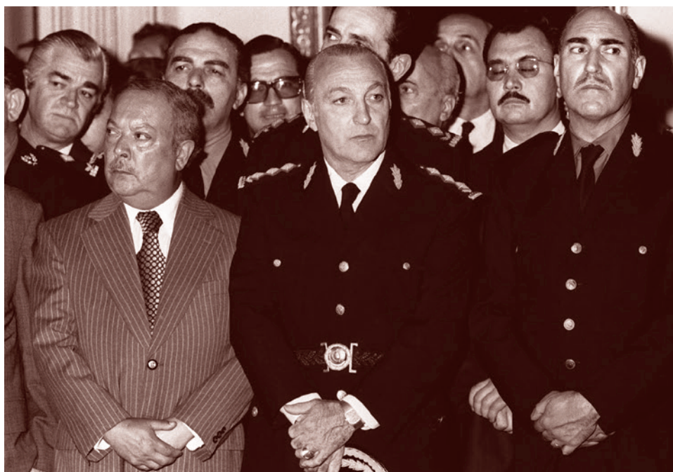
Леопольдо Элорса — лидер аргентинских «эскадронов смерти»

Из рассекреченных документов государственного департамента США следует, что хунта работала в плотной связке с представителями западного капитала.