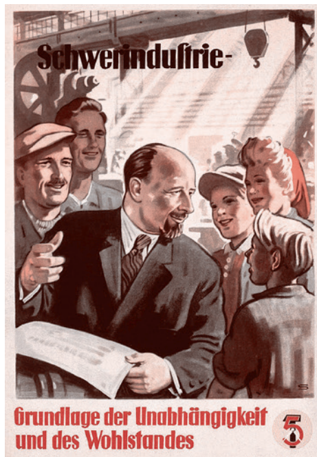
Grundlage der Unabhängigkeit und des Wohlstandes

Вопросом о будущем Германии наиболее активно занимались Берия и Молотов. Молотов к этому времени смог значительно усилить свои позиции в МИДе. Он ввел на должности своих замов и заведующих отделами наиболее лояльных к нему людей, например, Громыко, а также заменил послов в нескольких странах. Усиление позиций в МИДе, а также политического веса Молотова, одного из старейших членов Политбюро, явно означало, что он собирается претендовать на активное участие в политической жизни СССР.