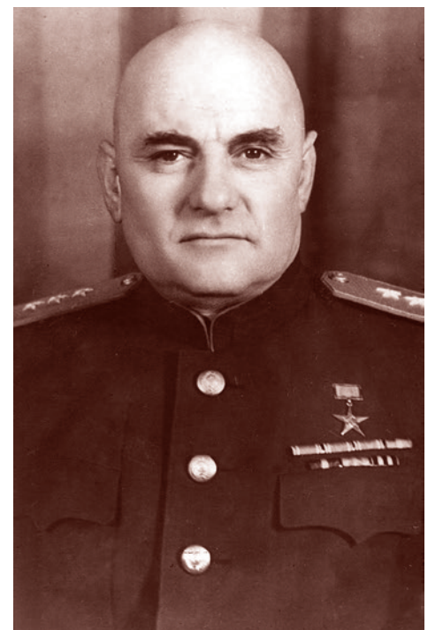
Борис Львович Ванников