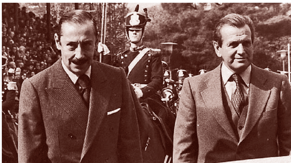
Хорхе Видела и Хорхе Соррегьета