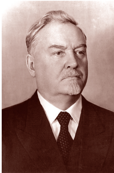
Николай Александрович Булганин