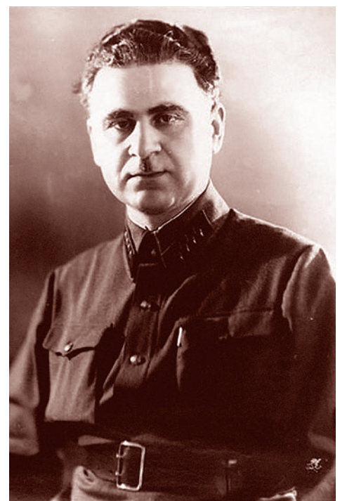
Сергей Арсеньевич Гоглидзе

В июне 1953 года выступление рабочих ГДР против политики Ульбрихта в Берлине переросло в политическую забастовку по всей стране. В Берлин вначале были отправлены люди Берии, а затем и он сам. Берия потребовал жесткого наведения порядка. Было введено чрезвычайное положение. В итоге во второй половине июня ситуация полностью нормализовалась. 26 июня, когда еще не было известно об аресте Берии, в Германии состоялся Пленум Социалистической единой партии Германии (СЕПГ), на котором упразднился пост генерального секретаря, который занимал Ульбрихт, и вводилось коллегиальное руководство, при этом недавний берлинский кризис объяснялся «справед-