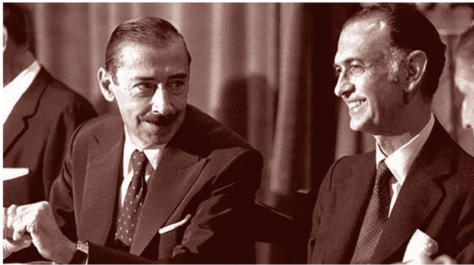
Хорхе Видела и Хосе Мартинес де Ос

Так, Хосе Мартинес де Ос, представлявший богатейшую землевладельческую семью в Аргентине, был личным другом Дэвида Рокфеллера и щедро финансировался «Чейз Манхэттен Бэнк». Фактически через эти группы осуществлялся контакт глобальных и компрадорских элит, при которой компрадорские элиты выполняли роль «служанки».