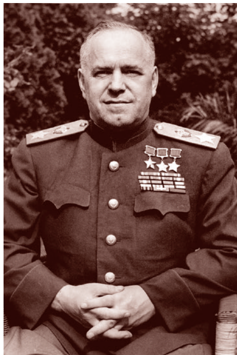
Георгий Константинович Жуков