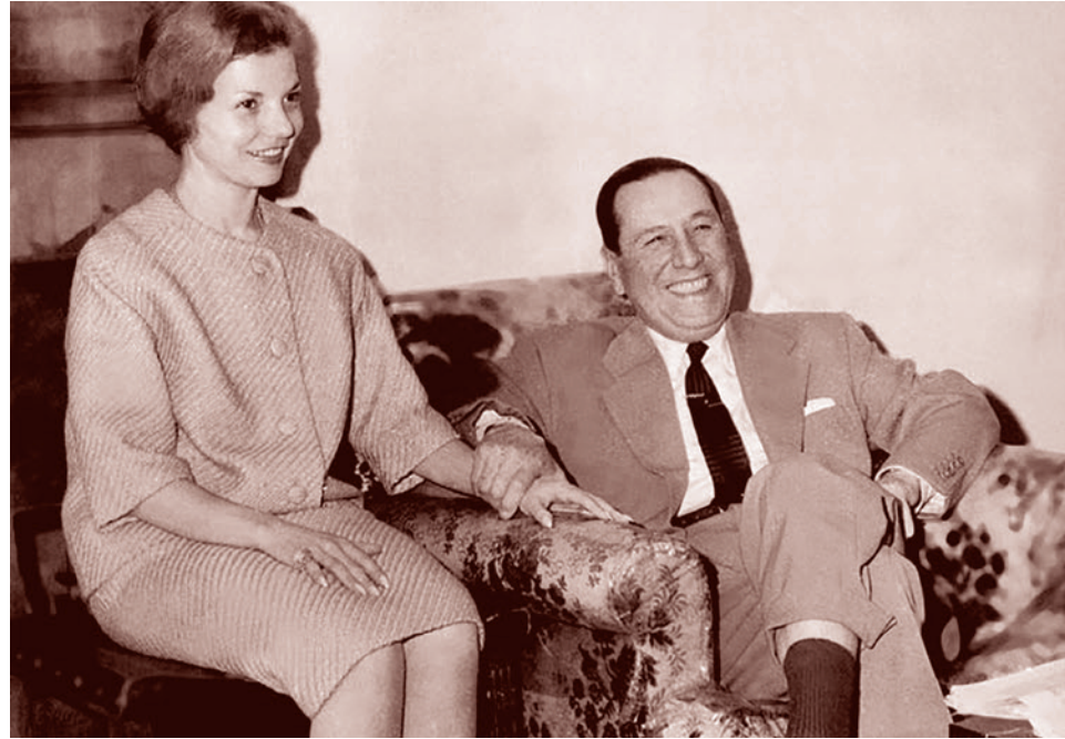
Исабель и Хуан Перон

Так, в сентябре 1955 года в результате переворота, осуществленного при поддержке католической церкви, диктатор был свергнут военными, которые на 18 лет наложили запрет на возвращение перонист-