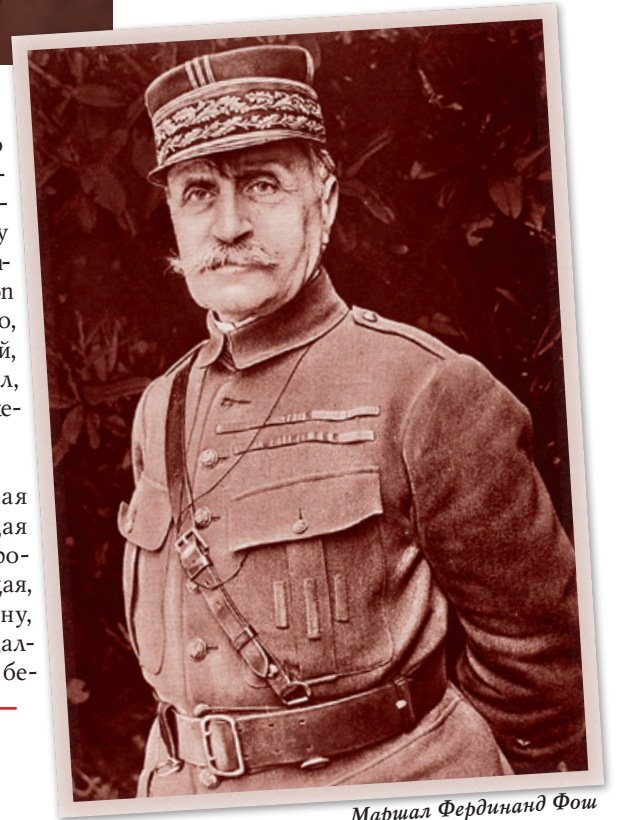
Маршал Фердинанд Фош