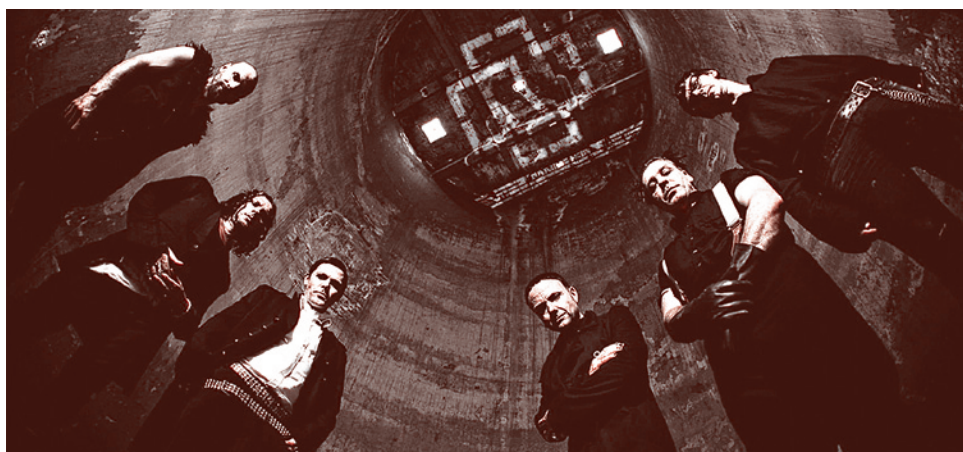
Группа «Рамштайн».

«Русско-немецкое примирение» активно осуществляется и на уровне общественных организаций, писательских ПЕН-клубов и пр.