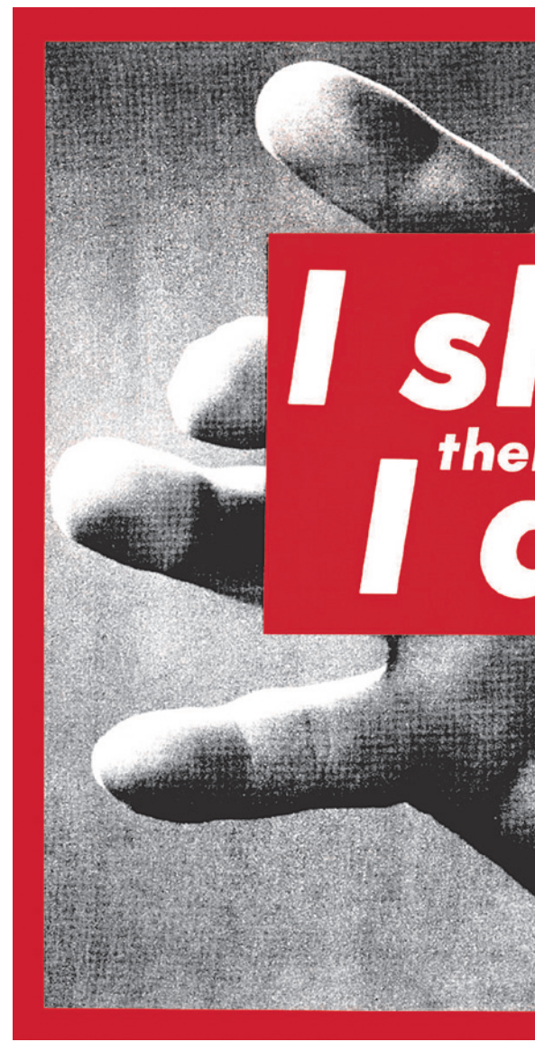
Барбара Крюгер. Без названия («Я покупаю, следовательно...»)

Но у большинства вышедших на Болотную очень плохо со смыслами, а также с образом будущего и представлением о благе — об этом свидетельствуют многие социологические исследования. Вот, например, в исследовании «Представления современной вузовской молодежи о будущем» авторы (О. Д. Волконогова, А. В. Малов, Е. М. Панина) изначально (и с удовлетворением) предполагали, что у молодежи смыслы утеряны — вместе с образом будущего. «Во-первых, мы ожидали увидеть явный переход от установки на фьючеризм к установке на настоящее. М. Кастильяс дал своеобразное экономическое видение этого феномена, заметив, что «коллапс коммунизма переориентировал русские, и особенно новые профессиональные классы, с долгосрочного горизонта исторического времени на краткосрочные перспективы времени монетизированного, характеризующего капитализм, заканчивая, таким образом, многовековое статистическое разделение между временем и деньгами».