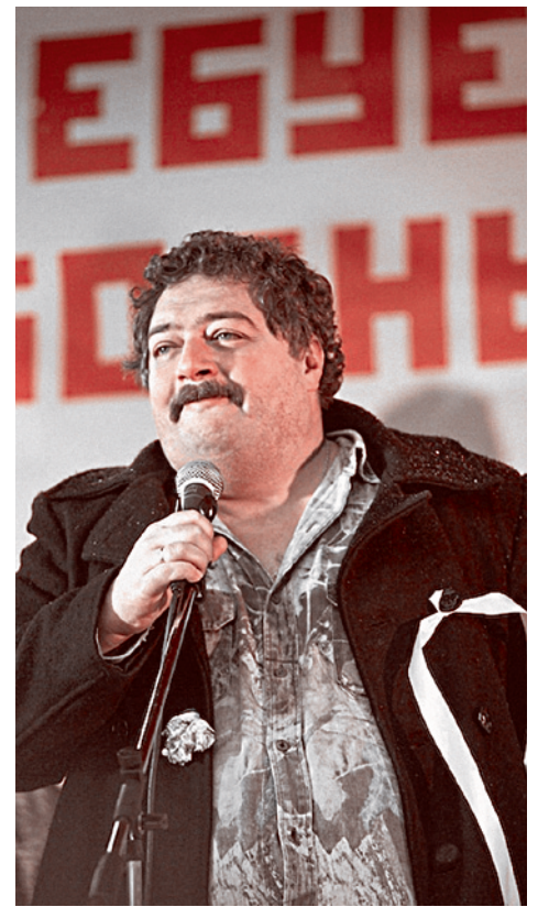
Д.Быков на одном из митингов белолакейщиков зимой 2011–2012 гг.

«И почему между буржуа столько лакеев, да еще при такой благородной наружности? Пожалуйста, не обвиняйте меня, не кричите, что я преувеличиваю, клевету,