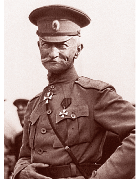
Генерал Алексей Брусилов в 1917 году.

По этому поводу существует замечательное наблюдение в мемуарах прославленного русского генерала, героя Первой мировой войны А. А. Брусилова. Он пишет не только о гораздо худшем, чем у противника, техническом оснащении русских войск, но и о том, что «еще хуже была у нас подготовка умов к войне... Даже после объявления войны прибывшие из внутренних областей России пополнения совершенно не понимали, какая это война свалилась им на голову, — как будто ни с того ни с сего. Сколько раз спрашивал я в окопах, из-за чего мы воюем, и всегда неизбежно получал ответ, что какой-то там эри-герц-перц с женой были кем-то убиты, а потому австрияки хотели обидеть сербов. Но кто же такие сербы — не знал почти никто, что такое славяне — было также темно, а почему немцы из-за Сербии вздумали воевать — было совершенно неизвестно. Выходило, что людей вели на убой неизвестно из-за чего, то есть по капризу царя. Что же сказать про такое пренебрежение к русскому народу?».