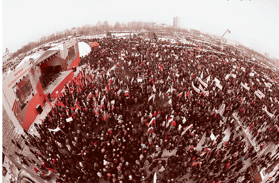
Митинг на Поклонной горе. 4 февраля 2012 г.