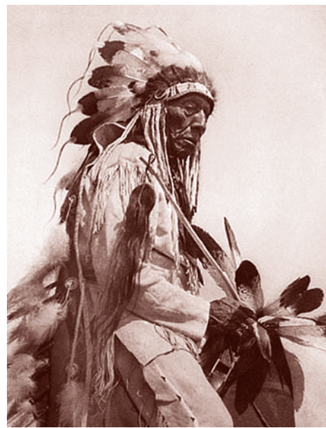
Американский индеец, конец XIX в. Обратите внимание, сколько гаджетов, то есть, протестов, перьев. Наверное, божья.

Да, совсем забыли. А гаджет — это родовое имя для всех айфонов, айпадов, айподов, а также мелких электронных устройств других производителей. Гаджеты в XXI веке заменяют собой перья, использовавшиеся индейцами: чем больше у тебя перьев, то есть, простите, гаджетов, и чем эти гаджеты дороже — тем ты круче.)