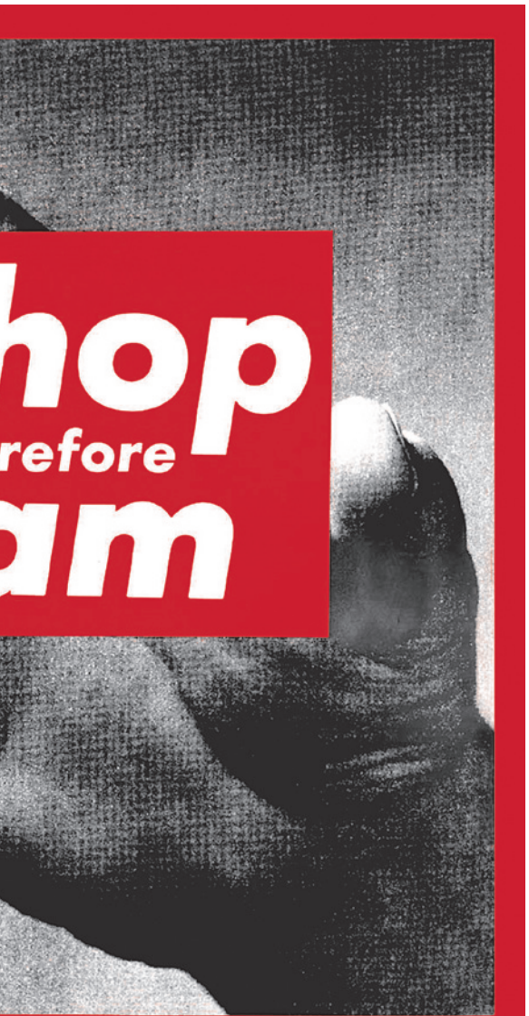
льно, существую»). 1987 г.

Вот эти-то люди, «без каких бы то ни было представлений о социальном идеале» и стали-таки «объектом для политических манипуляций» — «покупателями» Болотного протеста.