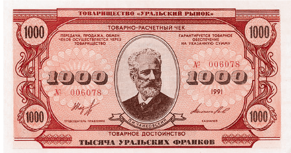
Купюра в 1000 уральских франков. Лицевая сторона — П.И. Чайковский, обратная — дом-музей Чайковского в Воткинске.

Для создания своего регионалистского мифа начинающий политик изучал труды основателей «сибирского областничества», выступавших со второй половины XIX века «против колониального гнета» имперского центра и за «предоставление Сибири автономного статуса». Заметим, что в 1917–1918 гг. часть «областников» вошла во временное Сибирское правительство (принявшее декларацию «О государственной самостоятельности Сибири») и поддержала адмирала Колчака.