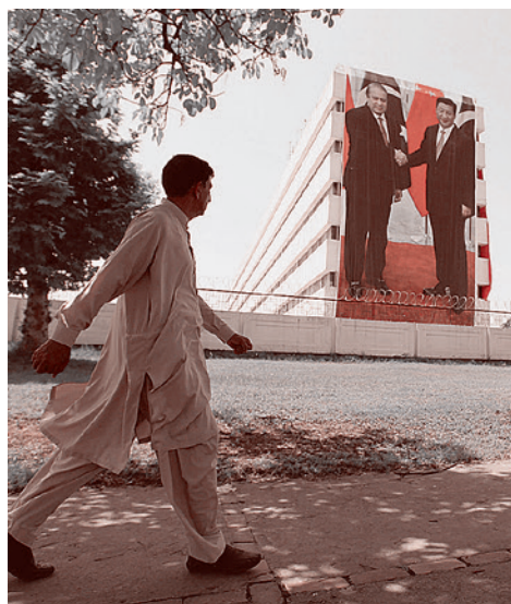
Баннер высотой в шесть этажей в Исламабаде посвященный визиту Си Цзиньпина в Пакистан.

Конечно, Пакистан самым серьезным образом рассорился с США после «самовольной» американской операции по убийству Усамы бен Ладена в 2011 г. в пакистанском Абботабаде. А также после множества атак американских беспилотников на талибов в пакистанском Северном Вазиристане, в результате которых погибли сотни мирных жителей и в стране росла внутривластная напряженность.