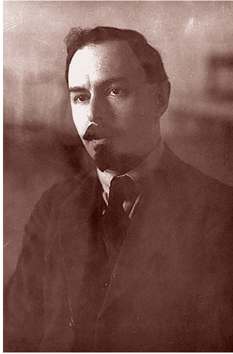
Григорий Яковлевич Сокольников

Леонид Серебряков исключался из партии как троцкист, вновь восстанавливался в партии, сохранял верность курсу левой оппозиции, никогда не скрывал своих симпатий к Троцкому. В итоге он был расстрелян 1 февраля 1937 года. И реабилитирован только 4 декабря 1986 года (троцкистов в хрущевское время не очень жаловали, и в первую волну реабилитаций они включены не были).