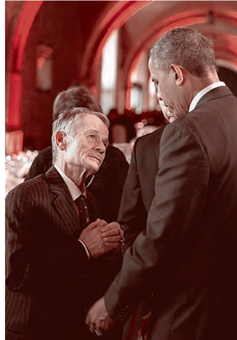
Джемилев и Обама

Как показывают последние события, на использование крымско-татарского фактора для политической дестабилизации и разрушения России нацелены не только киевская хунта, ее приспешники и западные покровители, но и наша отечественная либеральная оппозиция.