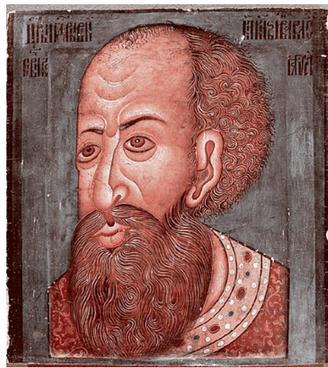
Иконописный портрет Ивана Грозного, XVI в.

Вдохновленный успехом взятия Казани и Астрахани, Иван IV бросил на решение этой задачи все силы государства. Надо сказать, что объективные предпосылки для победы были: усилиями и трудами Ивана III и Василия III Москва стала мощным государством, сильнее Литвы