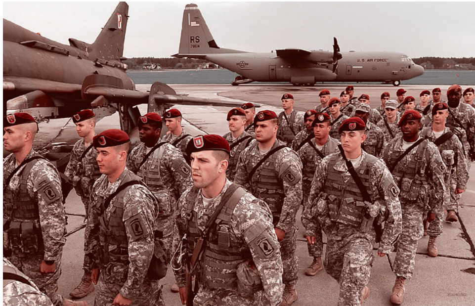
Американские десантники во Львове

«По имеющимся данным, на контролируемой ВСУ территории, а именно в Волновахе, обнаружено присутствие 70 представителей частной военной компании «Академи». Ранее данное вооруженное формирование носило название Blackwater», — приводит его слова Донецкое агентство новостей.