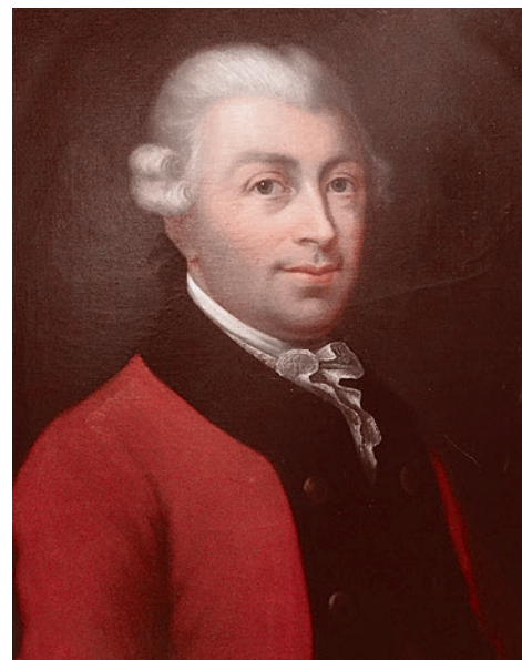
Герман Юнгас. Портрет Карстена Нибура

Основной труд Нибура называется «Описание Аравии». Нибур известен как математик, картограф и натуралист. Авторитет Нибура особо высок в Геттингенском университете. Так что Карстен Нибур (являющийся еще и отцом немецкого историка Бартольда Георга Нибура), в отличие от Фердинанда Лессепса, является в полной мере именно ученым, исследующим аравийский мир и Египет как часть этого мира.