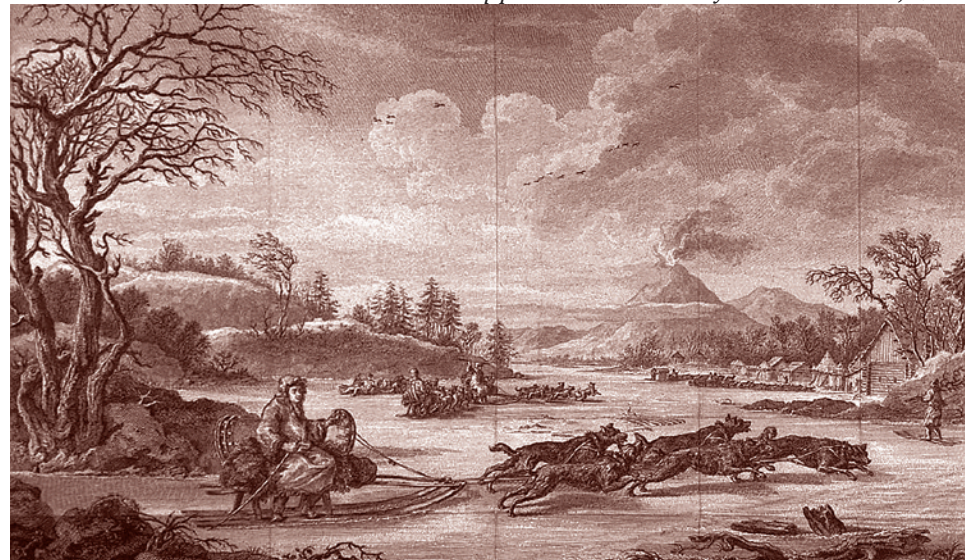
Жан-Батист-Варфоломей де Лессеп. Вулканы Камчатки, 1790 г.

С началом войны 1812 года Лессеп бежит из России. Наполеон берет Лессепа в свой поход и даже назначает генерал-интендантом Москвы. Позже, когда во Франции восстанавливается монархия, Людовик XVIII (как и все предшественники, симпатизирующий Варфоломею де Лессепу) пытается согласовать с Российской назначением Лессепа посланником. Но ему объясняют, что француз, который был генерал-интендантом Москвы, не может после этого исполнять высоких дипломатических функций в России.