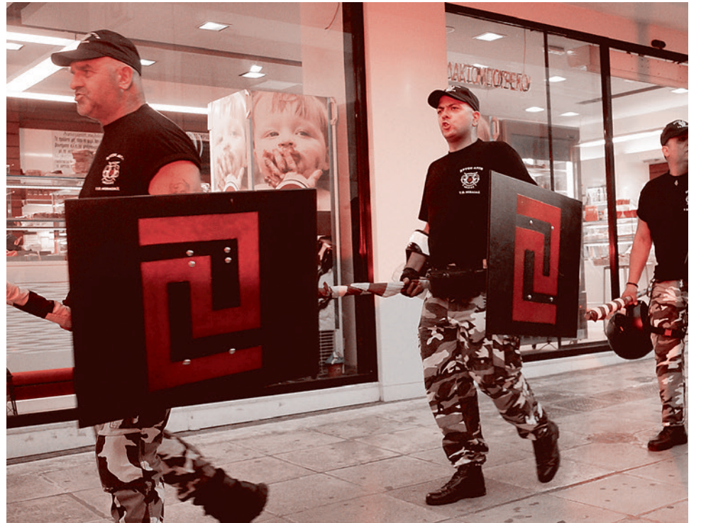
Акция партии «Золотая заря» в Афинах

«ЛГБТ-сообщество уже не пытаются представить как некое меньшинство, ущемляемое в правах большинством, и потому требующее защиты. Теперь аномалию выставляют как оформленную норму для населения. Причем оформляется новая «норма» не только в плане бытовом, но и на самом глубинном уровне — уровне языка».