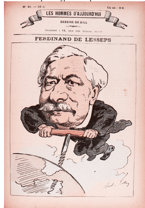
Карикатура на Фердинанда Лессепса

Мухаммеда Али-пашу это не устраивало. В 1839 году началась вторая турецко-египетская война. В ней Турция опять потерпела поражение. Мухаммед Али-паша потребовал от преемника Махмуда II, Абдул-Меджида, предоставить ему возможность осуществления наследственной власти над контролируемой территорией, в которую входил уже не только Египет.