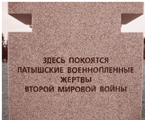
Мемориал латышским коллаборационистам. Пос. Рудничный

мя перекадинами знакомого фашистского вида. Ставятся они, несмотря на протесты ветеранов, непосредственно рядом с захоронениями наших воинов, и даже объединяются с ними в единые комплексы.