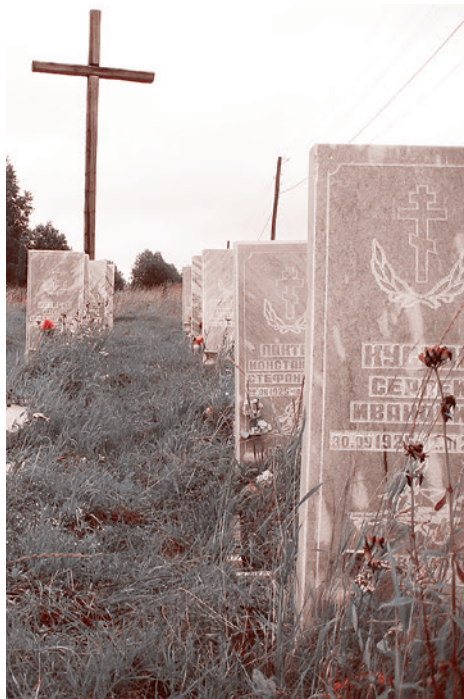
«Аллея славы». Пос. Лесной

Немецкий генерал войск СС Фридрих Еккельн, командовавший операцией «Зимнее волшебство», сообщал: «Гитлер очень отрицательно относится к населению Остланда и особенно латышам за плохое отношение к немецким борцам в 1919 г. <...> Гитлер не намеревался предоставить суверенитет прибалтийским странам... Гитлер смотрел на Остланд, как на место, подходящее для переселения туда излишнего немецкого населения, заслуженных солдат и инвалидов войны... Местное население как не поддающееся ассимиляции должно было быть эвакуировано и использовано в германской промышленности».