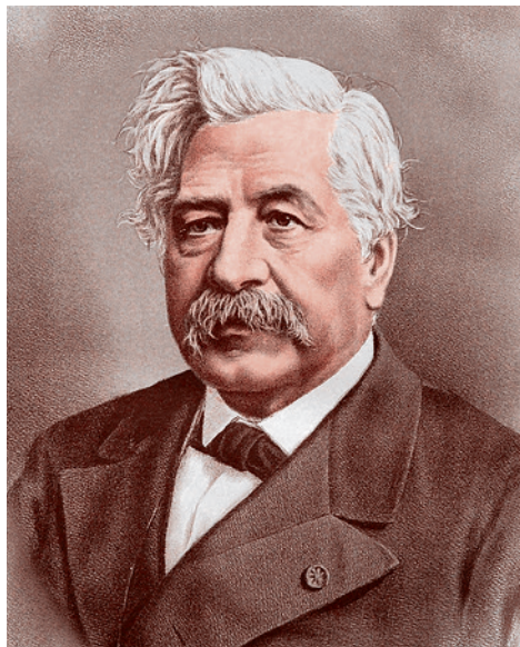
Фердинанд де Лессепс

Прогулки по одному такому мосту между уважаемой египтологией и неясной метафизикой марксизма по определению не способны привести к познанию всего того сокровенного, что связано с древнеримской и в целом западной идентичностью.