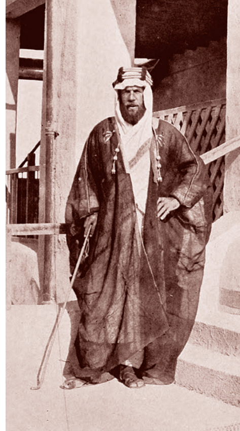
Отец Кима Филби — Сент-Джон Филби

Так адепты, не выдержавшие испытания в неких древних храмах, превращались в кастратов, поющих хвалебные песни на ступенях этих храмов.