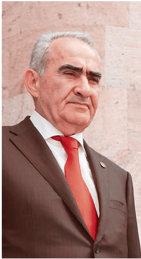
Председатель национального собрания республики Армения Галуст Саакян

«Сегодня мы видим, что угроза неонацизма реальна и проявляется в самых разных частях мира и Европы. К примеру, просто больно осознавать, что при голосовании за резолюцию генеральной ассамблеи ООН, резолюции, направленной против реабилитации нацизма, три страны — Канада, Соединенные Штаты Америки и, к сожалению, нынешние власти братской для нас Украины — голосовали против», — сказал спикер Госдумы.