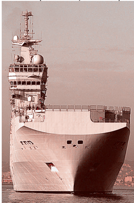
Вертолетоносец типа «Мистраль»