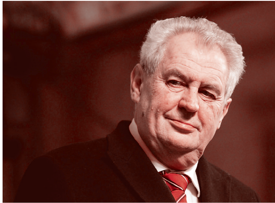
Президент Чехии Милош Земан

Многие зарубежные лидеры отказываются участвовать в торжествах по поводу 70-летия окончания Второй мировой войны, которые пройдут в сентябре в Пекине. Об этом сообщает гонконгское издание The South China Morning Post. Празднование 70-летия окончания Второй мировой войны пройдет в Пекине 3 сентября (2 сентября 1945 года Япония подписала акт о капитуляции).