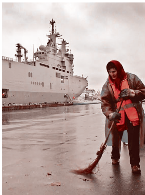
Вертолетоносец типа «Мистраль» в Санкт-Петербурге

И у флота, и у промышленности были (и есть) свои исследовательские центры, которые изучают опыт своих и чужих боевых действий, тенденции развития морской техники. Но к выводам они приходят разным.