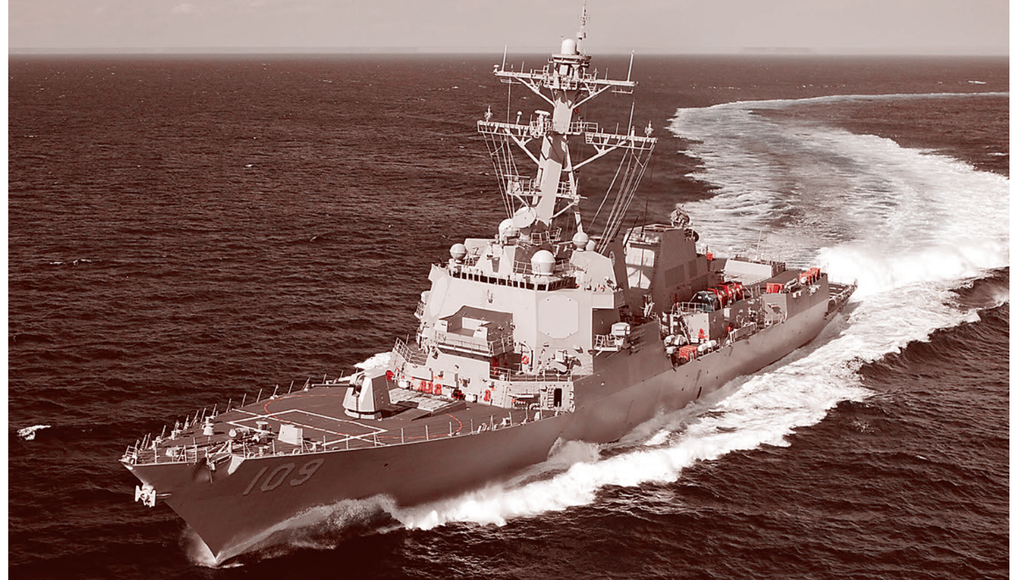
Эскадренный миноносец управляемого ракетного оружия DDG 109 «Джейсон Данхем»

Все, кто слушает и читает американские заберения о приверженности содействию миру и стабильности, — обратите внимание на то, с какой скоростью и тщательностью американцы покинули Йемен, как только там по-настоящему обрушились мир и стабильность. И ни на какие свои военные преференции не посмотрели — уехали и всё, а вещи тщательно собрали, чтобы шиитам не достались. Вот и вся гарантия стабильности. Войдите.