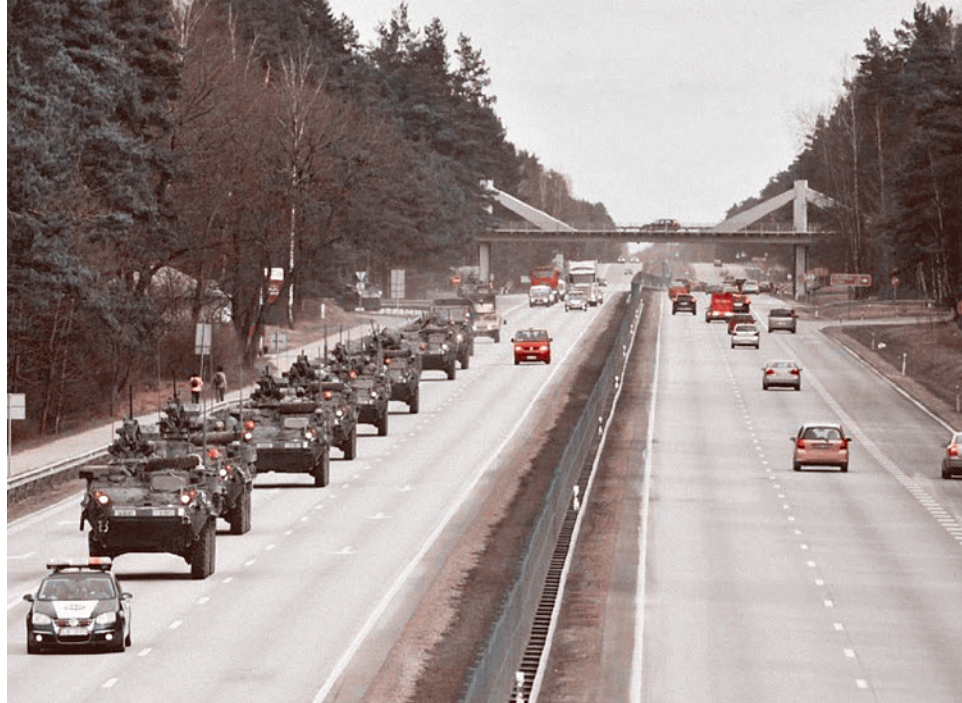
Колонна американской военной техники на шоссе неподалеку от Риги, Латвия, 22 марта 2015 г.

На днях в столице Латвии открылся штаб НАТО для информационной борьбы в Восточной Европе. Рижский штаб стал третьим по счету натовским пропагандистским центром (до него подобные центры были открыты в двух европейских странах — в Бельгии и в Испании). По словам Сергея Володенкова, научного руководителя программы «Политический менеджмент и связи с общественностью» на факультете