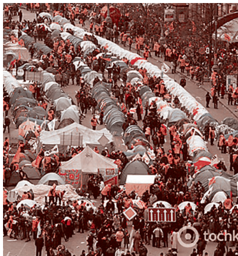
Палатки в Киеве, 2004 г.