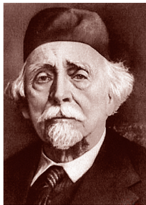
Николай Дмитриевич Зелинский

Иосифу Виссарионовичу Сталину нужно было, чтобы тот или иной блестящий ученый создавал нечто, необходимое для индустриального развития СССР. И прежде всего — для обороны. Если какой-нибудь такой блестящий ученый (например, академик Николай Дмитриевич Зелинский), создавая нечто очень нужное Сталину и стране, увлекался одновременно той же алхимией, — что ж, Сталин это допускал, предоставлял для этого определенные условия.