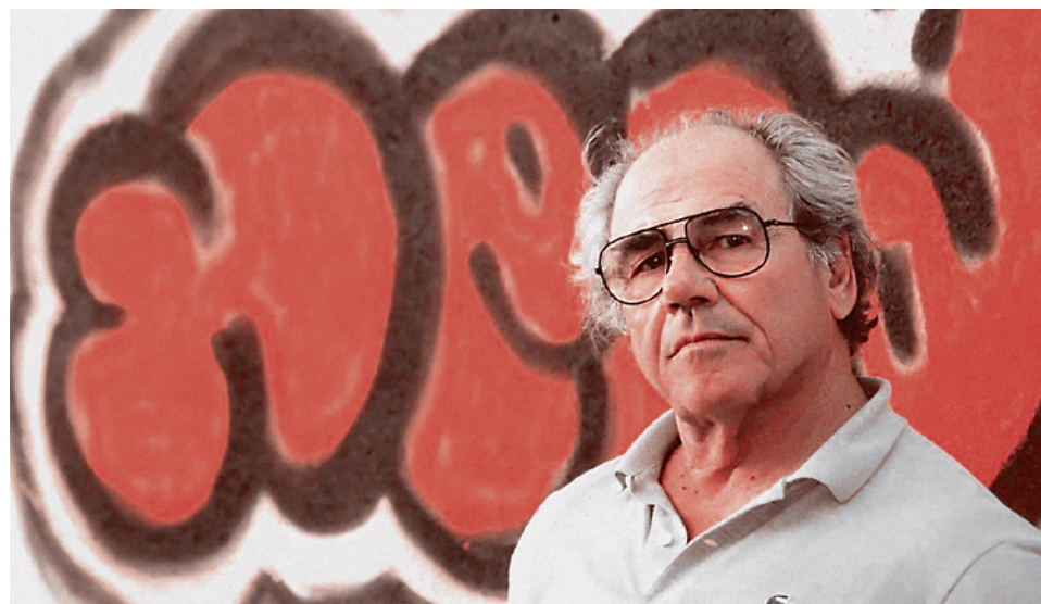
Жан Бодрийяр.

Александр Солженицын сообщил, что кровавый коммунистический режим уничтожил... ну, предположим, 60 миллионов людей. Потом либеральные честные историки (представьте себе, бывают такие, хотя их очень немного), потянув над документами, обнаружили, что Солженицын преувеличил этак раз в 50. И что? Кого теперь это интере-