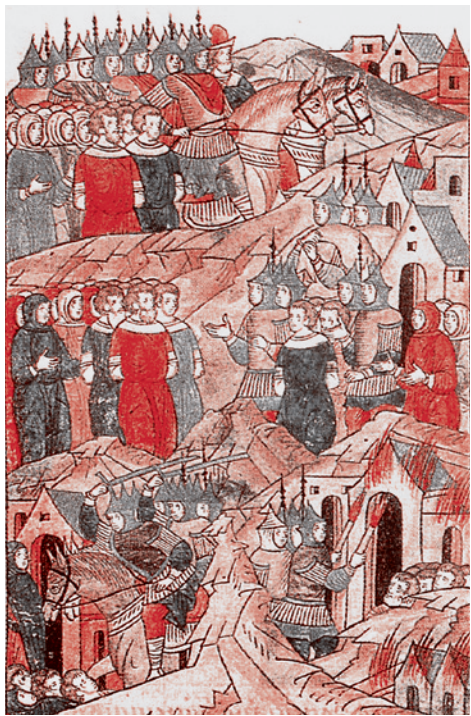
Повесть о разорении Рязани Батыем. Миниатюра. Лицевой свод XVI в. Древний летописец, т. II. (Санкт-Петербург, АН)

В предыдущем номере нашей газеты мы затронули такое актуальное направление диффузной сепаратистской войны, как проникновение нетрадиционных течений ислама и исламистских организаций в различные регионы России. Свообразными «порталом» для такого проникновения за последние 20 лет стали «мусульманские республики», в большинстве которых разыгрывается примерно один и тот же сценарий, способный привести к дестабилизации общественно-политической ситуации и распаду страны.