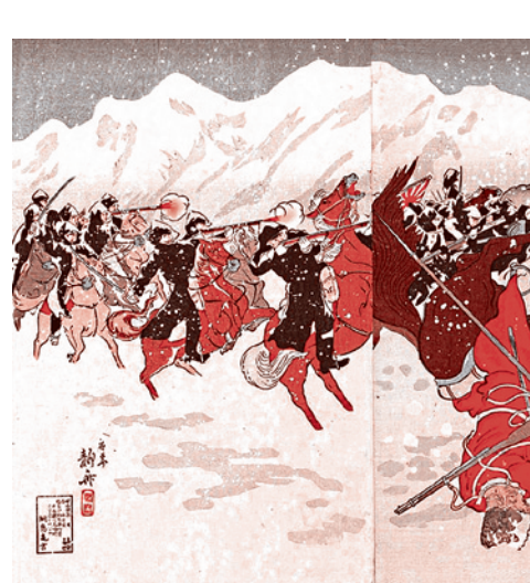
Атака японской кавалерии — японский плакат времён русско-японской войны.

Первая — недоучет значения поражения в русско-японской войне. Поражение в войне было сочтено казусом, случайностью. Ведь победившая Япония, убеждала царя военные руководители, к концу войны на самом деле была на грани истощения, а Россия только-только разворачивала свои силы. А великий князь Николай Николаевич, председатель Совета государственной обороны и сторонник продолжения войны, даже обещал, буде ему дадут такую возможность и 1 миллиард рублей, через год собрать новую армию и вернуть потерянные позиции.