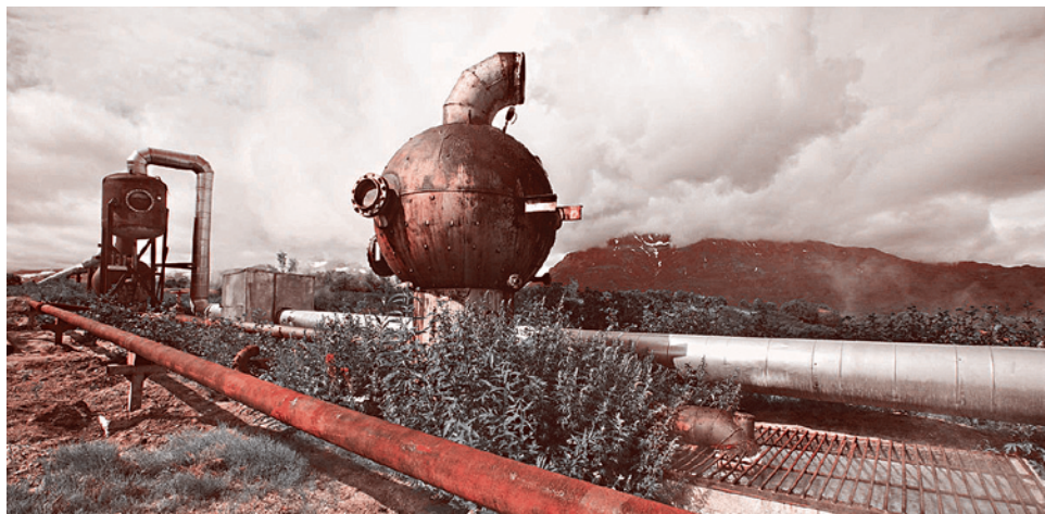
Паужетская геотермальная электростанция (введена в строй в 1966 г.) в пос. Паужетка на Камчатке, около вулканов Кошелева и Камбального.

Ранее я договорился с читателем о том, что проблематику возобновляемых источников энергии (ВИЭ) сначала буду рассматривать с «академических» позиций, и лишь затем обсуждать с точки зрения энергетической войны. В предыдущей статье я обсудил солнечную и ветровую энергетику (и, признаю, лишь отчасти сумел воздержаться от «военных» аспектов развития ситуации в этих сферах).