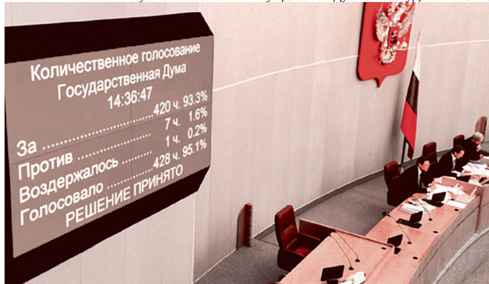
Результаты голосования в Государственной Думе по «закону Димы Яковлева»