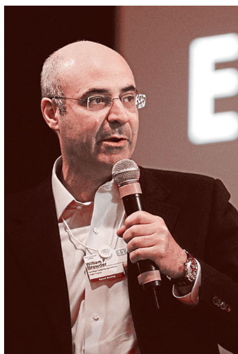
Рис. 3. Билл Браудер

Итак, «Эрмитаж», созданный двумя крупными международными финансовыми авантюристами Браудером и Сафрой, спекулировал ГКО и другими нашими ценными бумагами. В основном, конечно же, ГКО Потому что ГКО на тот момент обеспечивали невиданную на любых западных рынках доходность (60% и более годовых).