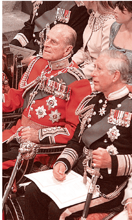
Принц Филипп, герцог Эдинбургский, и Чарльз, принц Уэльский

То есть отказ от проекта Модерн во имя как-то совершенно другого проекта, опирающегося на управляемый регресс. Что это за проект?