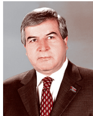
Сабир Рустамханлы — Депутат Милли Меджлиса Азербайджана, глава «Партии гражданской солидарности», сопредседатель «Конгресса азербайджанцев мира»