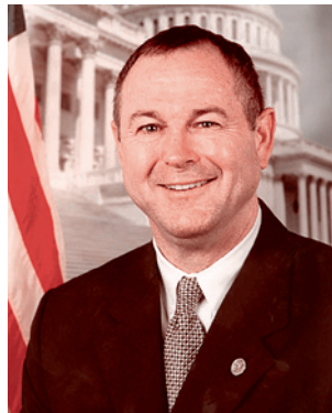
Дана Рорбахер — конгрессмен от Калифорнии, член Республиканской партии США

В начале мая 2012 года перед консульством кавказского Азербайджана в Тебризе