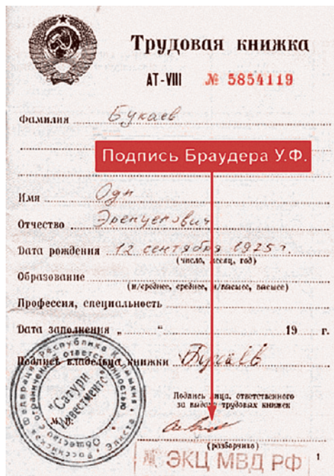
Рис. 1. Трудовая книжка Букаева с подписью Браудера

Вначале предлагаем читателю ознакомиться с рисунком 1.