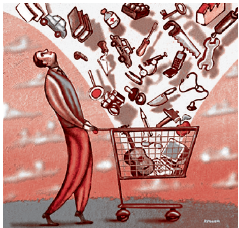
Сверхпотребление.

В предыдущей статье — она называлась «О победившей идее» — мы, заглянув за рублевскую шторку победившего класса, обнаружили примерно то, что и ожидали увидеть: «довольных счастливых людей». Названные так без всякой симпатии и зависти еще А.Чеховым, они едят и гуляют, ни в чем себе, как говорится, не отказывая. И совершенно не мучаясь угрызениями совести — что же это они натворили со страной? А поскольку это не переселенцы из другой галактики, важно понять, как именно оно (вот это «немученье») удалось людям, воспитанным вроде в русской культуре. Ведь есть же противоречие! Всякий, не с Луны свалившийся, а росший здесь, и особенно в перестроечное время — учился в школе, книжки больше или меньше читал, вообще жил в климате, не предусматривавшем такого культа «телесного» и такого небрежения духом. Как и наплевать на близких. Всего этого советская, шире, русская жизнь не предусматривала.