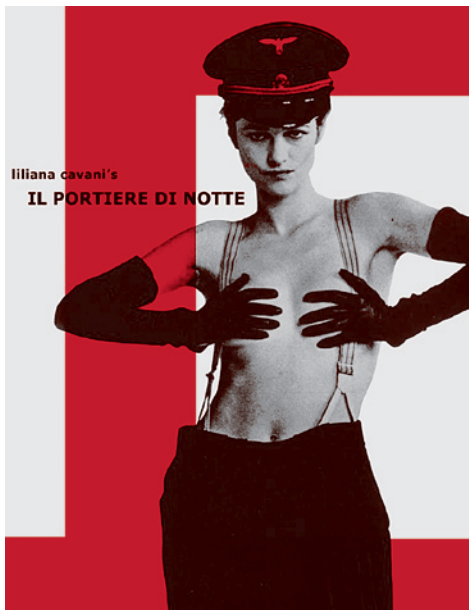
Постер к фильму Лилианы Кавани «Ночной портье».

Итак, задавшись целью исследовать истоки фашистской жестокости, Лилиана Кавани в итоге приходит к выводу, что проблема коренится вовсе не в особенностях немецкой культуры, немецкого духа. А в том, что природа любого человека, вне зависимости от его национальной принадлежности, двойственна. В нем содержится и доброе, и злое начало, но злое — мощнее.