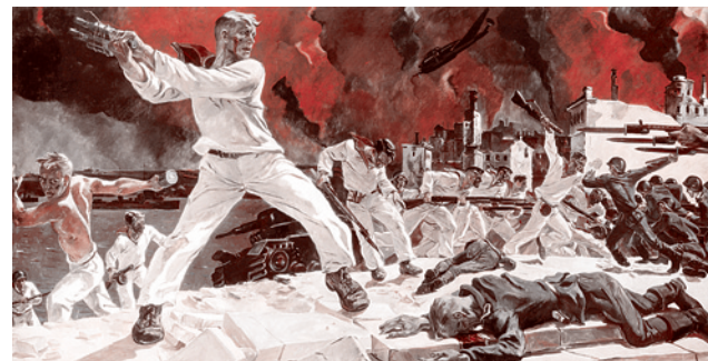
Одухотворенные люди. — А.А.Дейнека. Оборона Севастополя, 1942. Государственный Русский музей