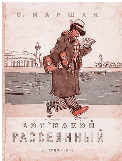
Обложка книги издательства «Детгиз», 1958 г.