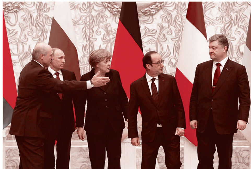
Минск, 12 февраля 2015 г.

Текст документа, выработанный в ходе переговоров «нормандской четверки», был направлен для обсуждения в контактную группу. Однако, по данным информированного источника, лидеры ДНР