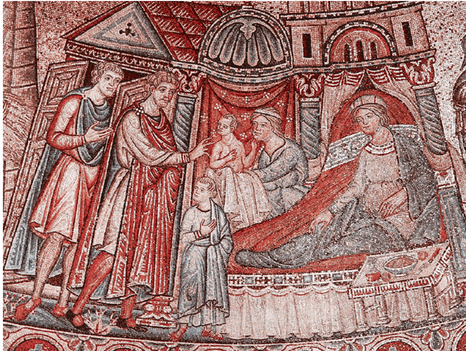
Иосиф с Асенефой и детьми (мозаика нартекса базилики Сан-Марко)

«Что касается ее имени, которое она писала «Нс-нт», то оно было связано с богиней Нейт из Саиса, города в Дельте; оно означало «Принадлежащая Нейт», и следовательно, «девушка» была