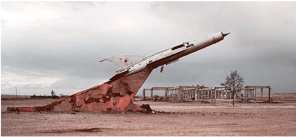
Бывший аэродром 126 полка ВВС СССР, Монголия.