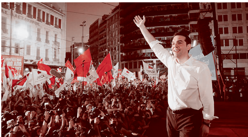
Лидер партии СИРИЗА Алексис Ципрас со своими сторонниками празднует победу