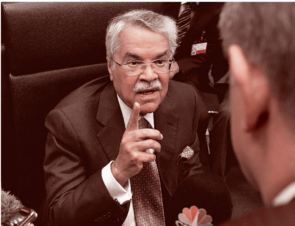
Министр нефти Саудовской Аравии Али аль-Нуйями