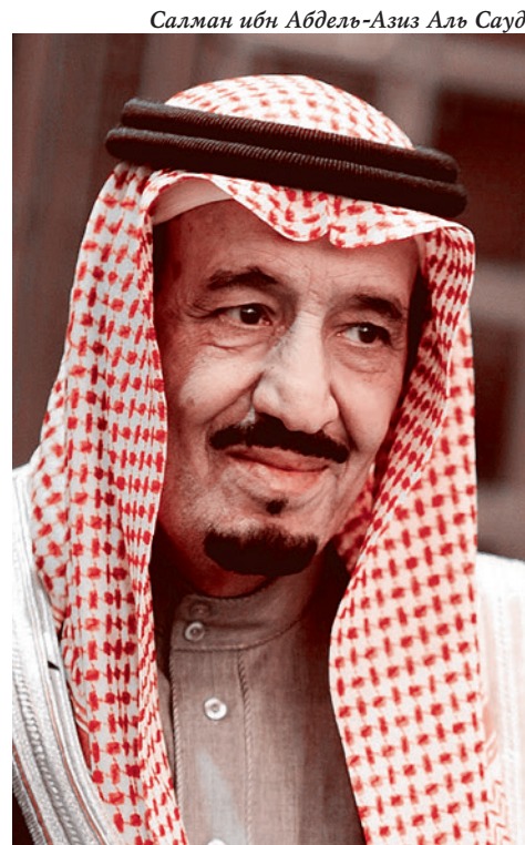
Салман ибн Абдель-Азиз Аль Сауд

... Нефтяной рынок снова залихорадило. Эксперты расходятся в прогнозах насчет того, готов ли новый король менять нефтяную политику страны.