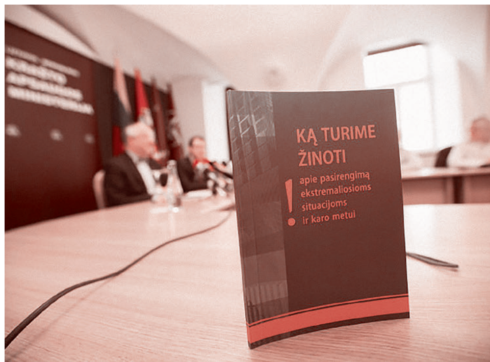
Презентация книги министерства обороны Литвы «Что нужно знать о подготовке к экстремальным ситуациям и в случае войны»