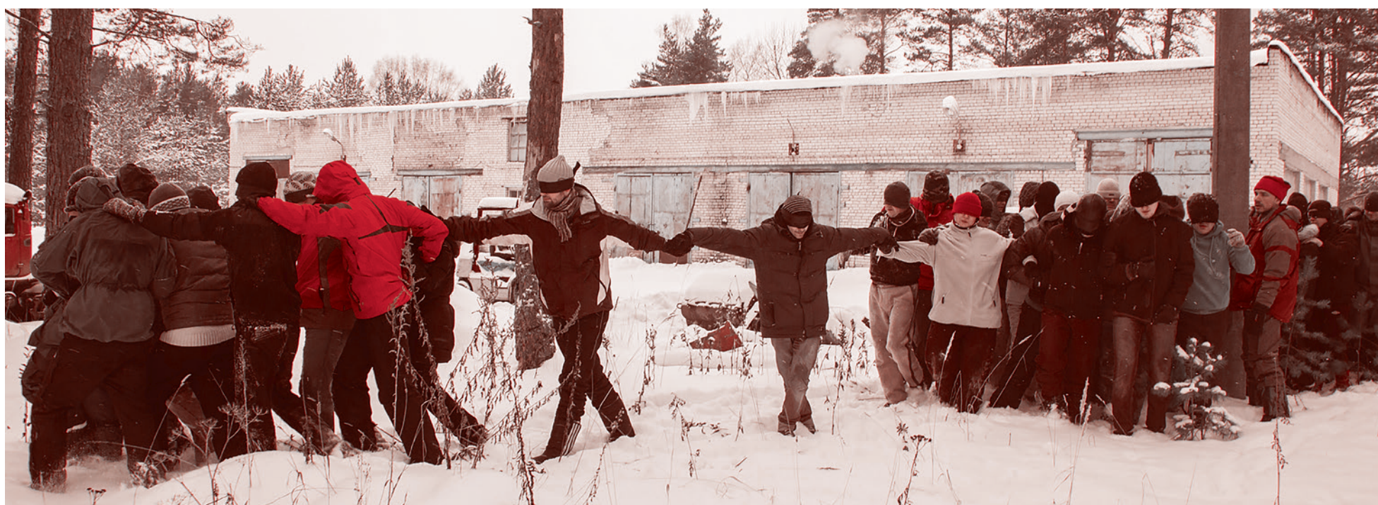
Здесь и далее: фотографии со спортивного дня Школы высших смыслов

Продолжение доклада на зимней сессии Школы высших смыслов Александровское, январь 2015 года