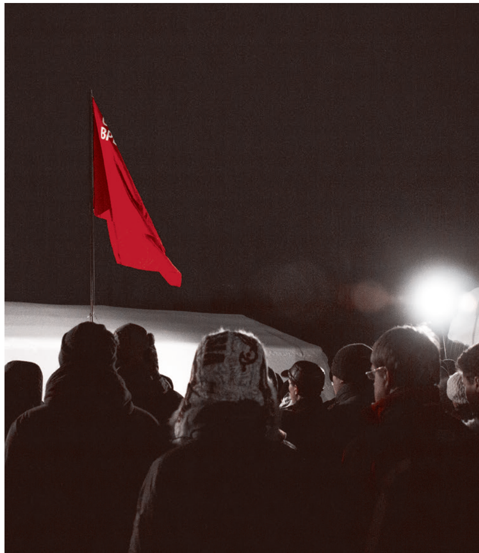
Подъем флага и торжественное открытие Школы высших смыслов

Такой ответ должен иметь решающее практическое значение. И его нетрудно дать, если без легкомысленного пренебрежения отнестись к своему прошлому: я имею в виду не прошлое страны, а прошлое нашего движения.