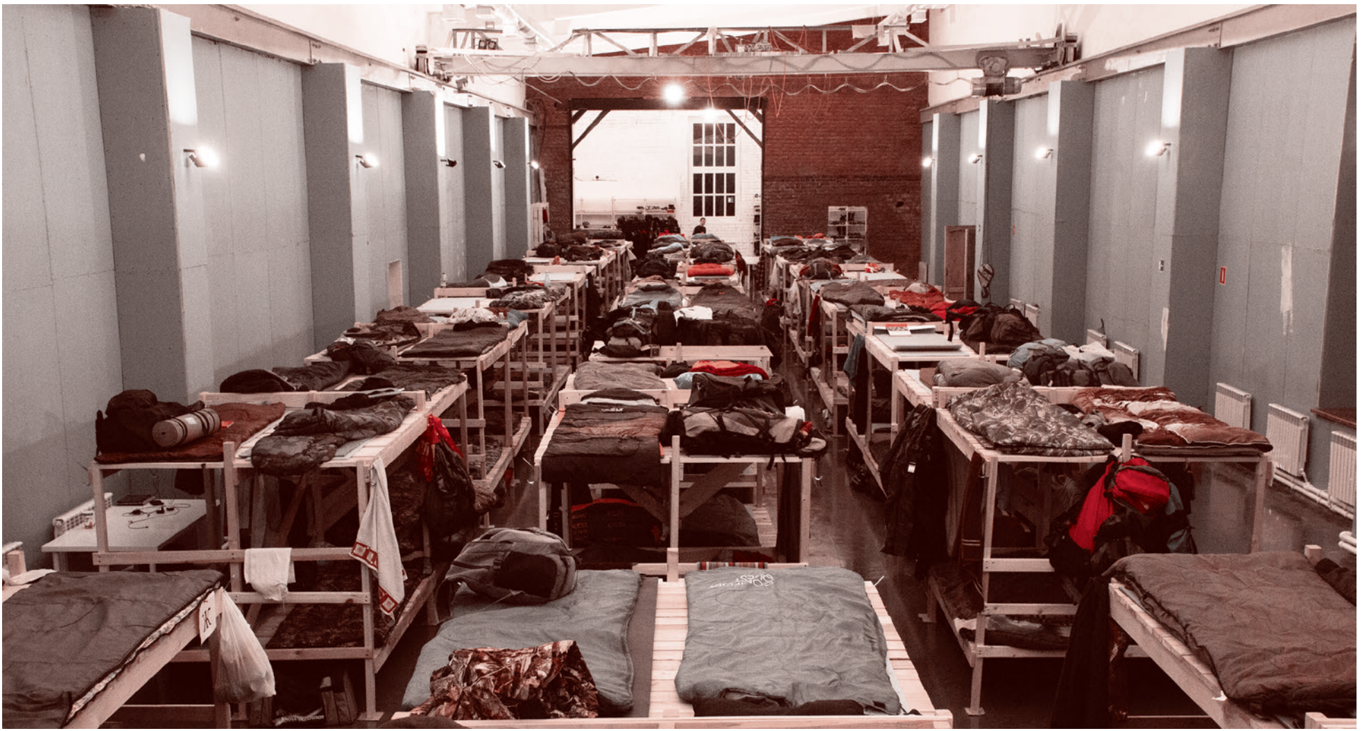
Одно из общежитий ШВС