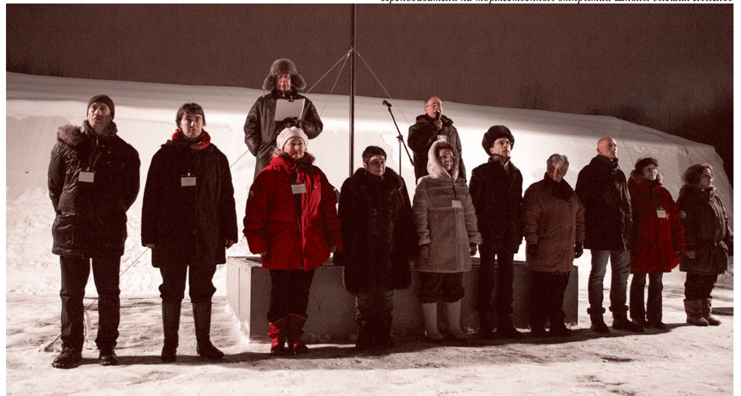
Преподаватели на торжественном открытии Школы высших смыслов

Если бы не было Первой мировой войны, в ходе которой уже была осуществлена революция, и если бы судороги после мировой войны не удерживали этот истощенный обезумевший мир буржуазии, она бы напала всей силой на Советскую Россию и раздавила бы ее за три месяца. Был уникальный исторический момент, порожденный мировой войной. И всю эту паузу большевики взяли для строительства. И вот тут они выжали население, вот тут они сконцентрировали ресурсы, вот тут