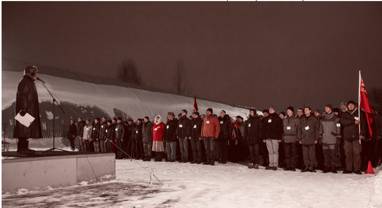
Учащиеся на торжественном открытии Школы высших смыслов

Закрепив эту необходимость уже при обсуждении целей, я намерен еще раз ее обсудить впоследствии в этом же докладе. А сейчас я хочу перейти от теории к практике.