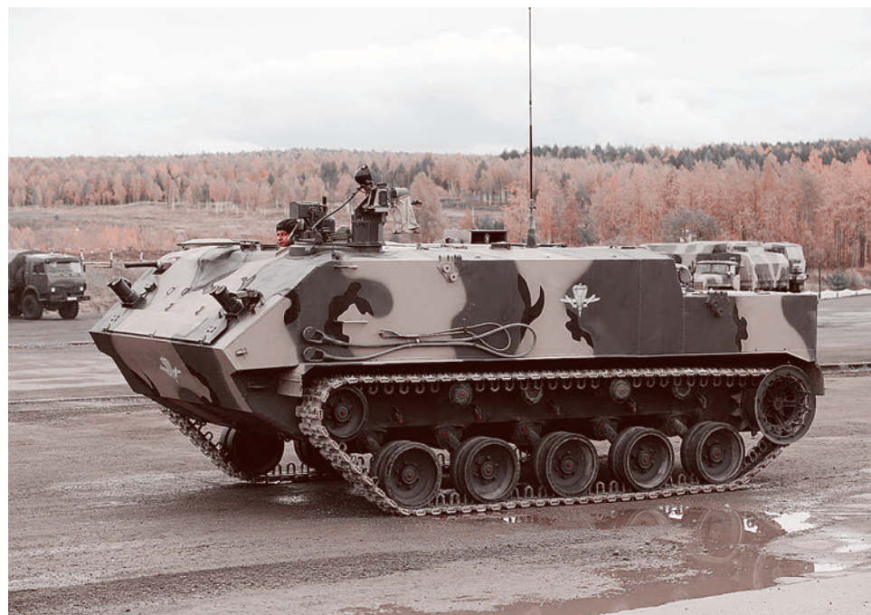
БМД-4М(внизу) и Бронетранспортер «Ракушка» (сверху)

Между тем, американская лазерная программа, несмотря на все заверения военных, признана их же экспертами бесперспективной, а затем было прекращено и ее финансирование. Впрочем, Пентагон, несмотря на неудачу, не останавливает работы по этой тематике, так что мы вскоре станем свидетелями «лазерной» гонки.