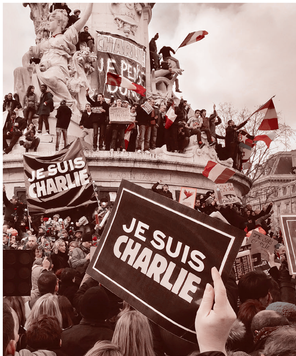
11 января 2015 г. Париж.

Как сообщил глава Наблюдательного комитета Французского совета мусульманского культа Абдалла Зекри, ссылаясь на данные министерства внутренних дел, во Франции зафиксировано 21 нападение — стрельба, метание гранат и 33 случая с угрозами и оскорблениями. При этом Зекри обратил внимание, что в этой статистике не учитывается ситуация в Париже и пожар в мечети в городе Пуатье, случившийся в воскресенье вечером.