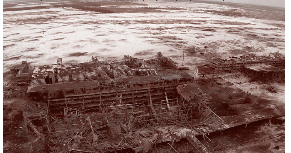
Вид на терминал и летное поле донецкого аэропорта. Примерно 19 января.