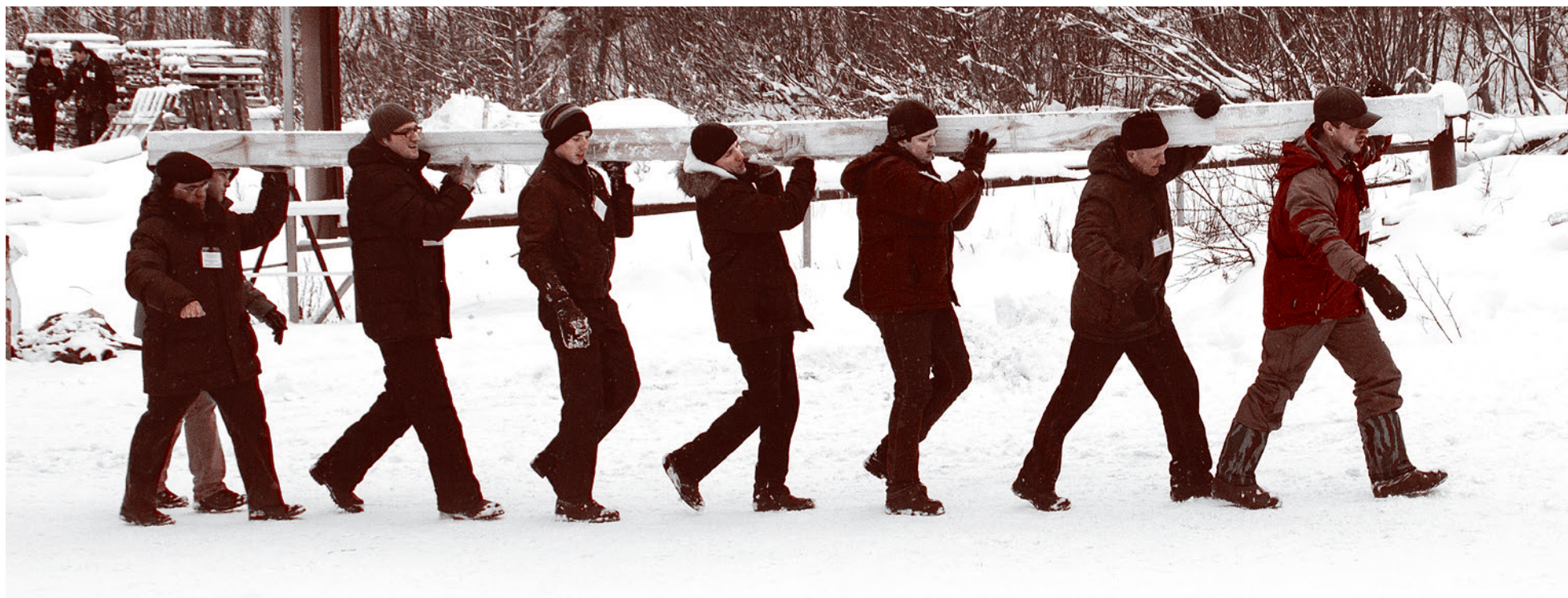
Учащиеся перед открытием ШВС. Помогают поселенцам в складировании строительных материалов и отходов производства

Доклад на зимней сессии Школы высших смыслов Александровское, январь 2015 года