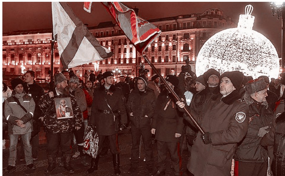
«Антимайдан» на Манежной площади 15 января 2015 г.

Эксперты в области международной политики безопасности 15–16 января в Тракае и Вильнюсе обсудят последствия российской агрессии для безопасности Европы. МИД Литвы организует традиционную неформальную «Снежную встречу» (Snow Meeting). Основная тема данного мероприятия «Как Западу защитить свое общество и демократические ценности, когда Россия агрессивно перечерчивает карту Европы». На встрече намереваются обсудить, как установить отношения между Западом и Россией, как помочь Украине, Молдове, Грузии и другим странам преодолеть давление со стороны России и добиться евроатлантической интеграции.