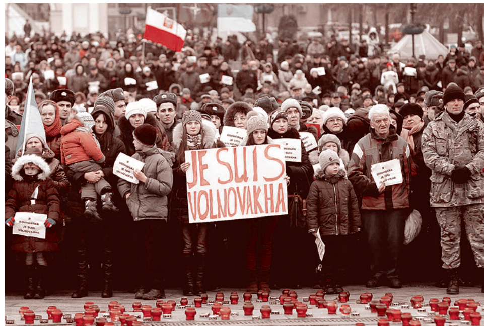
18 января. Киев.

Киевским властям следовало бы признавать свои ошибки, если они намерены идти по пути построения правового демократического государства, отмечает исполнительный директор международной правозащитной организации Human Rights Watch (HRW) Кеннет Рот, комментируя выступление премьера Украины Арсения Яценюка в Берлине. В ходе своего визита в Германию, отвечая на вопрос журналиста издания Frankfurter Allgemeine об обстреле украинскими силовиками населенных пунктов в Донбассе кассетными бомбами, а также из установок «Град», украинский