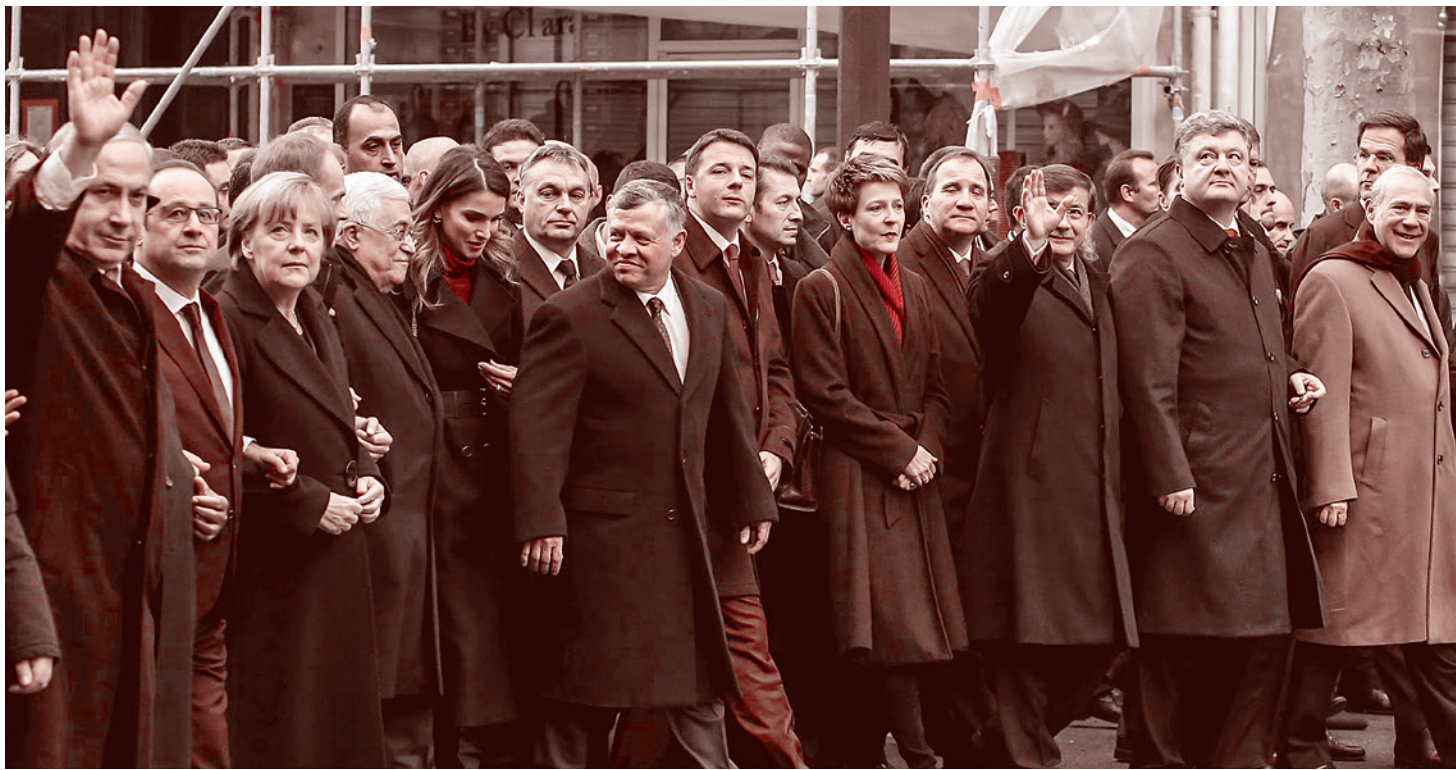
Чиновники на марше в Париже 11 января 2015 г.