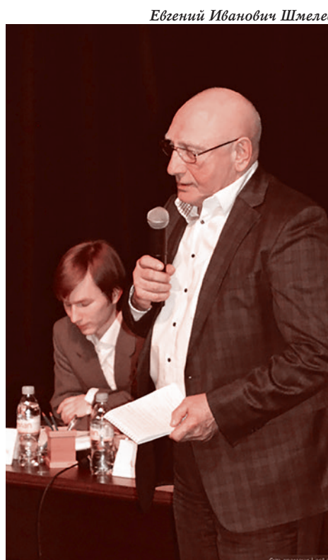
Евгений Иванович Шмелев