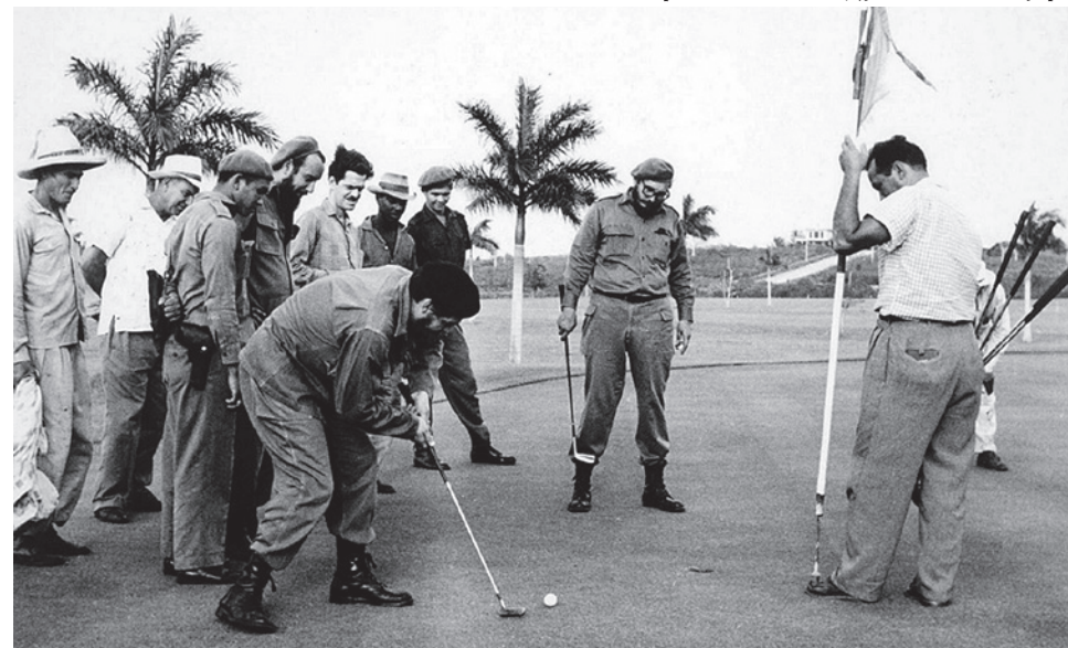
Эрнесто Че Гевара и Фидель Кастро за игрой в гольф. Тонкая отсылка к хобби Президента США Дуайта Эйзенхауэра

Дипломатические отношения между Гаваной и Вашингтоном были разорваны в 1961 году после Кубинской революции, которая длилась с 1953 по 1959 год. После революции были национализированы сотни американских компаний, работавших тогда на Кубе. Одним из лидеров революции был Фидель Кастро, он и стал новым главой страны. В ответ на действия кубинских властей США ввели против Кубы торговое эмбарго, а также запретили американским гражданам посещать островное государство. Фидель Кастро официально председателя Госсовета в 2008 году. Новым главой государства Национальная ассамблея избрала брата Фиделя Кастро — Рауля.