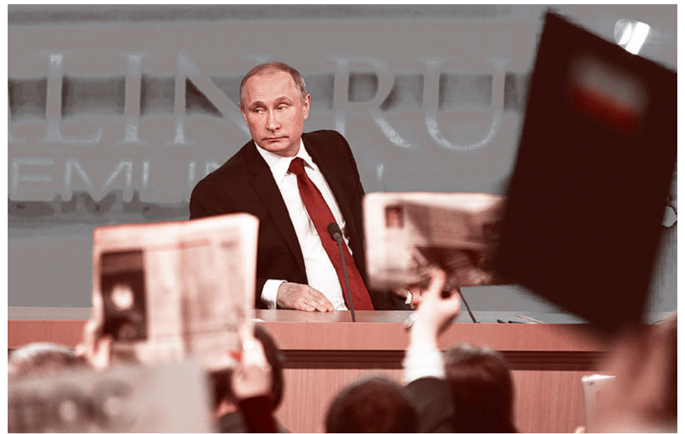
Владимир Путин на пресс-конференции 18 декабря 2014 г.

Он сообщил, что уже проинструктировал госсекретаря США Джона Керри немедленно начать переговоры с кубинскими властями о восстановлении дипломатических отношений. Обама также отметил, что США будут предпринимать шаги по наращиванию торговых отношений с Кубой. Кроме того, США вскоре вновь откроет свое посольство в кубинской столице Гаване. Также Обама заявил о предстоящих двусторонних визитах высокопоставленных представителей Кубы и США. Также Обама пообещал, что Куба