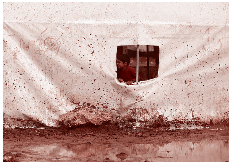
Лагерь беженцев Zaatari на севере Иордании, недалеко от границы с Сирией

«Свыше 50 авиаударов, нанесенных в последние дни, позволили курдам вернуть эти территории в районе населенного пункта Синджаф на северо-западе страны недалеко от границы с Сирией», — пояснил Терри.