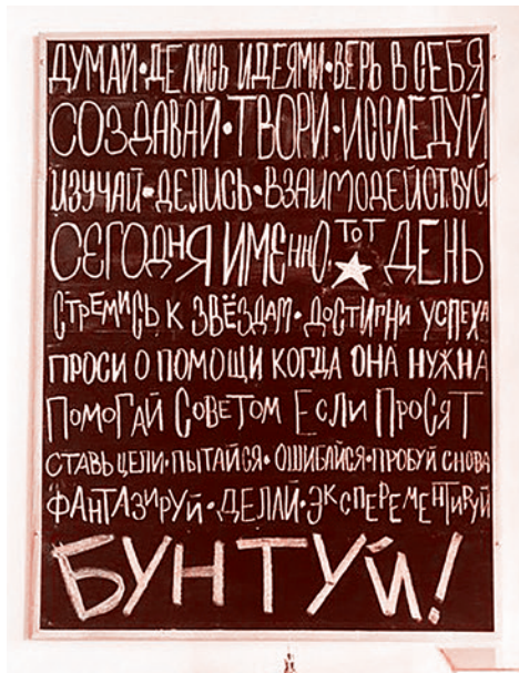
Креативная доска в креативном пространстве «Проектор»

Результатом проекта стал запуск интернет-журнала, который начал