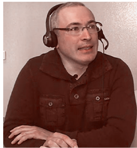
М. Ходорковский во время телемоста