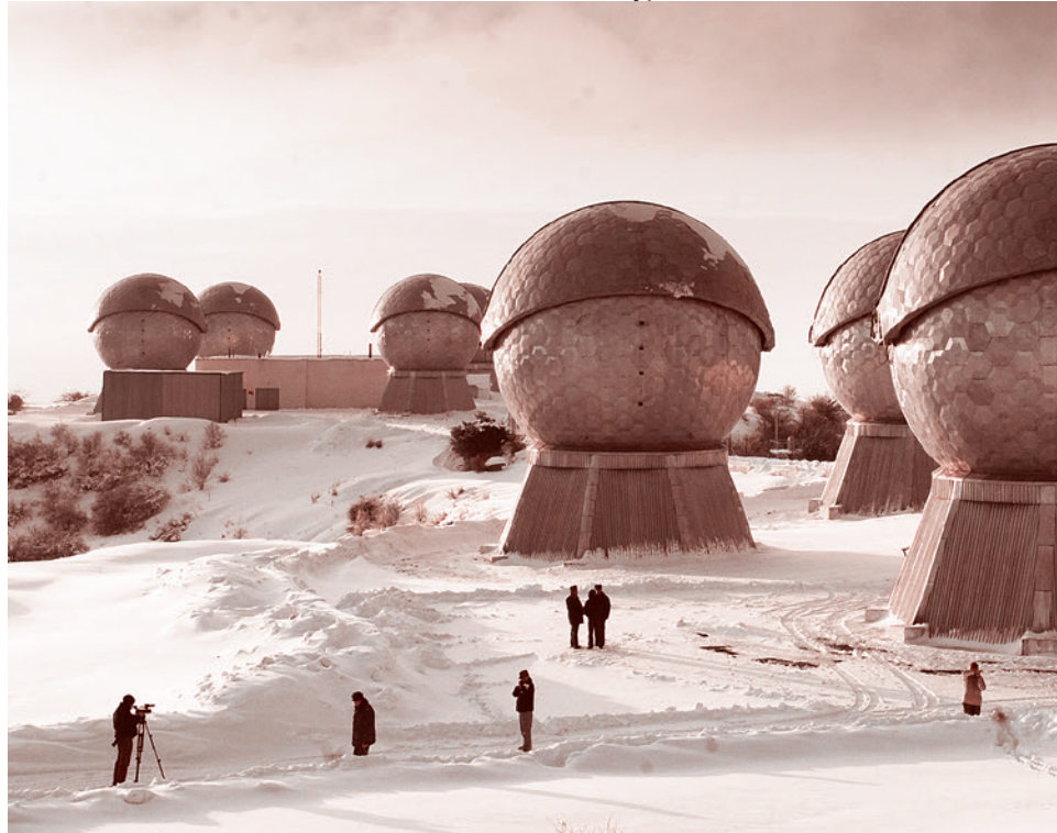
Комплекс обнаружения космических объектов «Окно»

В связи с ростом напряженности в мире, в частности, антироссийскими заявлениями командования НАТО, Минобороны РФ приняло решение об усилении новой военной техникой войск ЗВО — на самом угрожаемом направлении