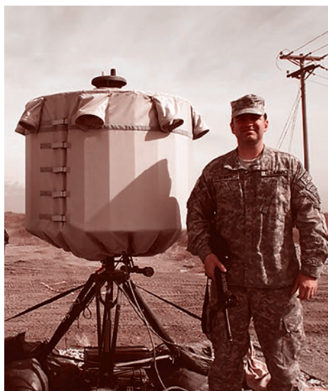
Легкий антиминометный радары AN/TRQ-48

В середине декабря американские структуры должны приступить к обучению украинских военных навыкам эксплуатации данной техники. Как пояснил Уоррен, «радарные системы отслеживают мины на полете, быстро определяют точку, из которой противник ведет огонь, и позволяют принимать соответствующие ответные меры». По словам представителя Пентагона, украинская сторона сама будет решать, когда, где и как использовать