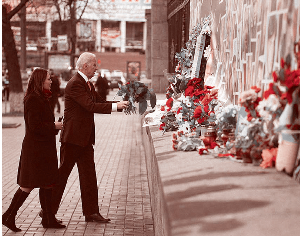
Д. Байден читает героев «Небесной сотни»

США считают, что для возобновления переговоров по урегулированию внутреннего вооруженного конфликта на юго-востоке Украины нужно дождаться «правильного времени». Об этом заявил 21 ноября представитель американской администрации журналистам, сопровождающим вице-президента США Джозефа Байдена в зарубежной поездке. Комментируя итоги переговоров Байдена в Киеве, представитель администрации признал, что на них обсуждались прежде всего претензии Украины к России. То, что делает РФ применительно к кризису на Украине, является неприемлемым, утверждал представитель правительства США. По его словам, значительная часть переговоров Байдена в Киеве была посвящена тому, как «послать России ясный сигнал» на этот счет.