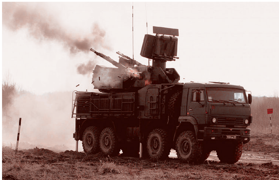
Зенитный ракетно-пушечный комплекс «Панцирь С-1»

Постоянное развитие средств нападения («копья») приводит к необходимости создания эффективных средств защиты («щита»). Причем, обеспечивать защиту всегда сложнее. Одним из новых эффективных защитных комплексов ПВО ближнего радиуса действия является ЗРПК «Панцирь С-1».