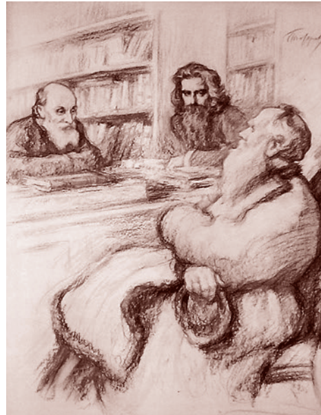
А. Пастернак. Федоров, Соловьев и Толстой. 1903 г.

Дух соборности и персонализма — подлинный дух культурного делания. Если говорить о библиотеке, то она — как и церковь — носительница