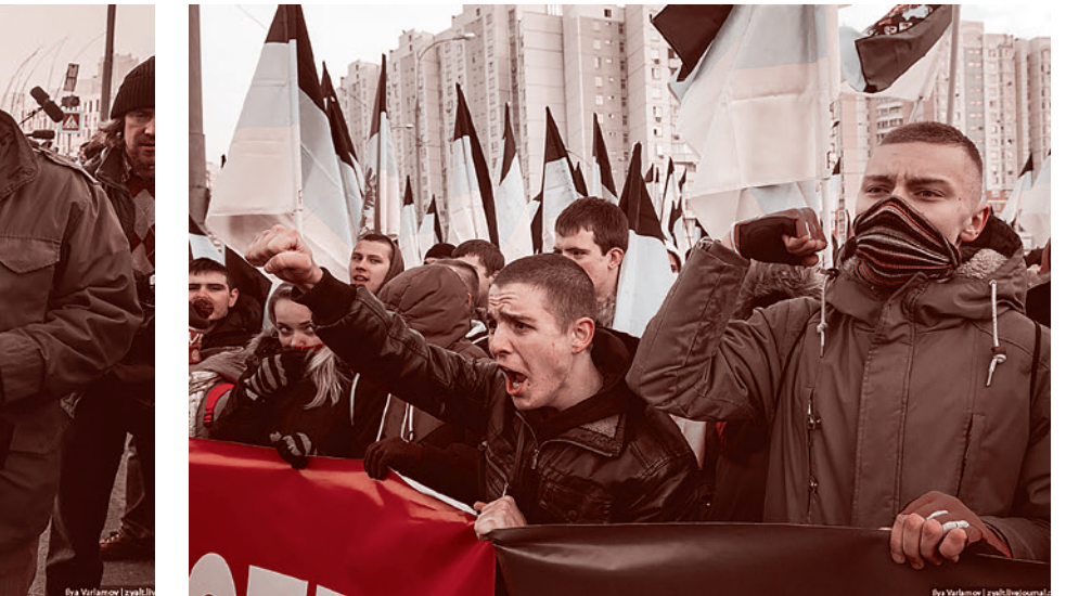
«Русский марш» 2014.

Требования манифеста весьма пестры. Есть среди них и вполне разумные — очищение властных структур от криминала, новая индустриализация, забота о здоровье нации и рождаемости, отмена ювенальной юстиции. Но есть и весьма сомнительные пункты — например, требование отменить антиэкстремистское