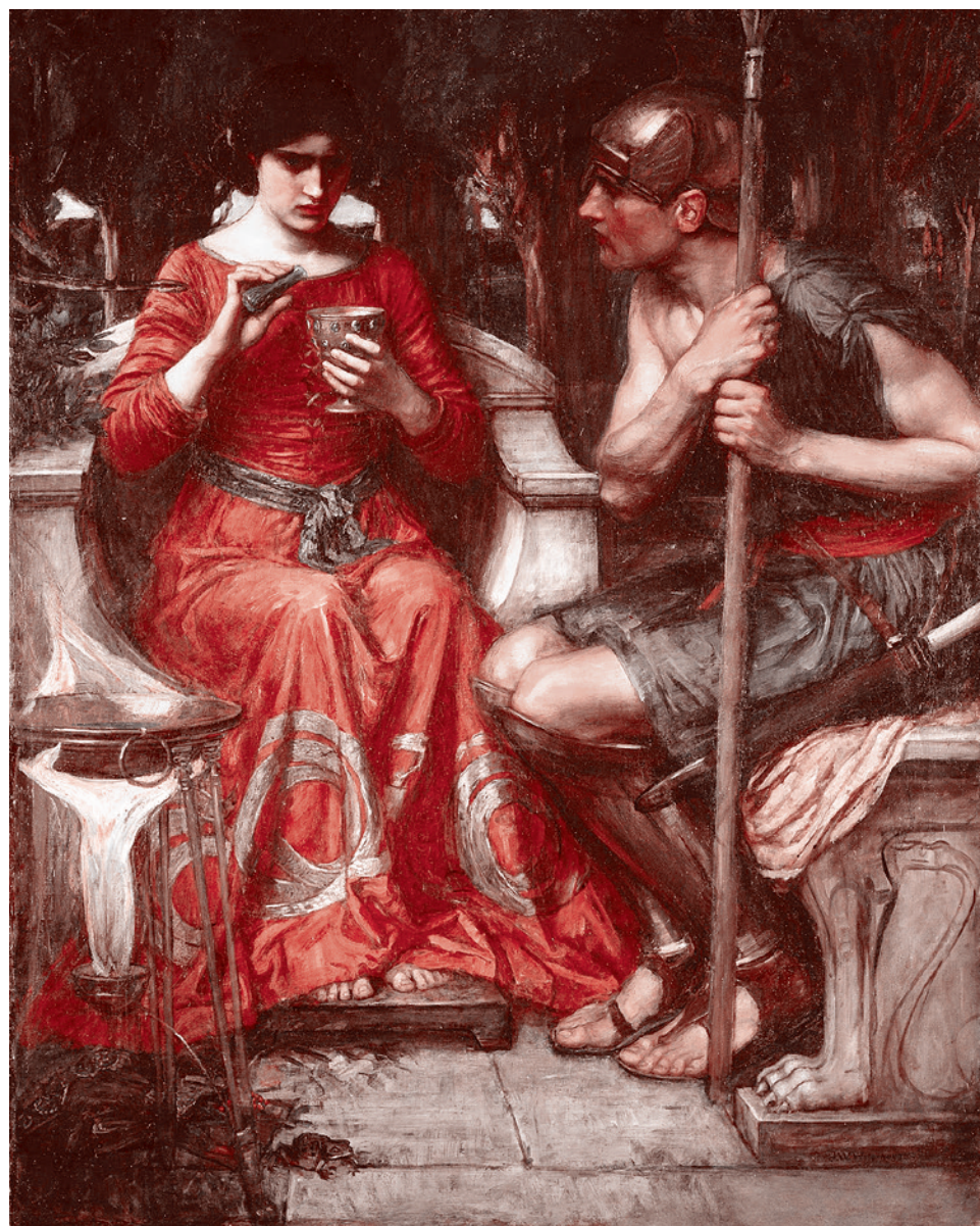
Ясон и Медea

Родоначальник — морской бог Посейдон. Он — отец Нелея, который вместе с братом-близнецом Пелием учредил Олимпийские игры, входил в число аргонавтов,