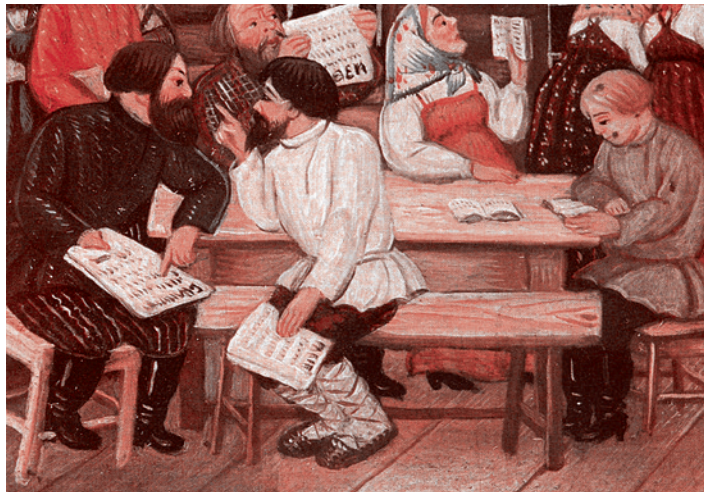
А.Е. Куликов. Изда-читальня. Панье-маше, роспись. 1925 г.

Да, мы не можем избежать внедрения в нашу жизнь электронных носителей. Но мы можем не допустить того, чтобы столь масштабные инновации повредили