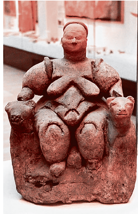
Богиня-мать. Чатал-Хююк, Турция. 6000 г. до н.э.

будучи причастен и к тому, и к другому, он может выиграть у Крита и его царя Миноса.