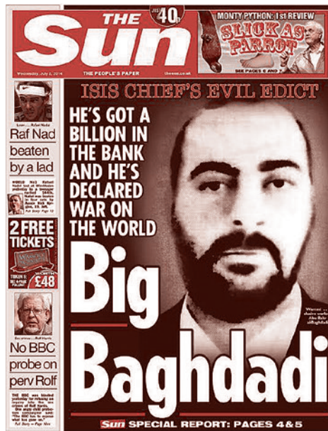
Аль-Багдади на обложке The Sun

Объявив себя халифом всех мусульман, Абу Бакр аль-Багдади сразу же призвал мусульман всего мира присягнуть ему. На этот призыв откликнулись исламисты